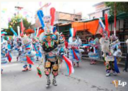
La promoción y salvaguarda del Carnaval entre las prioridades de la nueva autoridad