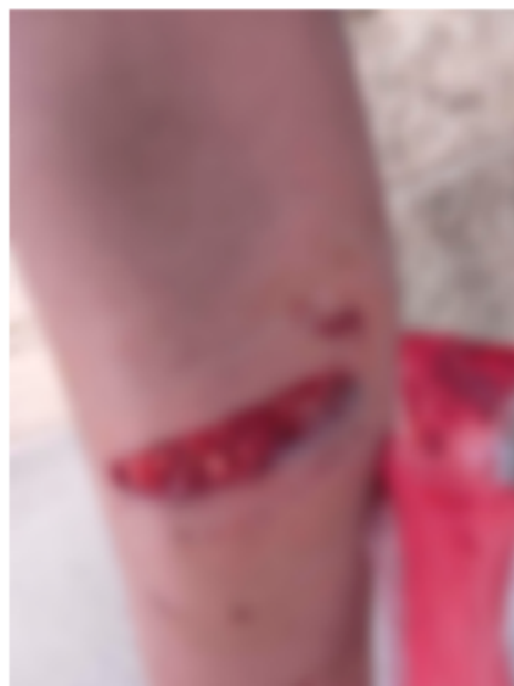
Mujer fue atacada por un can en la pierna

Desde el Sedes se recordó que su función es atender médicamente a las personas agredidas y aplicar vacunas antirrábicas. Sin embargo, el control de la población canina y el recojo de perros en situación de calle es responsabilidad del Gobierno Autónomo Municipal. En este contexto, se reiteró el llamado a las autoridades municipales para reforzar acciones de control y captura de animales agresivos, con el fin de prevenir nuevos ataques y reducir los riesgos para la población.