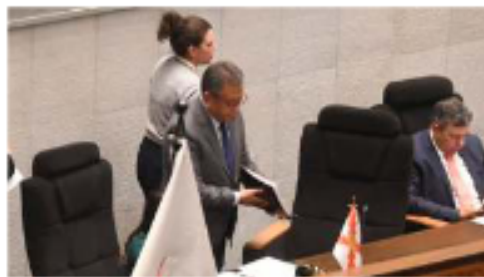
El ministro de Gobierno llegando a su interpellación en la ALP/MPG