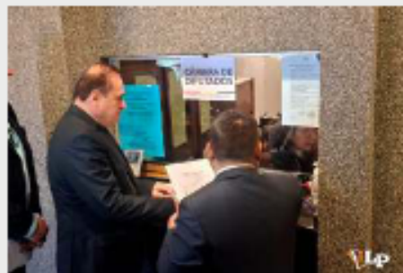
Presentación del procedimiento de juicio de responsabilidades contra los exmagistrados del TSJ