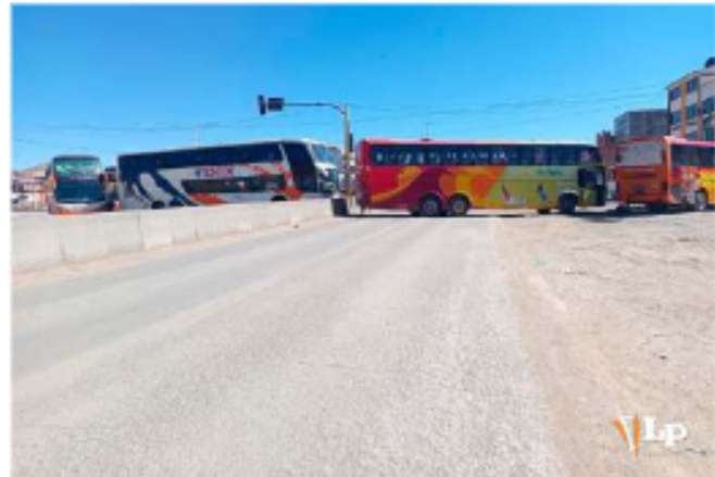
La avenida Circunvalación fue una de las más afectadas por bloqueos

Desde las 17:00 hasta las 18:00 horas, se empezaron a levantar los puntos de bloqueo que se habían apostado en zonas alejadas del centro. Los principales puntos de bloqueo incluyeron la avenida de Circunvalación, la avenida Al Valle, la Villarroel, el Casco del Minero, la