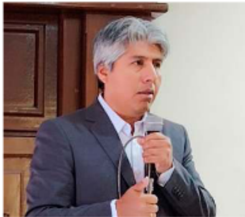
El gobernador de Oruro, Edgar Sánchez

Sánchez afirmó: "Todas las gobernaciones están quebradas, todas están endeudadas hasta el cuello". En este contexto, se comprometió a revisar proyectos como el Hospital General y el Parque de los Sueños, que tiene más de 50 millones de bolivianos