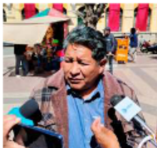
El dirigente del MIR pide paralizar las protestas contra el gobierno

1. Rechazar la actitud golpista del sindicalismo y de todas las organizaciones sociales del evismo, a las que acusan de ser causantes de