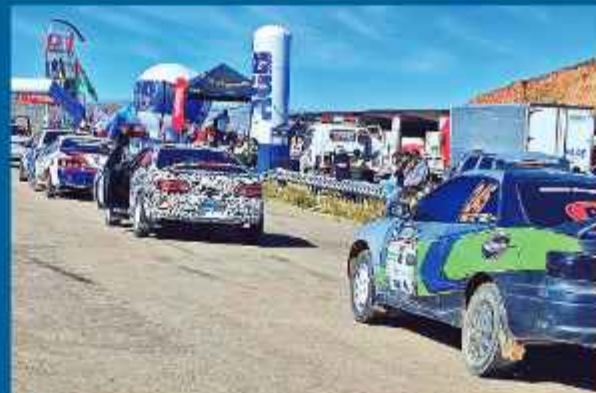
PARTIDA. Vehículos en el punto de partida en la pista de Pucarani.