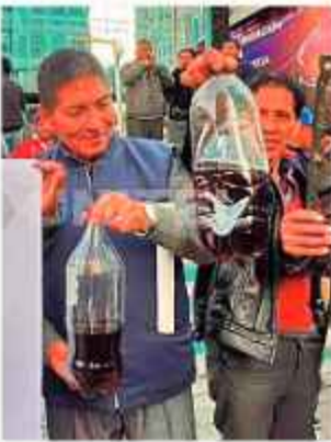
DEMANDA. Sectores piden abastecer de combustibles.

La crisis escaló con la decisión de la Federación Departamental de Campesinos Túpac Katari. Este sector iniciará un bloqueo indefinido en las 20 provincias este miércoles. Los trabajadores del agro exigen respuestas inmediatas a su pliego de peticiones y critican el abandono estatal en el área rural.