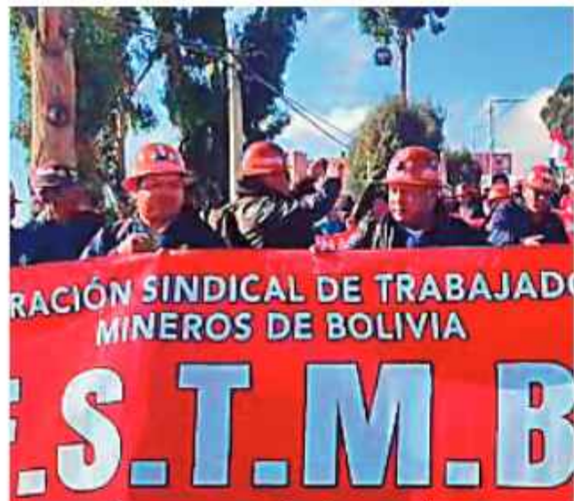
DETALLE. El sector minero asalariado se une a las protestas.

La Federación Sindical de Trabajadores Mineros de Bolivia (FSTMB) ratificó ayer que se encuentra en estado de emergencia nacional. No obstante, el sector descartó el cese inmediato de labores en los centros mineros, pese a la determinación que el secretario ejecutivo de la Central Obrera Boliviana (COB), Mario Argollo, anunció durante el ampliado del pasado viernes 1.