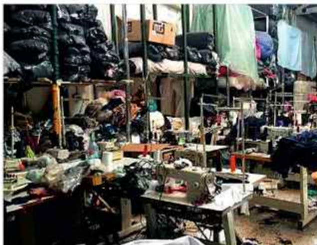
VIOLENCIA. La imagen es referencial, de un taller bonaerense.

Según la investigación preliminar del personal policial argentino, la mujer no solo era obligada a confeccionar prendas de vestir, sino que también las debía vender en ferias informales, principalmente en el complejo de La Salada. Durante el allanamiento del taller, los uniformados secuestraron maquinaria industrial, rollos de tela y mercadería lista para su comercialización, elementos que confirman la magnitud de la explotación comercial que se llevaba a cabo en el recinto. El hecho continúa bajo investigación.