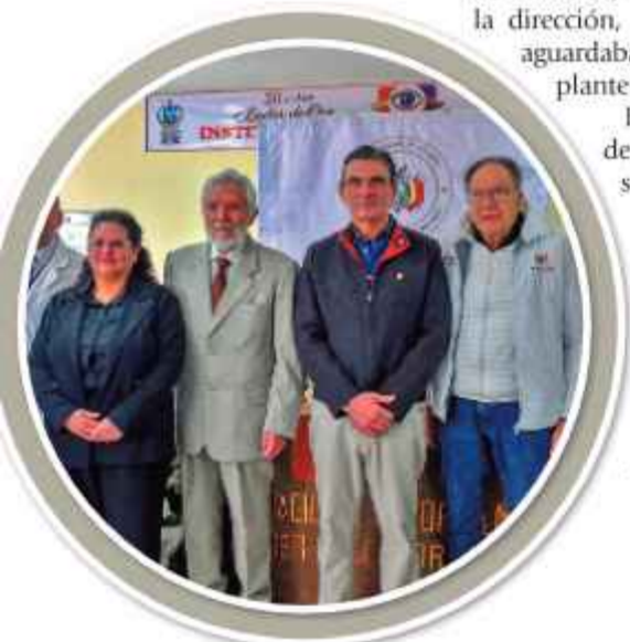
APERTURA. Autoridades y médicos en la inauguración del centro.

Los pacientes deben ser sometidos a diálisis para purificar su sangre y no morir.