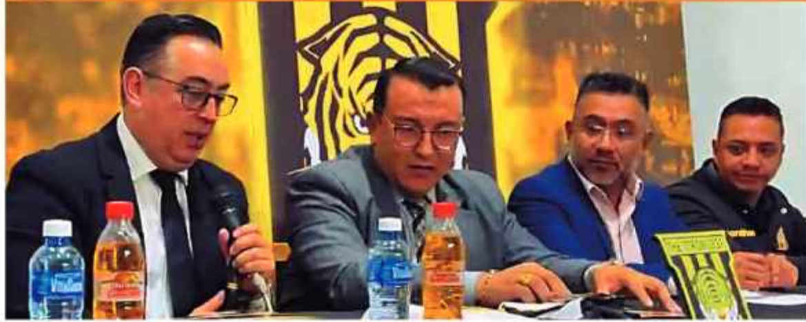
DIRIGENCIA. El presidente de The Strongest (centro) durante la conferencia de prensa de ayer en Achumani.

LOS PARTIDOS EN ACHUMANI SERÁN LOS DE "BAJO AFORO"