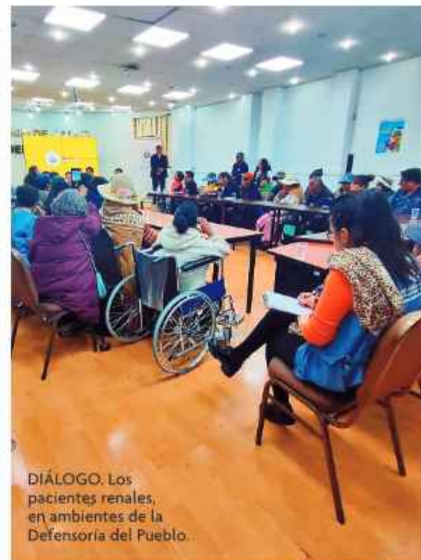
DIÁLOGO. Los pacientes renales, en ambientes de la Defensoría del Pueblo.