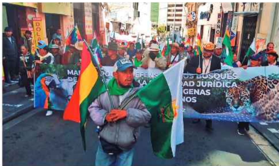
PERFILES. Mujeres, niños, ancianos y jóvenes participan en la movilización amazónica.

Sin embargo, la dirigencia calificó de "imposible"