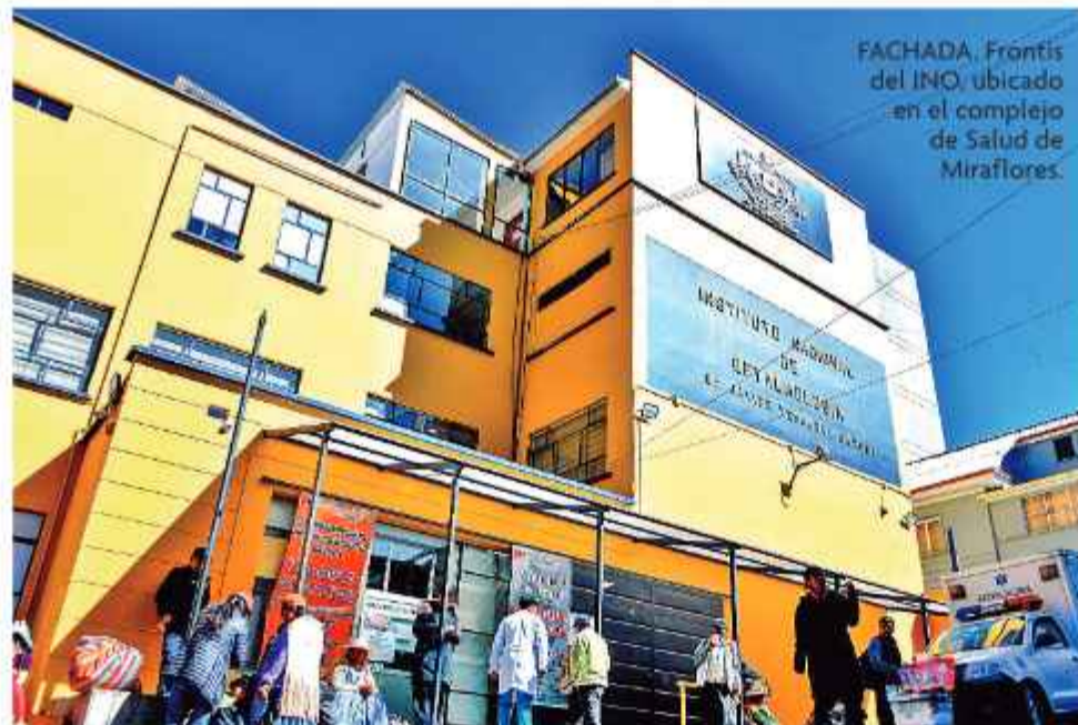
FACHADA. Fróntis del INO, ubicado en el complejo de Salud de Miraflores.

La historia de este centro expone las trabas de un "Es-