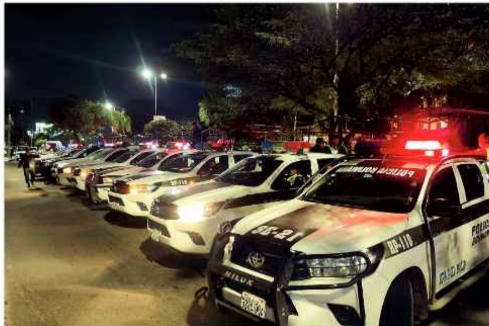
SEGURIDAD. El operativo en contra el crimen organizado fue activado el domingo 3.

La Policía Boliviana activó el operativo “plan Halcón contra el crimen organizado” en diversos puntos del departamento de Santa Cruz. El despliegue incluye patrullajes de saturación y controles en puntos fijos con el objetivo de reforzar la seguridad ante los hechos de sicariato producidos recientemente, como el asesinato del magistrado agroambiental, Víctor Claire.