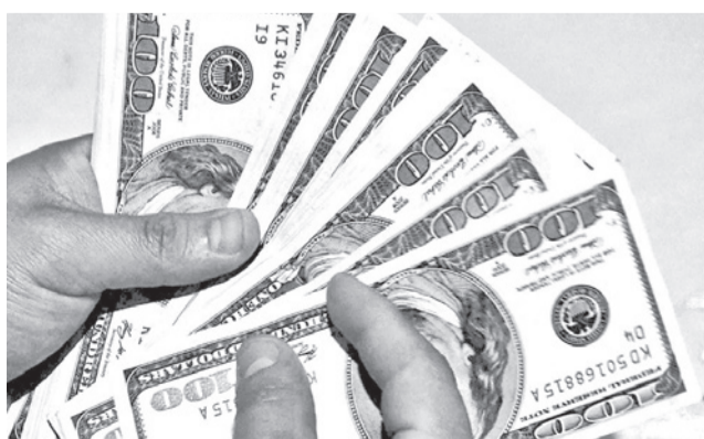
La oferta de dólares en el mercado boliviano. CARLOS LÓPEZ

La divisa estadounidense se había mantenido sin superar el umbral de Bs 10 en la cotización de calle desde antes de la publicación del dólar referencial del BCB, la cual se da desde fines de 2025.