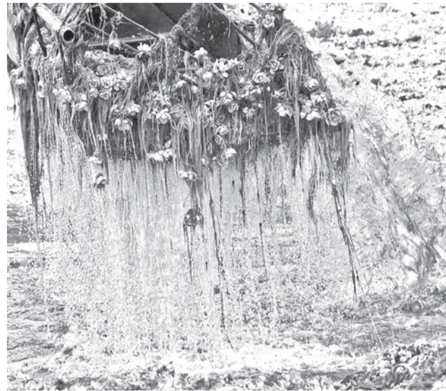
Se realiza una una prueba gratuita con el equipo.