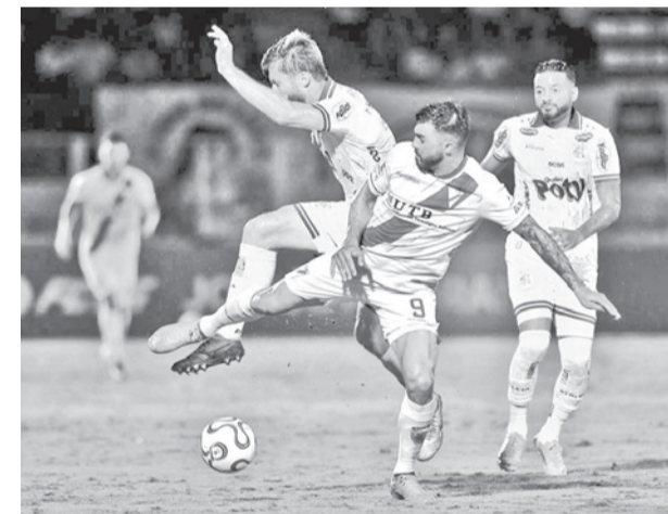
Always Ready cae ante Mirassol, ayer.

La derrota en la Copa Libertadores del equipo millonario además ocurre a pocos días del presunto alejamiento del director técnico Julio César Baldivieso, que finalmente quedó despejada con la permanencia y la ratificación de la confianza; pero, también con el pedido de mejorar el rendimiento en los torneos en los que está el equipo.