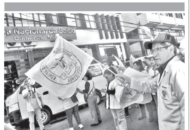
Marcha de Trabajadores en Salud en Cochabamba. J.R.

blemas acumulados, entre ellos canales sin limpieza, parques descuidados, alumbrado deficiente, calles con baches, conflictos en salud, salarios adeudados, transporte público y manejo de residuos sólidos. Además de Santa Cruz, varias autoridades de ciudades capitales han alertado sobre la mala situación.