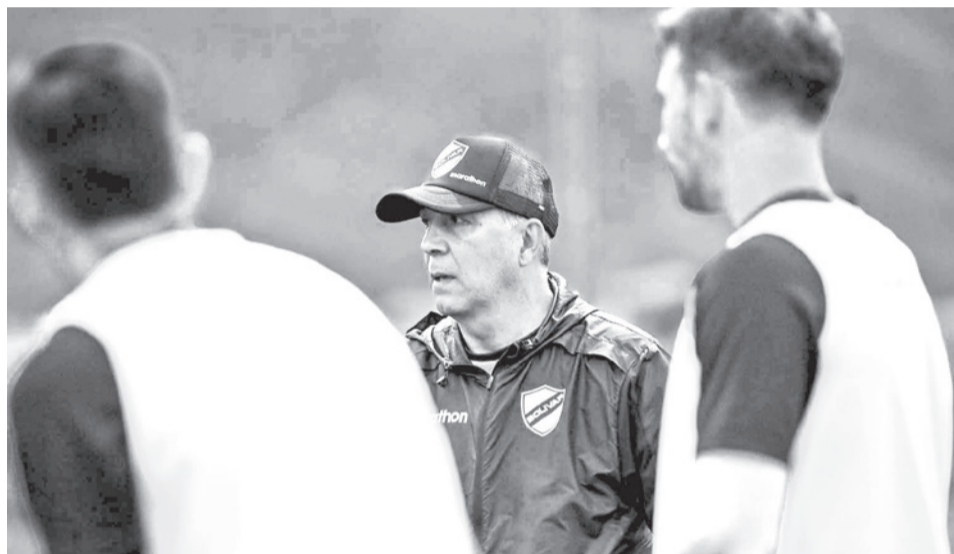
El entrenamiento de Bolívar con miras al partido en la Libertadores. CLUB BOLIVAR

En tal sentido ambos buscarán el desequilibrio, Bolí-