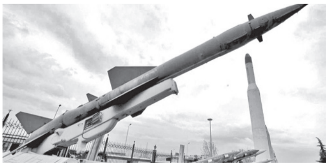
Misiles de fabricación iraní.

Armamento. Esta arma formaría parte de sus nuevas capacidades en el ámbito marítimo para hacer frente a EEUU e Israel