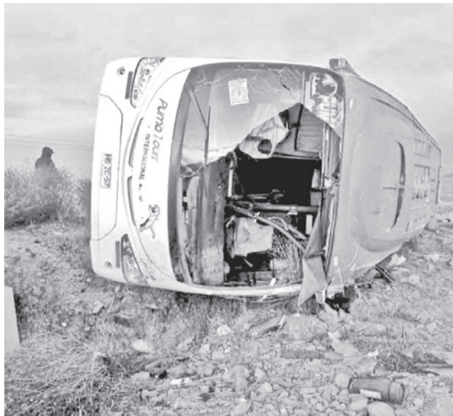
Restos del vehículo que sufrió el accidente en Oruro.