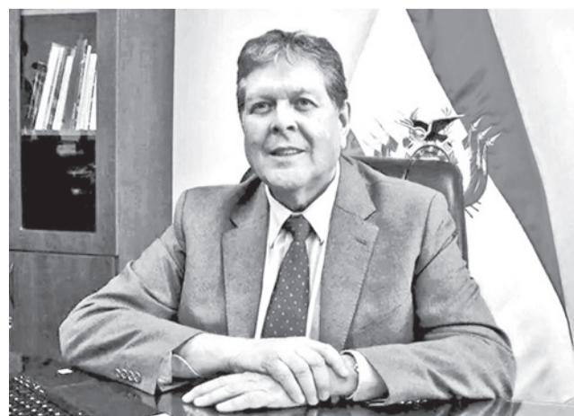
El ministro de Hidrocarburos, Marcelo Blanco.

El representante de Alianza Popular Rolando Pacheco defendió la interpelación y aseguró que corresponde al cargo y no a la persona que lo ostenta. “Quien debería venir es el Ministro de Hidrocarburos. Nuestra tarea es interrogar a los ministros, a la institución,