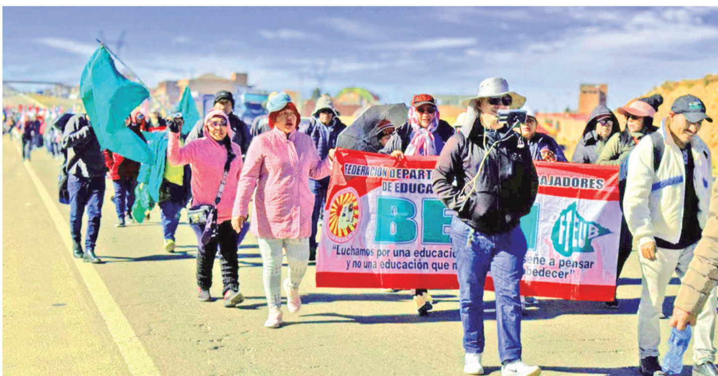
Más de un centenar de maestros marchan rumbo a La Paz en demanda de un incremento salarial y mayor presupuesto para educación.