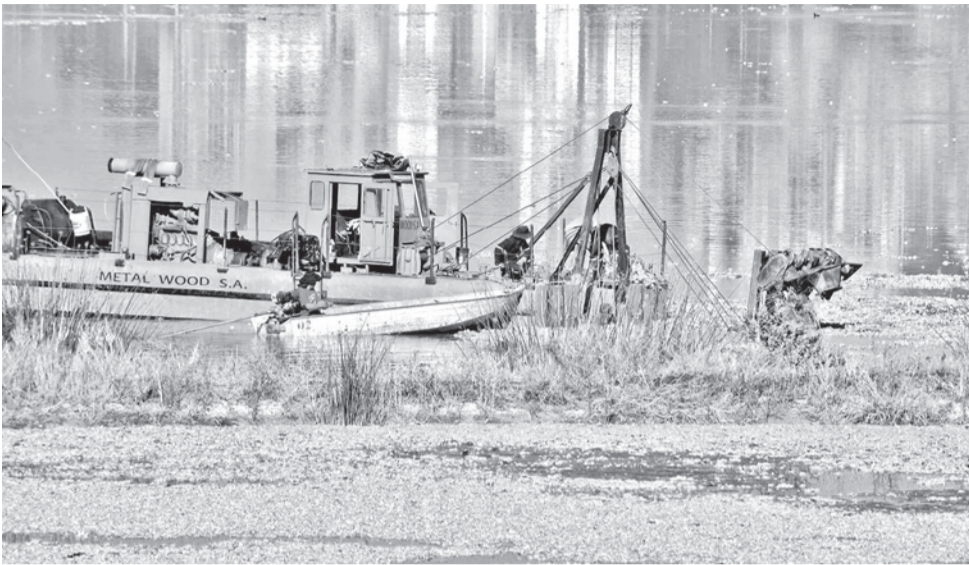
La "cosecha" de macrófitas con la maquinaria "anfibia" en Alalay.