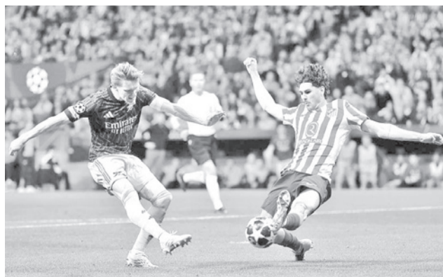
El partido entre el Atlético y el Arsenal. CHAMPIONS LEAGUE

siado, porque fueron conservadores, aunque sí hubo llegadas ante los arcos rivales y fue el visitante el que generó las primeras opciones a través del delantero sueco Viktor Gyokeres. El local respondió con remates del atacante argentino Julián Álvarez.