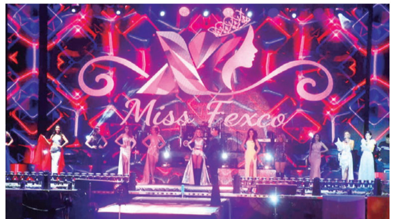
Las 10 azafatas que participaron en Miss Fexco.