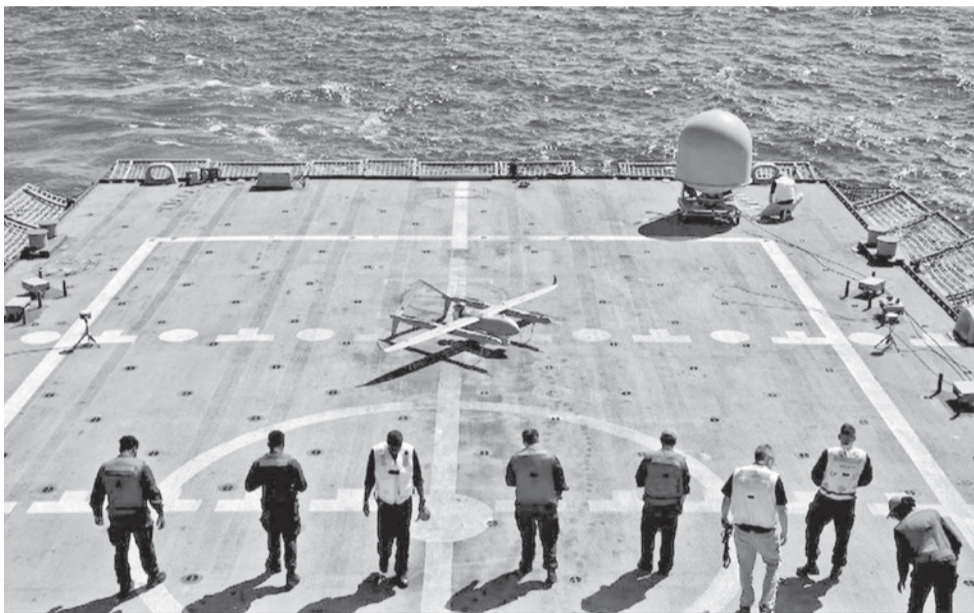
El ejercicio militar Flex2026 de Estados Unidos despliega inteligencia artificial y drones en zonas marítimas cercanas a Cuba.

Alerta. El despliegue de recursos tecnológicos responde al aumento de la vigilancia sobre rutas clave y eleva la tensión en el Caribe