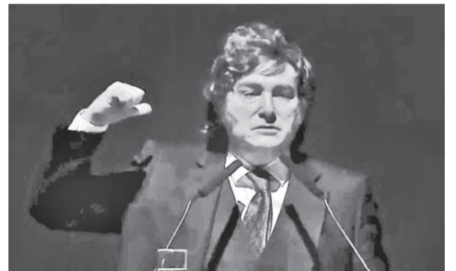
Javier Milei, presidente de Argentina.

“No voy aceptar la psicopateada, ni de los kukas ni de los mentirosos de los periodistas. Este grupo despreciable en un 95%, que hablan de mis respuestas pero no hablan de las mentiras: