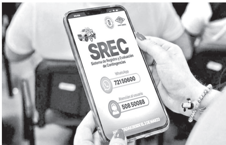
La aplicación del SREC para el registro de compensación. YPF

“Esto es sobre todo el resarcimiento de daños a nuestros hermanos transportistas. Yo he venido personalmente a trabajar con la nueva gestión para ver el resarcimiento y hacerlo cumplir a cabalidad”,