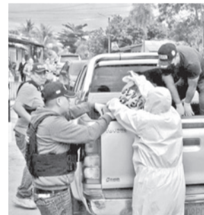
Lugar del crimen en Montero.

Inicialmente, el ahora aprehendido denunció un supuesto robo, lo que motivó la intervención de efectivos de la Fuerza Especial de Lucha Contra el Crimen