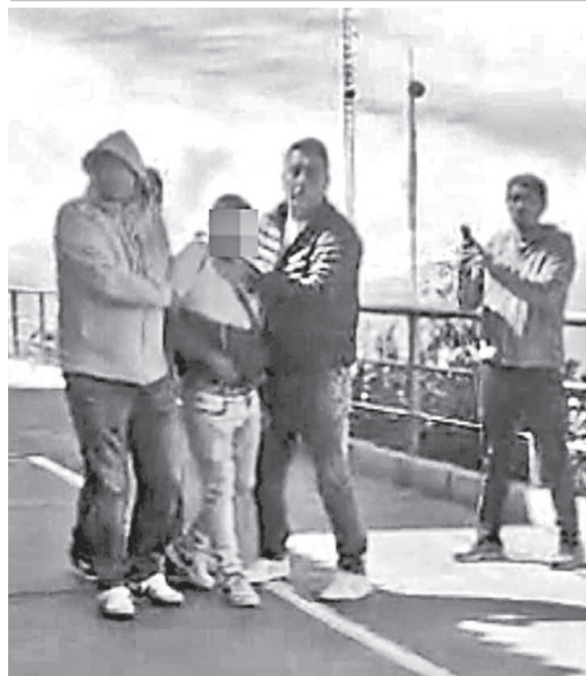
El sospechoso de feminicidio detenido en Perú.

Se presume que la víctima fue apuñalada en reiteradas oportunidades con un arma blanca, lo que le provocó la muerte.