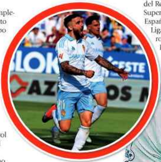
RETO. En el grito de un jugador del Tottenham Hotspur se resume la necesidad que tiene ahora el conjunto blanquiazul.

Dos equipos ascenderán a la Bundesliga (Primera División), en la cual Bayer Múnich ya se coronó campeón con anticipación, mientras avanza en la Champions League europea.