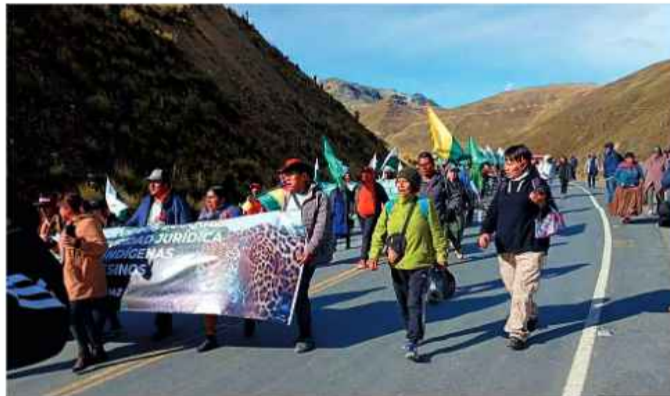
AVANCE. Los marchistas amazónicos recorren por la carretera La Paz-Yungas.

Por su parte, el Gobierno defiende la normativa como un pilar para la reactivación económica. El presidente Rodrigo Paz sostuvo que la