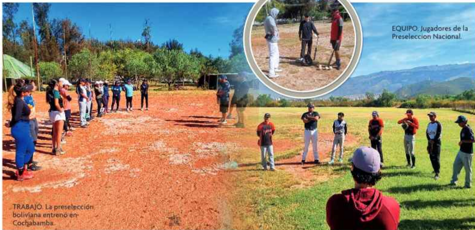
EQUIPO: Jugadores de la Preselección Nacional.