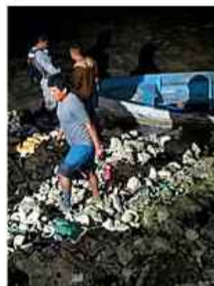
DATO. La familia del sector minero local está de luto.

rescate acudieron al lugar para la recuperación de los cuerpos. Las víctimas llegaron al hospital local, pero nadie presentaba signos vitales. Un informe forense determinó que los infortunados fallecieron por asfixia por sumersión. La Federación Regional de Cooperativas Mineras Auríferas se declaró en duelo.