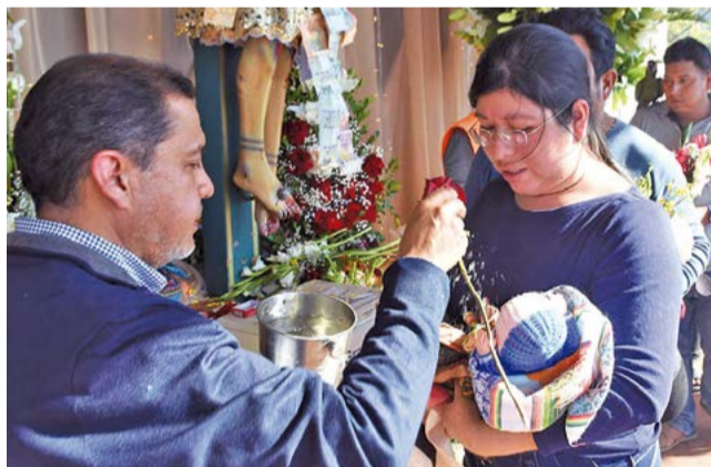
Una pareja, a los pies del santo pide la bendición para su bebé. HERNÁN ANDÍA