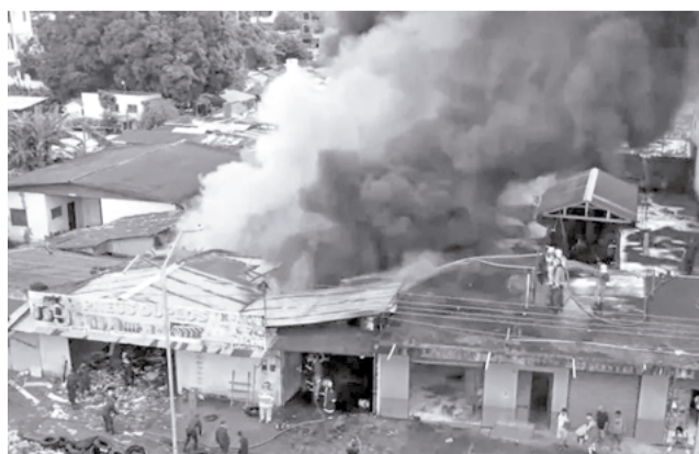
El incendio en una tienda de llantas en Cobija.

“Se nos ha presentado el día un incendio estructural, es