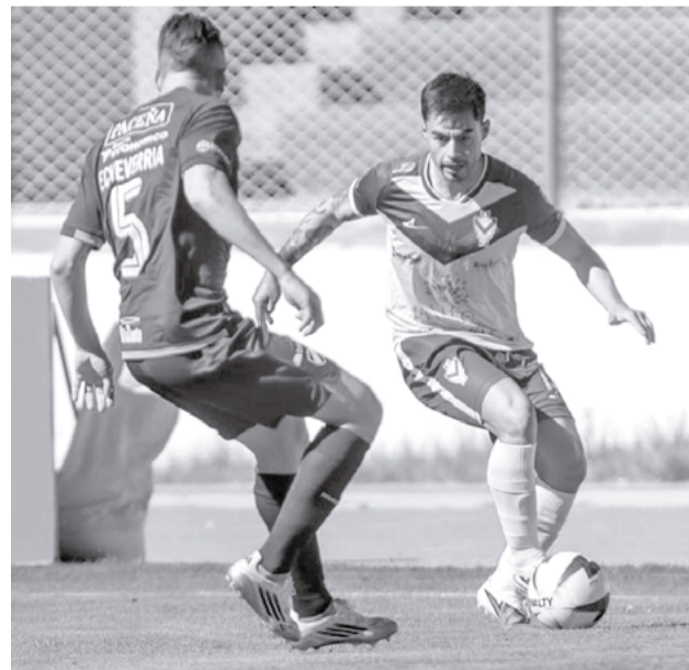
Jugadores de Bolívar y Gualberto Villarroel.

En la segunda parte, Bolívar mejoró e inquietó más