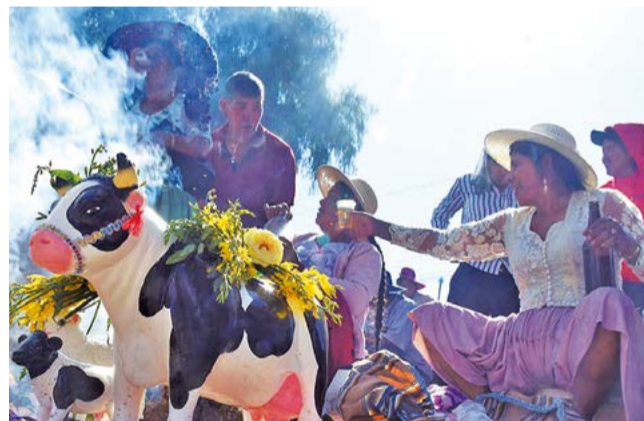
Familia ch'alla durante el ritual de la festividad de Santa Vera Cruz. HERNÁN ANDÍA

Mientras tanto, a tres días de cierre del botadero de K'ara K'ara, ya se observa acumulación de basura en distintos puntos del centro de la ciudad. Hasta el momento, la Alcaldía de Cochabamba no dio a conocer dónde se realizará la disposición final de los residuos sólidos.