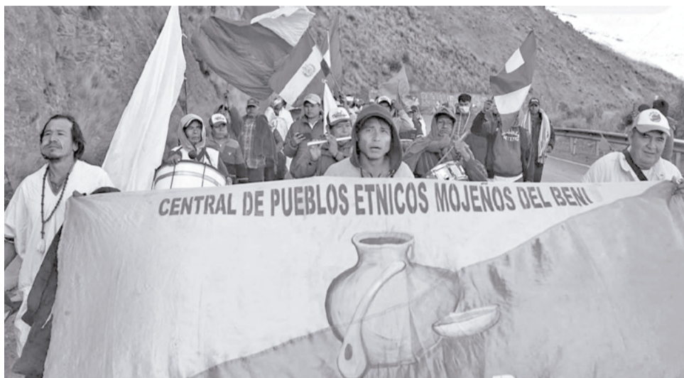
Los marchistas de Pando y Beni en la ciudad de La Paz, ayer.

Al agotamiento y la debilidad generalizada de sus cuerpos se suman el dolor de cabeza y la falta de aire, síntomas propios del mal de altura, que se ha convertido en el principal problema de salud de este grupo compuesto, en su mayoría, por habitantes de las tierras bajas. Los marchistas descansan en la tranca de Urujara.