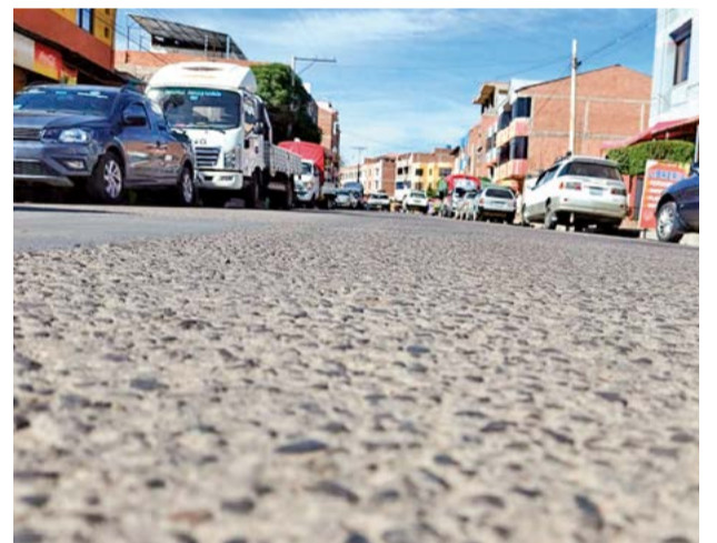
El asfalto deteriorado en el centro de abasto.