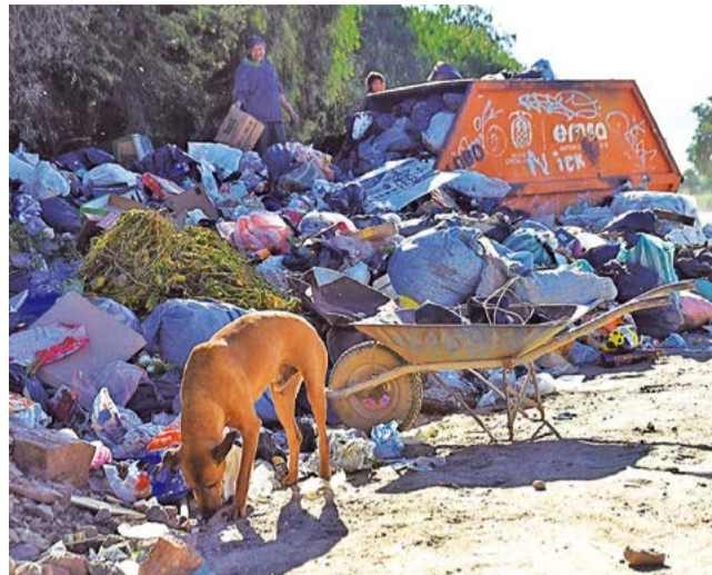
Basura se acumula en distintos puntos de la ciudad. HERNÁN