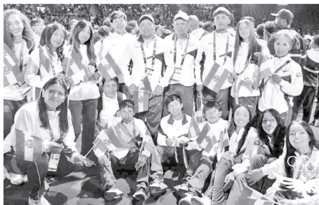
Participantes en los Juegos de la Juventud. COB

Los bolivianos tuvieron el consuelo de conseguir un metal de oro, aunque en una prueba de exhibición. Los organizadores convocaron