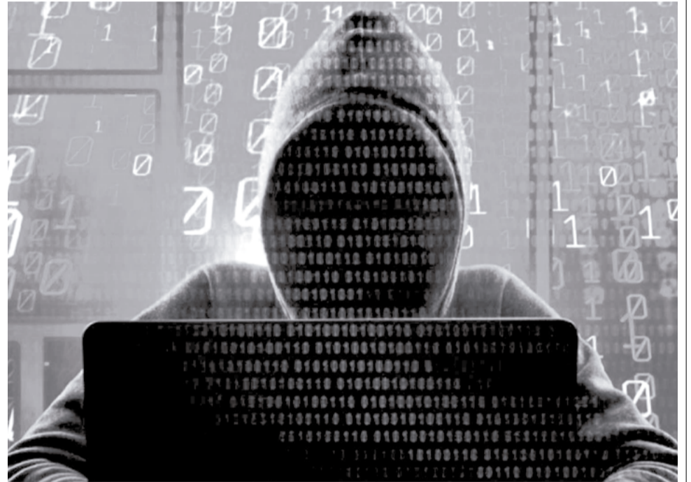
Las estafas son un nuevo delito que usa la tecnología. RRSS