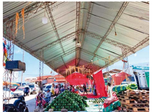
El techo de los puestos del Mercado Campesino.