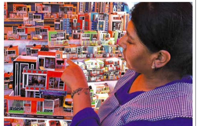
Comerciante explica los artículos más demandados en la festividad. HERNÁN ANDÍA