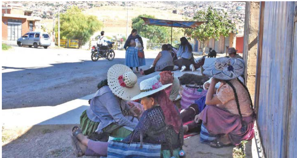
Vecinos de K'ara K'ara en vigilia en puertas del botadero. HERNÁN ANDÍA