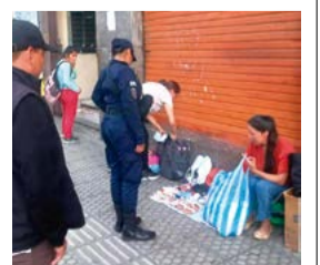
Control en el sector del Correo. INTENDENCIA

La Intendencia Municipal continúa con los controles en el sector del Correo para retirar a comerciantes informales. Y, Defensa del Consumido verifica la higiene y seguridad industrial de los puestos.