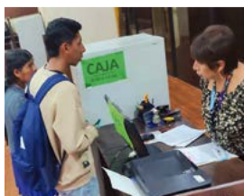
Los trámites de “Mi Casa Segura”.