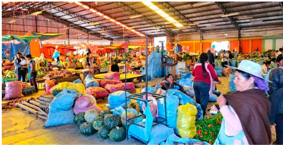
Los puestos de venta en el Mercado Campesino.

“Nosotros queremos un mejoramiento del techo, de los pisos, seguimos como antes, se han olvidado de este mercado”, recalcó. Anunció que mandarán un memorial a las autoridades solicitando el mantenimiento y mejora del mercado.