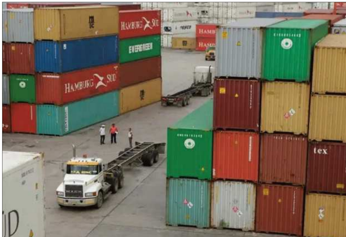
ACTIVIDADES. El comercio exterior de Bolivia en un puerto de salida de mercancías.

“Este comportamiento responde a un crecimiento significativo del 169,3% en las exportaciones de la industria manufacturera, debido principalmente al aumento en las ventas externas de oro metálico y productos derivados de soya, que se incrementaron en 975,3% y 48,2%, respectivamente”, explica el informe del INE.