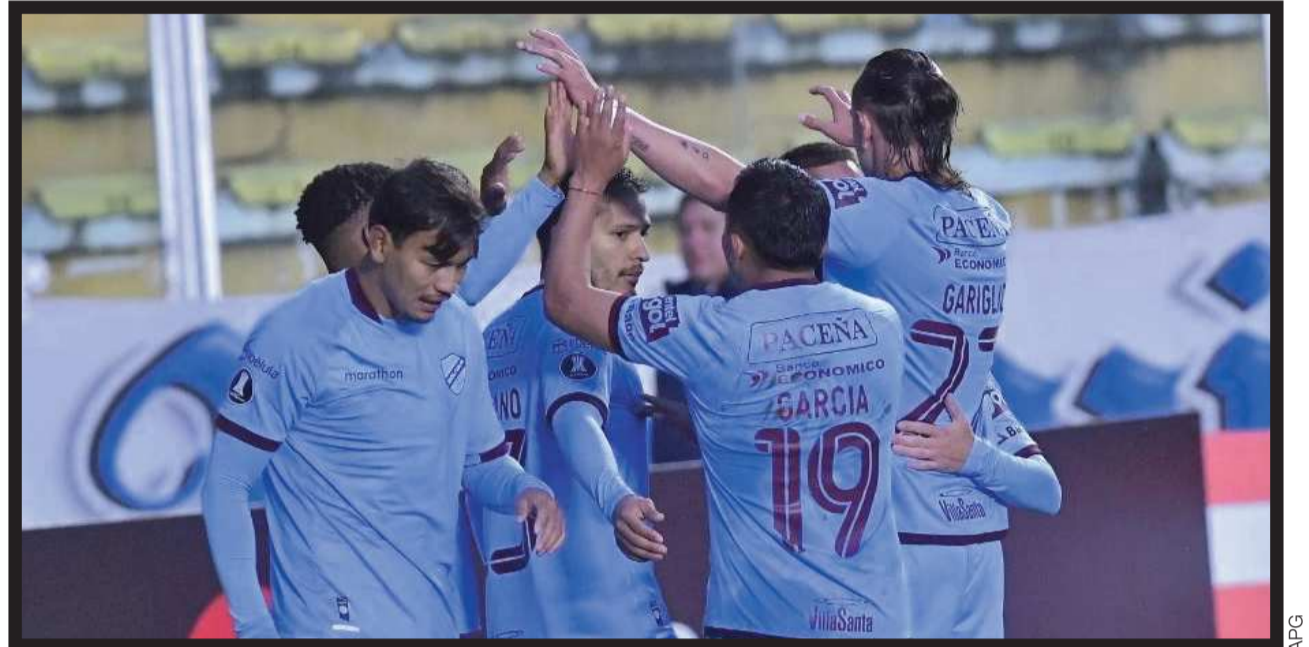
CELEBRACIÓN. Los jugadores académicos se congratulan en uno de los goles del Hernando Siles ante Fluminense.