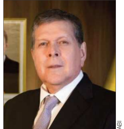
El ministro Marcelo Blanco.

La resolución dispone que el pronunciamiento se haga público a nivel nacional e internacional, con el argumento de alertar sobre una supuesta afectación al Estado de derecho en el país.