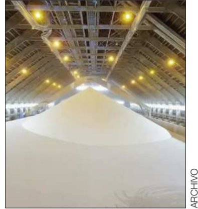
Proceso industrial de la urea.

La empresa cuenta con 10 puntos de venta a nivel nacional y se encarga del transporte del producto desde la Planta de Amoniaco y Urea de Bulu Bulu hasta los centros de distribución.