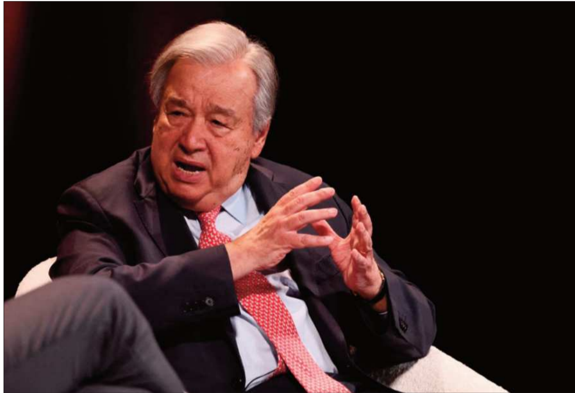
OPINIÓN. El secretario general de la ONU, Antonio Guterres analizó la coyuntura en Oriente Medio.

Irán advirtió ayer a Estados Unidos que el bloqueo de sus puertos está "condenado al fracaso" y prometió un estrecho de Ormuz sin presencia estadounidense.