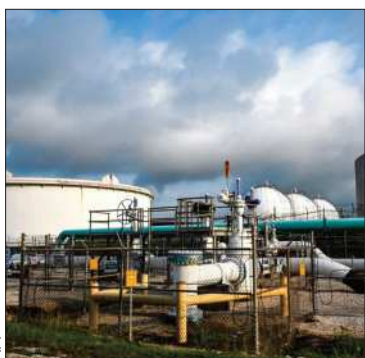
Baja la producción de crudo.

El barril Brent del mar del Norte, perdió un 3,41% hasta los 114,01 dólares.