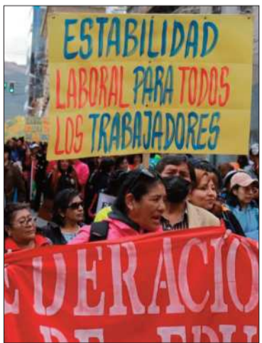
Movilización en calles de La Paz.

El Presidente pidió dejar atrás los pliegos y avanzar en los planes de trabajo