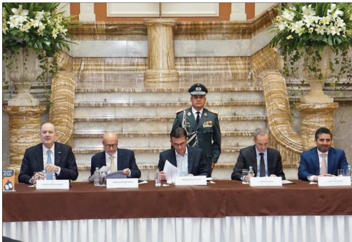
ENCUENTRO. El presidente Rodrigo Paz participa de una actividad institucional con el BID.

Estas propuestas, según indicó, estarán vinculadas al uso de un crédito de $us 800 millones otorgado por el Banco Interamericano de Desarrollo (BID), des-