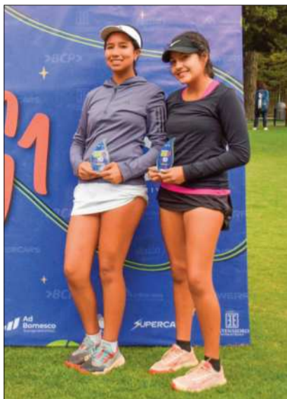
Las campeonas en dobles damas.

El torneo paceño está por llegar a su final con buenos resultados