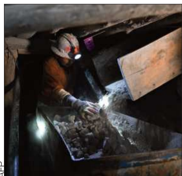
Extracción de minerales.

Las ventas del oro y la plata crecieron en 21,5% y 35% respectivamente