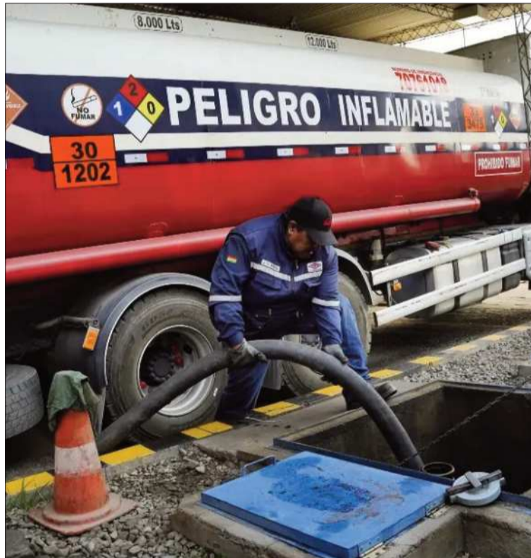
ABASTECIMIENTO. Un camión cisterna descarga combustible.

Las adquisiciones deberán sustentarse bajo criterios técnicos, económicos y de oportunidad, considerando la disponibilidad inmediata de productos, condiciones del mercado y la necesidad de garantizar el abastecimiento.