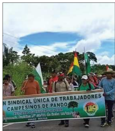
Marcha indígena en los Yungas.

La marcha se acerca a su fase final con el objetivo de ingresar a ciudad de La Paz