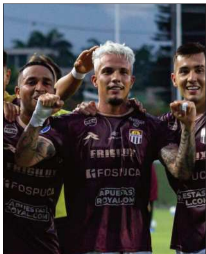
El festejo de Carabobo en Valencia.

El club venezolano ganó 2-0 al cuadro cruceño, que complica sus aspiraciones