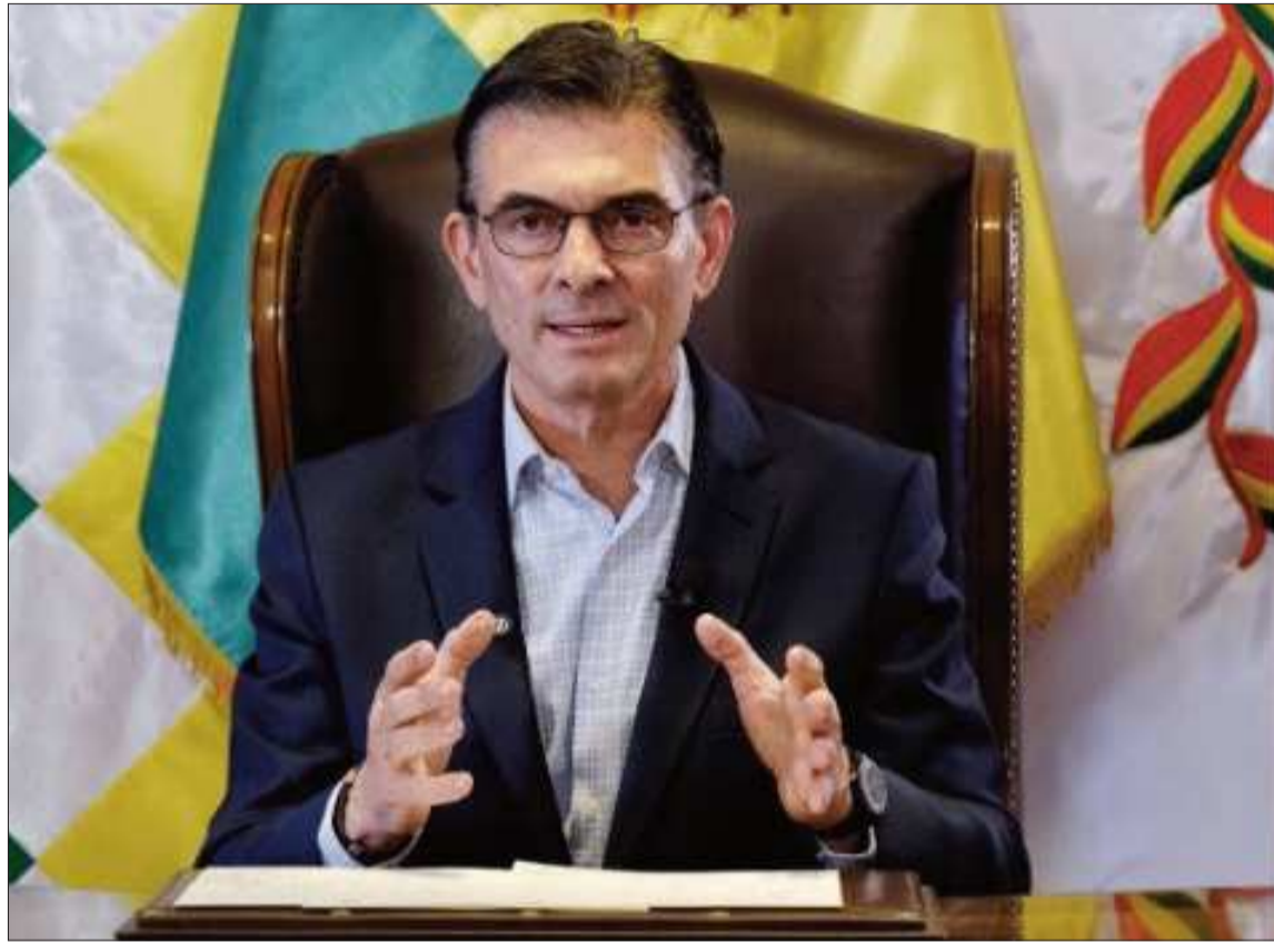
MENSAJE. El presidente Rodrigo Paz en su mensaje grabado por el Día del Trabajador.

Asimismo, anunció que en mayo el Gobierno presentará un paquete de leyes orientadas a dinamizar la economía. “Las leyes de hidrocarburos, de energía, de