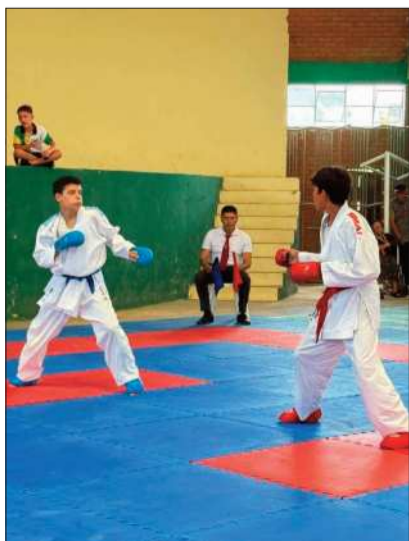
Algunos karatecas bolivianos.

Más de 600 atletas de diferentes ciudades estarán en el Festival