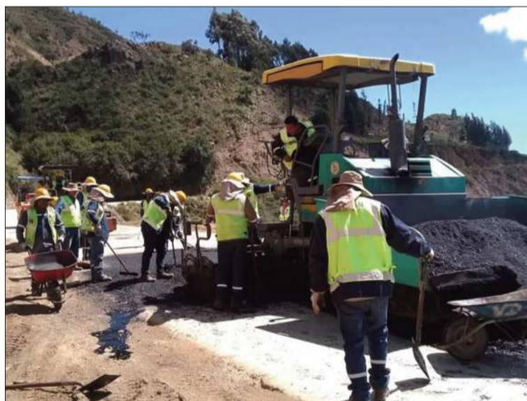
REFACCIÓN. Trabajos de mantenimiento vial en una carretera del país.

Durante una rueda de prensa, la autoridad explicó que los recursos se distribuirán en 84 áreas