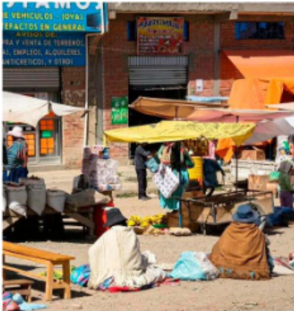
El comercio va en aumento / ORGANISMO

La estabilidad laboral se ha convertido en un privilegio de pocos. La tendencia hacia la precarización y los contratos de corta duración ha precarizado la planificación de vida de las