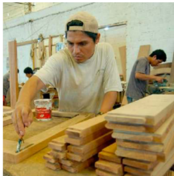
Los trabajadores independientes aumentan por falta de trabajo

El comercio urbano, los trabajadores independientes y las actividades económicas cotidianas reflejan tanto la resiliencia de la fuerza laboral boliviana como la urgencia de abordar sus limitaciones estructurales. En 2026, el foco debe estar en generar empleos no solo cuantitativos, sino de mejor calidad.