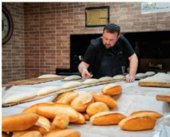
La fragancia única de la panificación tradicional, fruto del oficio del panadero / PIRELLA