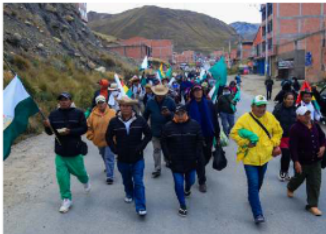
Personas participan en una marcha indígena este sábado en La Paz

"Le estamos dando 24 horas al Gobierno nacional a partir del día