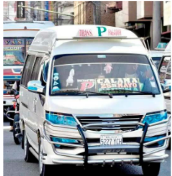
El transporte público es parte de la actividad económica urbana / OPINIÓN

Los grupos poblacionales enfrentan las barreras más altas: los