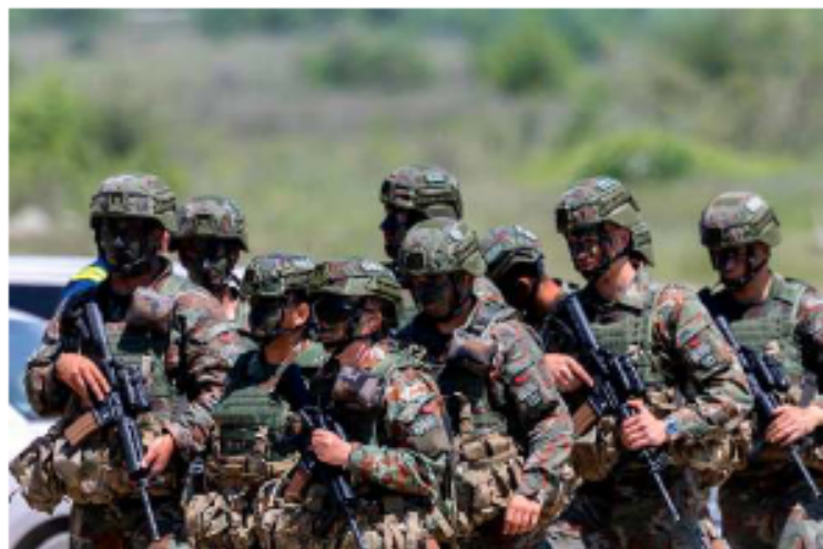
Ejercicios militares de la OTAN en Macedonia

La portavoz aseguró: "Seguimos confiando en nuestra capacidad para garantizar nuestra disuasión y defensa a medida que continúa este cambio hacia una Europa más fuerte en una OTAN más fuerte".