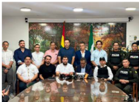
Autoridades políticas, judiciales y de seguridad participaron en la reunión de este sábado

El comité está compuesto por representantes del Ministerio de Gobierno, la Fiscalía, la Policía y otras autoridades. En declaraciones, Oviedo manifestó: "Se conforma en Santa Cruz el grupo