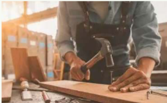
Lejos de ser vestigios del pasado, los oficios artesanales actúan como el motor que mantiene vivo el pulso de nuestras tradiciones / PANTASOT

La artesana boliviana comunica historia y pertenencia y ofrece al mundo un potencial visual único con colores vibrantes y simbologías profundas. Al amanecer, las calles se impregnan del aroma inconfundible que emana de la panificación tradicional. En hornos de barro y piedra, los panaderos sostienen una rutina forjada a través de los años. El pan de bañalla, la marraqueta y la sarnita trascienden su labor alimenticia para convertirse en símbolos de identidad social. Esta labor representa una actividad urbana vital, pero menos valorada en su complejidad técnica.