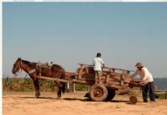
La agricultura emplea a uno de cada tres trabajadores ARENALIA BOLIVIA

detiene. Desde la señora que vende galletitas en la esquina hasta el joven que vende su propia ropa por redes sociales para generar movimiento económico, todos buscan una manera de solventarse y alcanzar sus sueños. Ya sea con un pequeño emprendimiento o ascendiendo en una empresa, el verdadero desafío del país es transformar esa energía incansable en empleos dignos, estables y con derechos que garanticen un futuro seguro para quienes sostienen día a día la economía nacional.