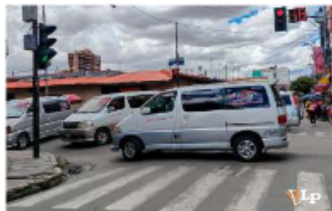
El transporte de Oruro se prepara y confirma sumarse al paro el martes 5 de mayo

Así, el sector del transporte se suma a una serie de demandas sociales que persisten en el país, en medio de un contexto económico y político complejo.