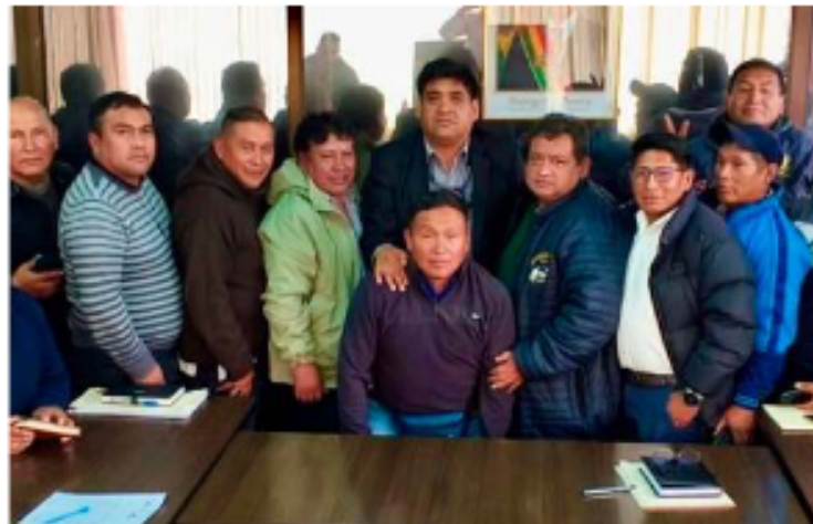
Dirigentes del Transporte Libre al terminar la reunión con el viceministro de Transporte, Hugo Criales

la Confederación, indicó: "Se ha determinado este paro nacional e internacional. Estoy seguro que el pueblo se va a sumar a esto, porque verdaderamente ya no podemos seguir viviendo de promesas". Gómez añadió que este paro escalonado se ha aprobado primero por 24 horas, luego 48 horas, 72 horas y finalmente indefinido a partir del 5 de mayo.