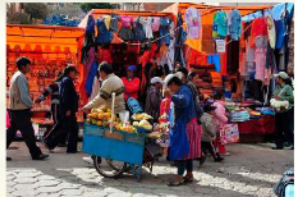
El comercio informal es el trabajo diario que tienen algunos ARENALIA BOLIVIA

El panorama económico para este primero de mayo de 2026 está presionado por la inflación por diversas causas, afectando el poder adquisitivo de quienes ganan del día. Como respuesta, el Gobierno incrementó el salario mínimo a 3.300 bo-