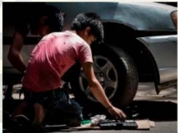
Niños y jóvenes sacrifican su estudio para solventarse económicamente / HUMANUM

livianos en 2026. Además, se ha planteado una Ley de Alivio Tributario y la devolución del 100% del crédito fiscal para intentar formalizar a los pequeños emprendedores.