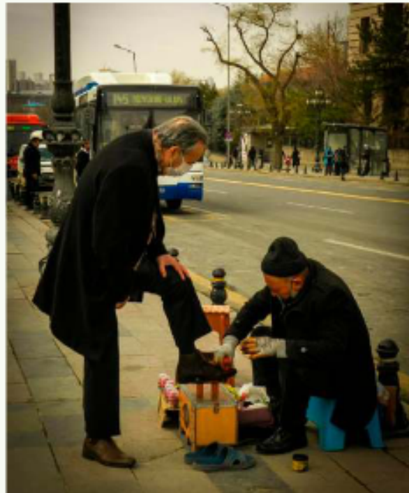
Los lustrabotas actúan como pilares sociales en las plazas de nuestro país

En las esquinas comerciales, la reparación de calzado y relojería ofrece lecciones sobre sostenibilidad. Estos maestros devuelven vida