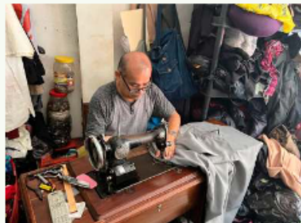
Calidad en cada costura y expertos en reparación de calzado / PIRELLA

a objetos que podrían ser desechados por la modernidad. El relojero opera sobre engranajes minúsculos con precisión mientras el zapatero refuerza suelas.