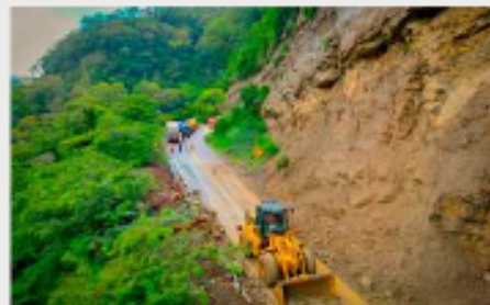
ABC impulsa contratos de mantenimiento vial por 18 meses /MDEV