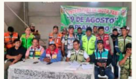
Los mototaxistas tuvieron una asamblea este sábado