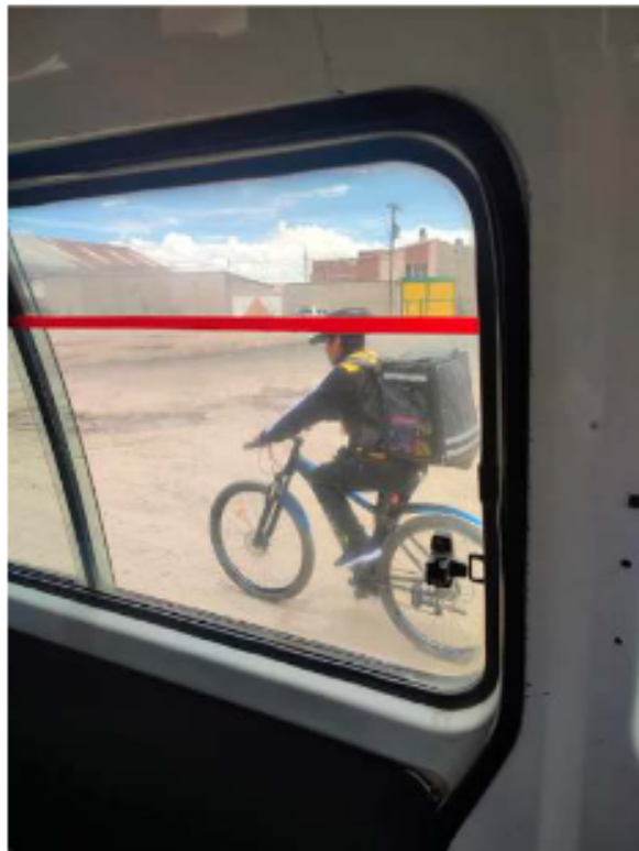
Celebrar la fuerza, honrar la adaptabilidad / LA PATRIA

El homenaje este 1 de mayo es para el trabajador que maneja una máquina de coser y para quien programa líneas de código; para el emprendedor que envía sus productos por una app y para el profesional que asesora a través de una pantalla. En un mundo cada vez más automatizado, la esencia humana, la creatividad, el ingenio y la empatía siguen siendo el motor que le da propósito a la economía global.