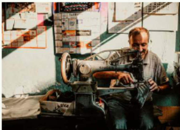
El sastre confecciona prendas exclusivas que capturan y proyectan la identidad de cada cliente

La elegancia tiene su hogar en las sastrerías y carpinterías. El sastre confecciona prendas que se ajustan a la identidad del cliente, manteniendo viva la tradición del buen vestir. Por otro lado, los carpinteros