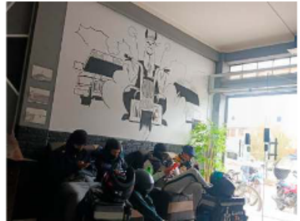
La era moderna abrió paso a nuevas formas de trabajo / LA PATRIA

En este escenario surge la figura del Creador de Contenido no como