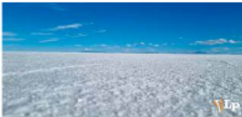
Algunos buscan priorizar el agua, otros proponen mejorar regalías por extracción de litio

Este proceso refleja un escenario de posiciones diversas: mientras algunos sectores ven en el litio una oportunidad económica, otros priorizan la preservación del agua y el desarrollo de actividades como el turismo. En ese equilibrio, las comunidades buscan construir una posición común. La meta es clara: cualquier normativa sobre el litio no solo debe responder a intereses económicos o técnicos, sino que debe ser expresión directa del territorio que sustenta ese recurso.