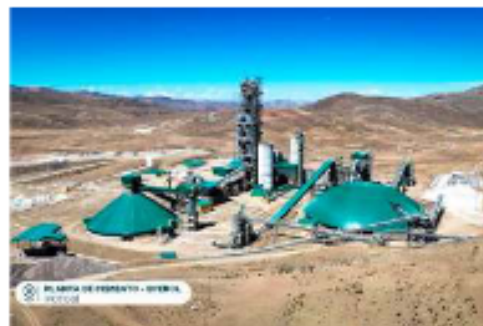
Tres años después, emergen irregularidades en la planta de cemento Ecebol /SEIEM