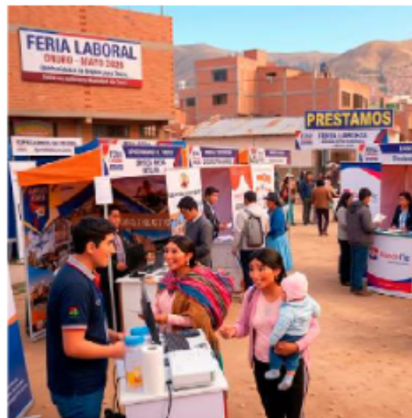
Es necesaria la realización de ferias laborales