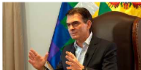
El jefe de Estado anuncia diálogo nacional y envío de leyes estructurales

Finalmente, cuestionó los pliegos petitorios y el pedido de incremento salarial del 20%, argumentando que la economía y las instituciones están debilitadas. En este contex-