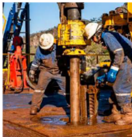
Operarios trabajando en la perforación de un pozo petrolero