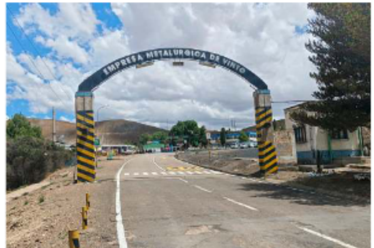
Se estima la venta de 11.979 toneladas para 2026 / LA PATRIA