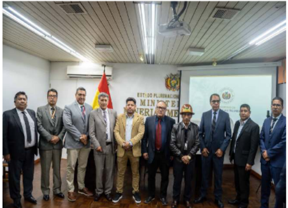
Distintas autoridades participaron de la Rendición Pública de Cuentas Inicial 2026 del Ministerio de Minería y Metalurgia

Sin embargo, la empresa enfrenta desafíos significativos. Llanos mencionó las deudas acumuladas con la Empresa Minera Huamant y la Empresa Minera Colquiri por la venta de concentrados como uno de los principales problemas. También destacó los altos niveles de escoria generados diariamente y el desgaste del