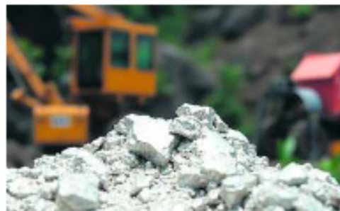
Las exportaciones aumentaron un 86,6% en los primeros meses de 2026, impulsadas por la minería /c. ocaza

Los datos parciales del Instituto Nacional de Estadística (INE) indican que en el primer bimestre las ventas externas alcanzaron 2.221 millones de dólares. Este resultado representa un crecimiento de 86,6% frente al mismo periodo de 2025. La industria manufacturera y la extracción minera tuvieron