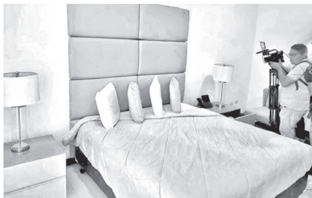
La Casa Ejecutiva de la estatal en Las Palmas. YPFB

En el lugar se observaron muebles de alta gama, cuadros, esculturas, salas de karaoke y equipos electrónicos “de última generación”.