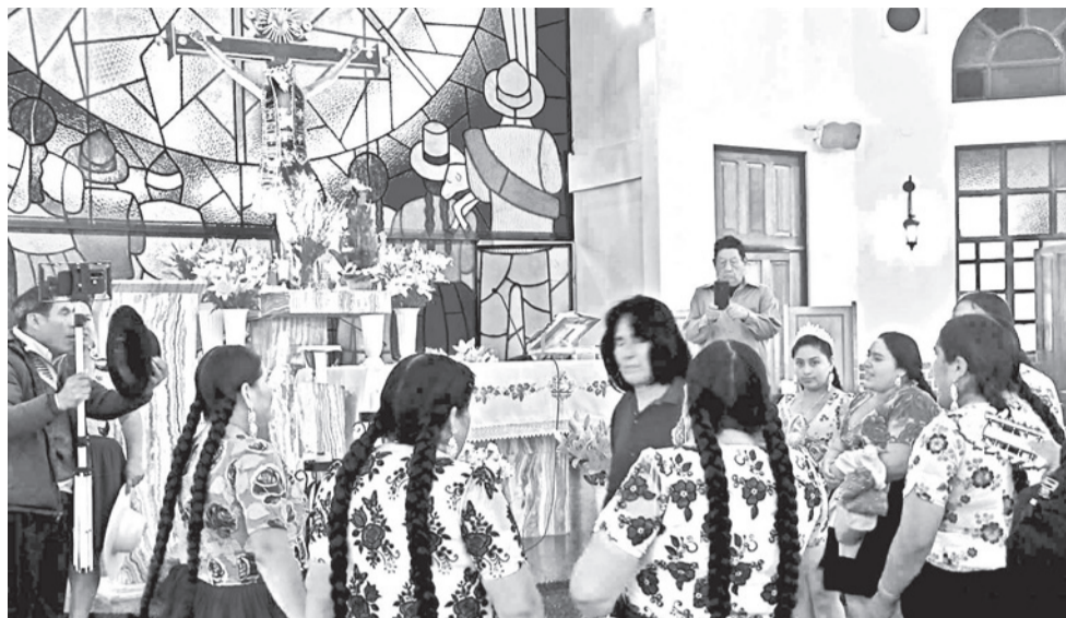
Cantantes de coplas en el templo de Santa Vera Cruz, ayer.