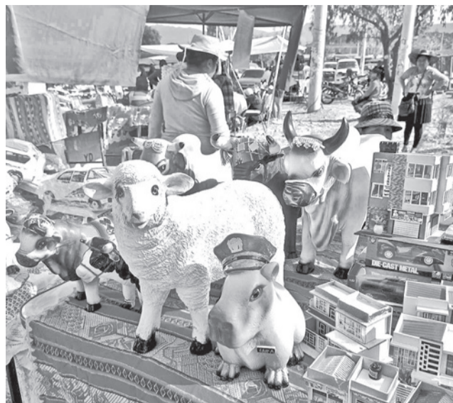
La oferta de artesanías para la fertilidad.