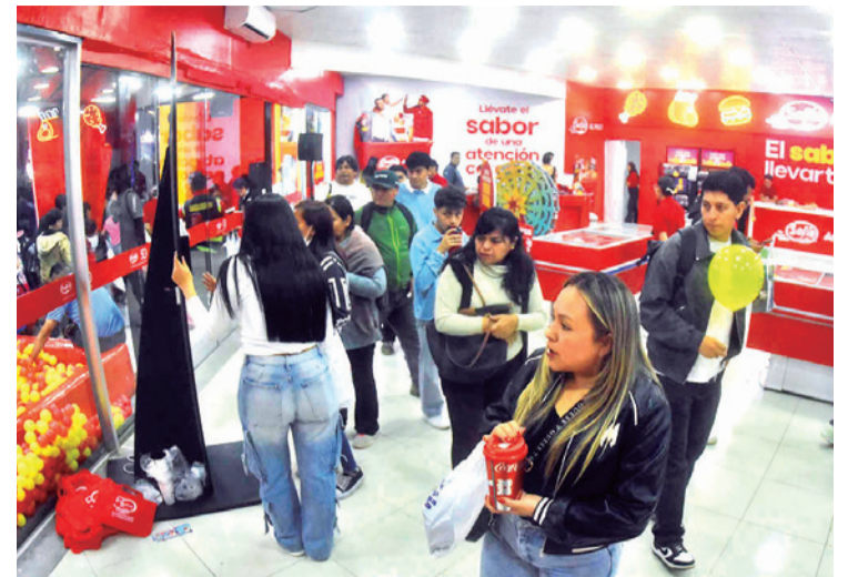
Los visitantes en la Fexco 2026, en Alalay.

La presencia de Cadepia en la Fexco 2026 reafirma el papel de la pequeña industria como base productiva, generadora de empleo y articuladora de desarrollo, consolidando a la feria como un espacio estratégico para visibilizar la producción boliviana y ampliar sus oportunidades de crecimiento en el mercado.