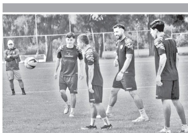
Un entretenimiento de Aurora. CARLOS LÓPEZ

El campeón nacional se ubica último en el grupo G sin unidades, el líder es LDUQ con seis puntos, mientras que Lanús y Mirassol tienen tres unidades cada uno. En tal sentido, Always Rewady necesita ganar ahora. "Es un partido complicado", dijo el técnico de Always Ready.