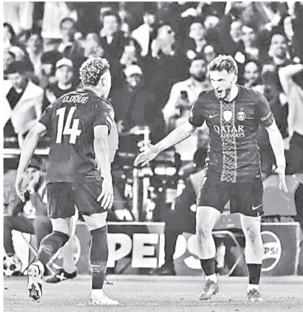
El partido entre PSG y Bayern de Múnich. PSG

La visita abrió la pizarra en el minuto 17 por un penal bien ejecutado por el inglés Harry Kane, ventaja revertida por los parisinos gracias a los tantos de Kvaratskhelia (24') y Joao Neves (33'). Michael Olise igualó el marcador en el 41' con su quinta diana en el torneo, pero justo antes de