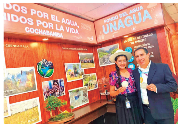
El Fondo del Agua en el stand de la Gobernación. UNAGUA

La ampliación de espacios, la diversificación de sectores participantes y la agenda multisectorial generan condiciones para el fortalecimiento del tejido empresarial. La feria proyecta un impacto directo en comercio, servicios, turismo, industria y emprendimiento, articulando actores públicos y privados en una plataforma que dinamiza la economía regional y posiciona a Cochabamba como un eje estratégico de desarrollo. La meta es superar la cantidad de visitantes de 2025 y llegar a los 400 mil ingresos. Además, de generar un movimiento económico.