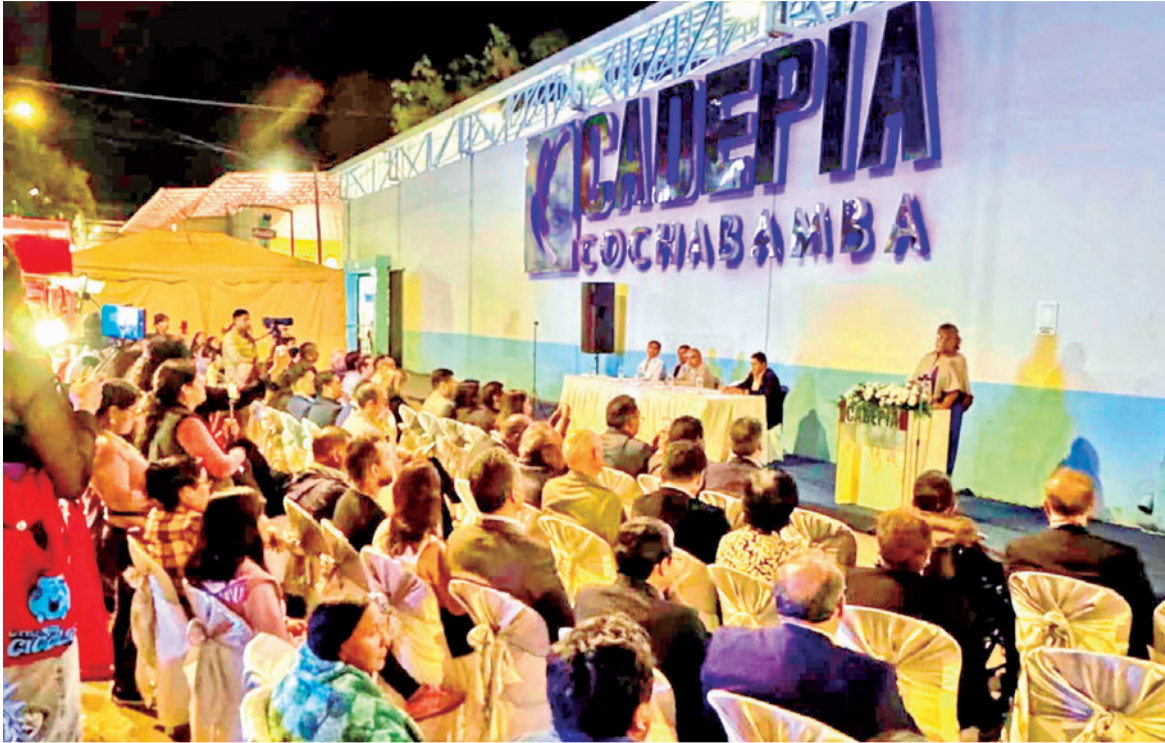
La instalación del stand de Cadepia en el recinto ferial de Alalay.