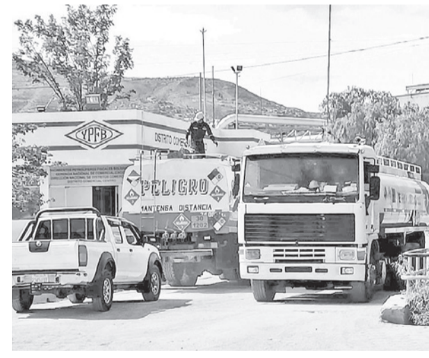
Las cisternas que llegaron a la refinería. CARLOS LÓPEZ

El dirigente Sergio Kosky dijo que los miembros del sector que salieron satisfechos del encuentro con el presidente de YPFB, Sebastián Daroca, resaltando que no es posible mantener deudas de cinco o seis meses por la labor relacionada al traslado de combustible.