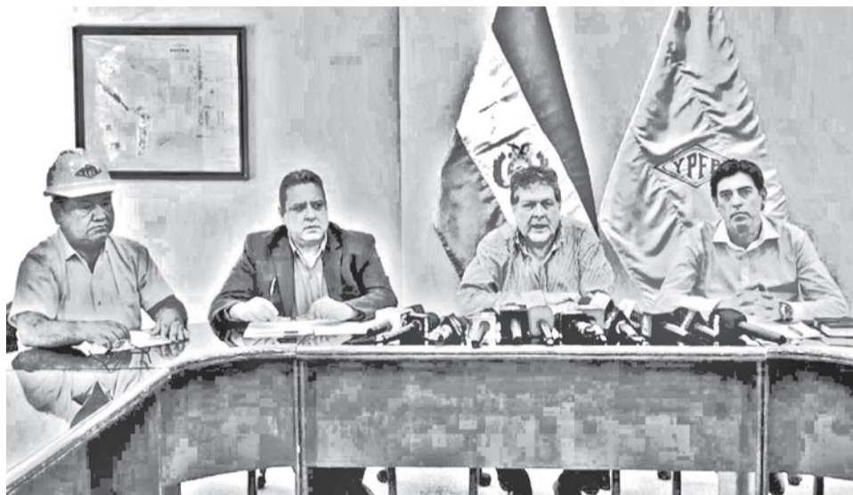
La conferencia de prensa de las autoridades, ayer.