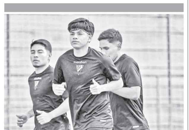
Always Ready enfrenta hoy a Mirassol. CAR

no había dicho aún la última palabra en la decimosexta confrontación entre parisinos y bávaros, balance favorable ahora 9-7 al monarca alemán.