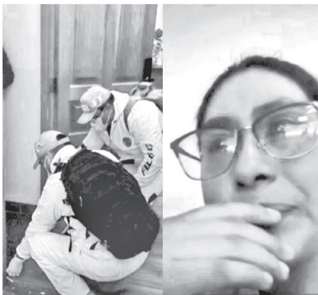
La alcaldesa de El Alto, Eva Copa.

"Pensamos que se estaban mudando, porque había bastante movimiento", dijeron los vecinos.