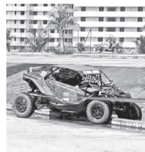
El vehículo del piloto asesinado.