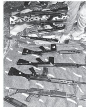
Armas recuperadas. RRSS

Con este operativo se destapó una presunta red criminal vinculada a la minería ilegal, tras la recuperación de gran parte del arsenal sustraído y la aprehensión de seis personas, varias de ellas integrantes de la Armada Boliviana.