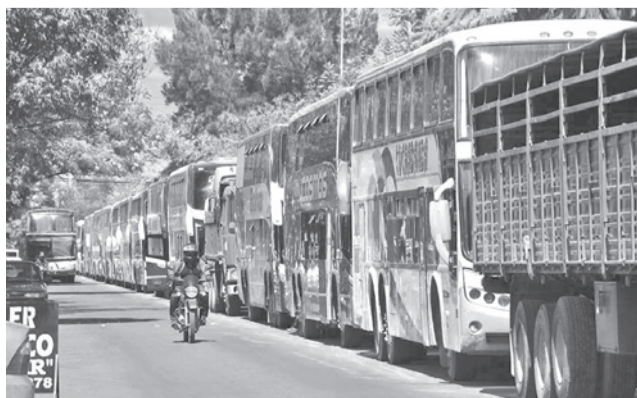
Las filas por diésel en Cochabamba. CARLOS LÓPEZ

La fila de camiones ocupa cuadradas enteras en zonas con estaciones de servicio como las avenidas Blanco Galindo en la ruta al occidente y Villazón en el camino al oriente.