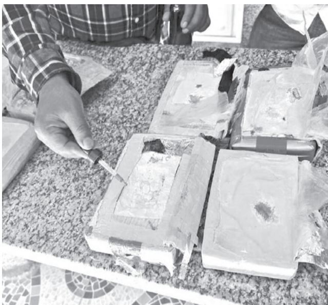
La cocaína oculta en dependencias policiales.

Los policías no tienen permiso para trabajar.