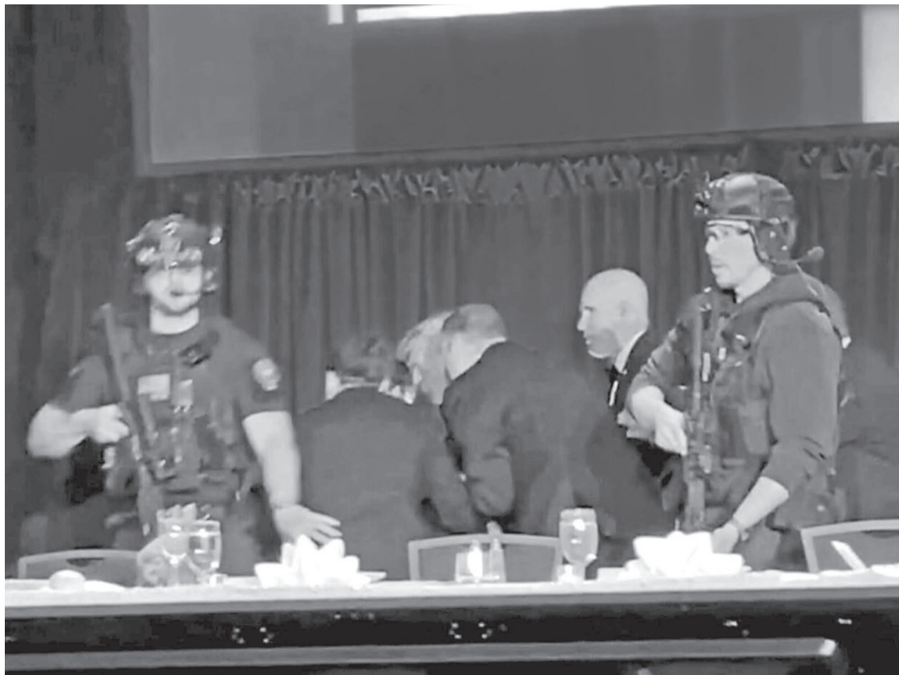
Momento en el que el Servicio Secreto evacúa a Donald Trump tras el intento de atentado durante la cena anual de corresponsales de la Casa Blanca. RRS5

Atentado. El Departamento de Justicia acusa al detenido por el tiroteo en la Cena de Corresponsales de intento de asesinato del presidente de EE UU, delito por el que puede ser condenado a cadena perpetua