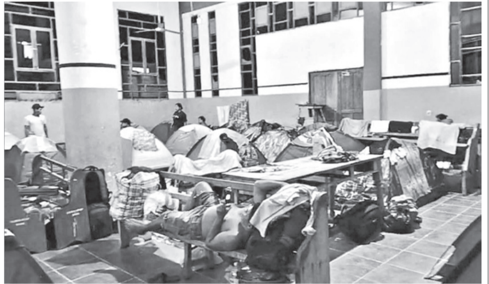
La marcha de los campesinos e indígenas de Pando a su llegada a Caranavi, ayer.