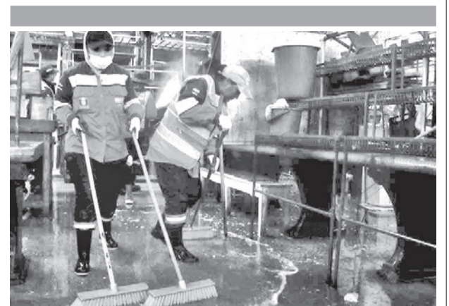
La limpieza en el mercado de 25 de Mayo.