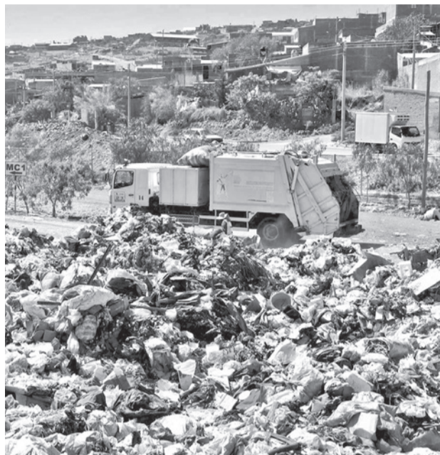
El botadero de K'ara K'ara, en el sur. CARLOS LÓPEZ

Hasta ahora no se ha revelado el sitio para la disposición final, la separación y la industrialización de la basura.