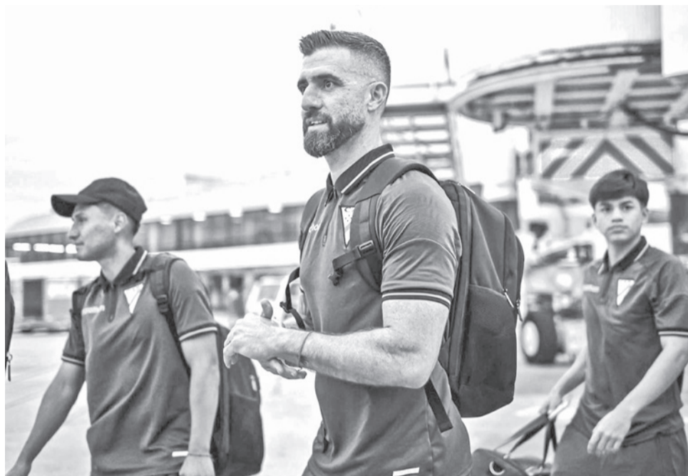
Always Ready a su llegada a Brasil para enfrentar a Mirassol. CAR

Mientras que mañana, también por la Sudamericana grupo H el elenco de Bloo-