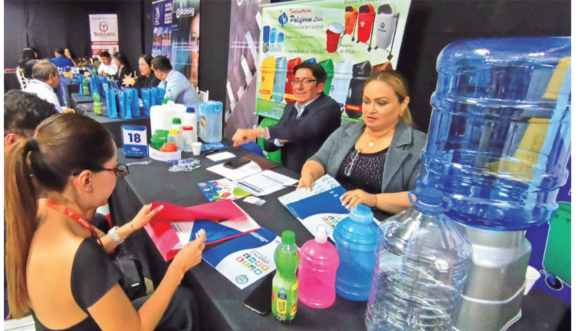
La realización de la Rueda Empresarial de Negocios de la Fexco 2026. DANIEL JAMES

Cadexco y la FEPC proyectan alcanzar $us 60 millones en intenciones de negocios durante los días del encuentro empresarial y comercial