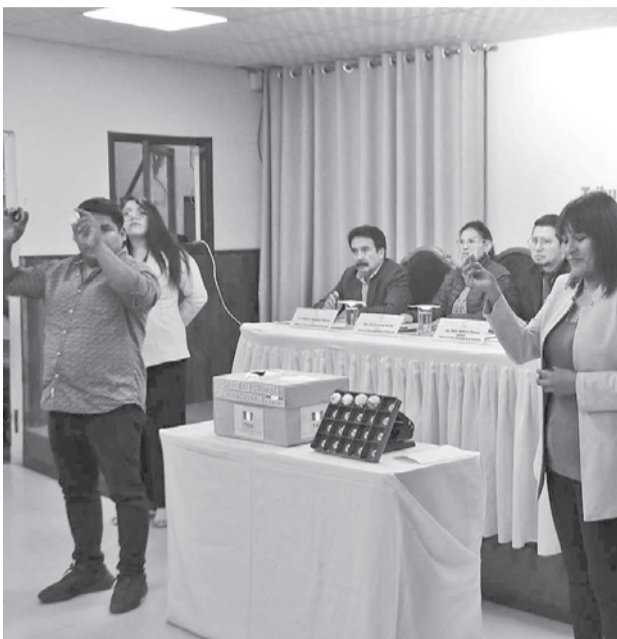
El sorteo para definir el concejal 11 de Quillacollo. H. ANDÍA

Los 11 concejales electos en Quillacollo también recibirán sus credenciales, luego que TED definió ayer, en una figura inédita, a través de un sorteo público con bolillos la asignación del concejal después de que los candidatos de APB-Súmate,