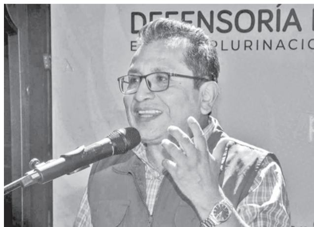
El Defensor del Pueblo, Pedro Callisaya. DEFENSORIA DEL PUEBLO

Asimismo, se identificó una expansión territorial de los conflictos, hacia ciudades