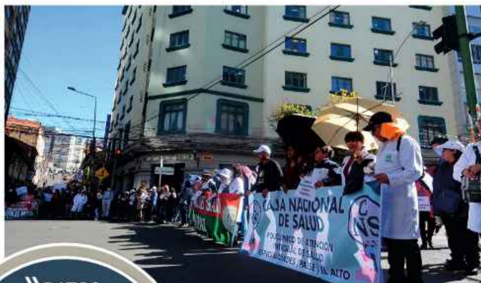
PROTESTA. Médicos movilizados en puertas de la oficina central de la Caja Nacional de Salud.

La medida, que es consecuencia de lo que denuncian como una gestión administrativa "deficiente y negligente", afectará la atención en los estableci-