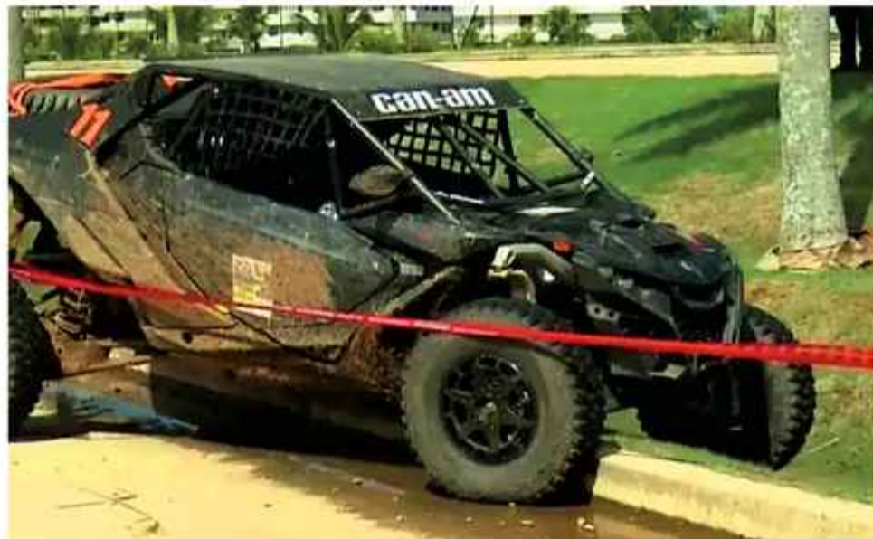
VIOLENCIA. El coche de carrera en el que fue asesinado alias "Pepa".

Entanto, en el municipio fronterizo de San Matías, un