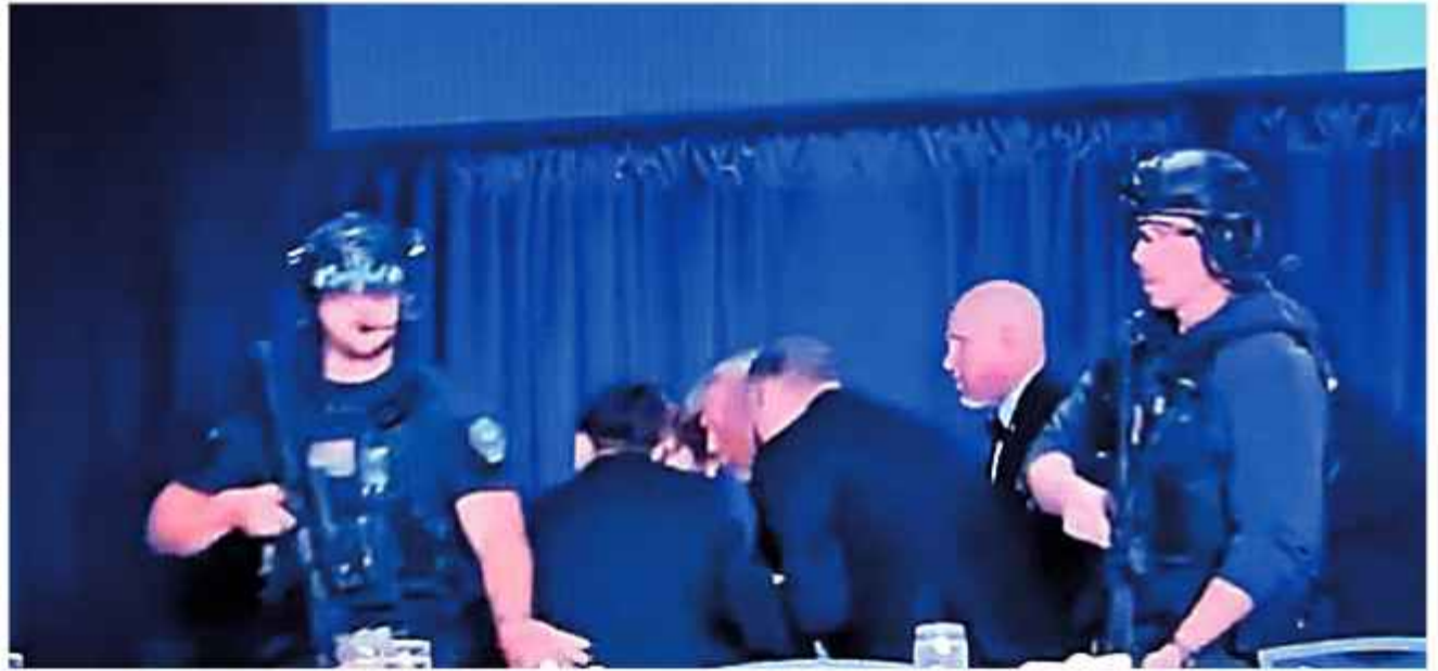
EVACUACIÓN. Agentes del Servicio Secreto retiran a Donald Trump del escenario de un evento oficial.

COMERCIAL - SUSCRIPCIÓN Edificio Cámara Nacional de Comercio Avenida Mariscal Santa Cruz 1392, piso 13, Of. 1302, Teléfono: 235 71 42 Cels.: 63264672 - 65362514