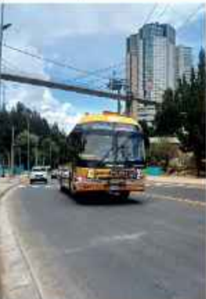
PUMAKATARI. Redujo las frecuencias de recorridos.

La falta de diésel ya tiene consecuencias directas sobre la ciudad. El servicio redujo su flota a la mínima expresión y opera solo en horas pico. La escasez de combustible también afecta a la recolección de basura y la operación de maquinaria municipal. La Alcaldía de La Paz reitera la urgencia de atender esta situación y la necesidad de una respuesta rápida.