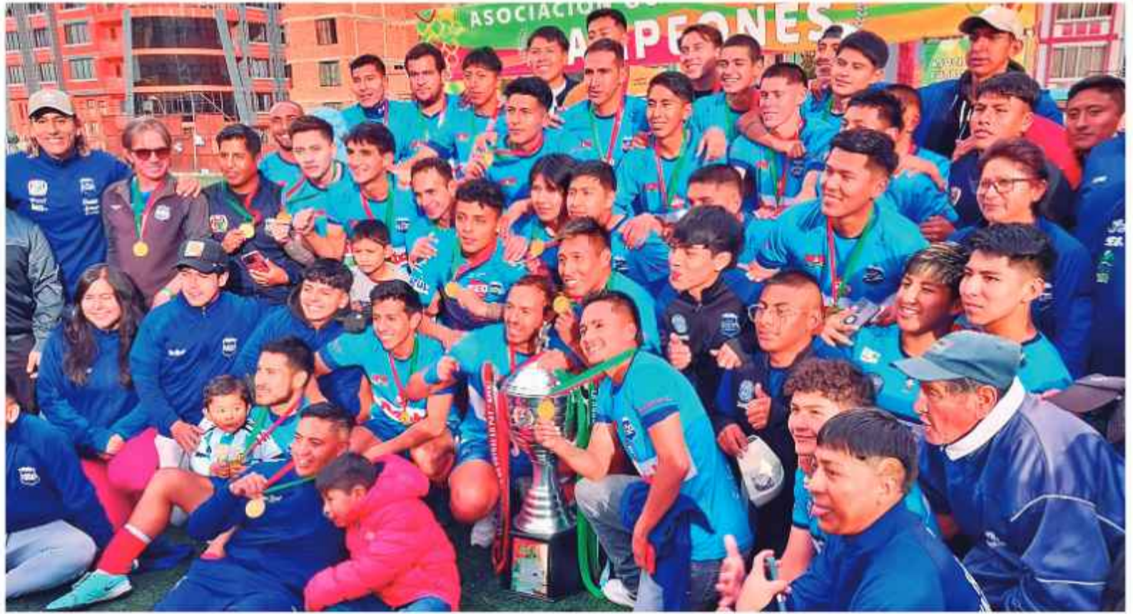
CAMPEÓN. Hiska Nacional es el actual campeón paceño, festejó el título en 2025.

Los otros dos son el campeón y el subcampeón del torneo Interprovincial 2025 de La Paz, 26 de Febrero, de Colquiri, provincia Inquisivi, es el campeón; y Club Deportivo Pucarani, de la localidad de homónima de la provincia Los Andes, es el subcampeón. Hiska Nacional logró el título paceño