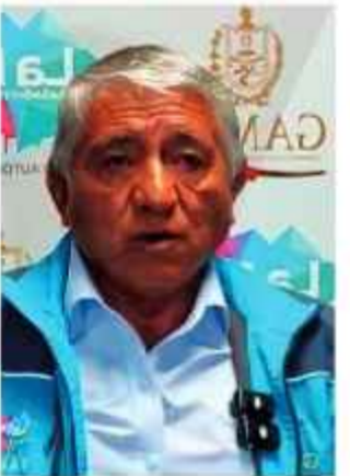
PERFIL. Alcalde Iván Arias, con declive en su gestión.

A partir de 2023, la aprobación descendió por debajo del umbral del 30 por ciento. Este periodo coincidió con pugnas dentro del Concejo Municipal y denuncias judiciales que afectaron su percepción.