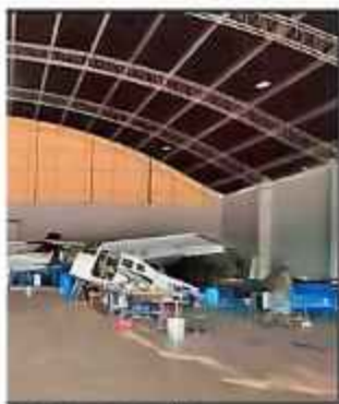
SEGURIDAD. El hangar resguardado por Dircabi.