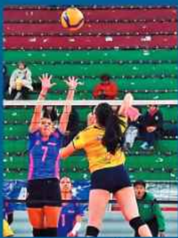
PARTIDO. Incidencia del cotejo entre Olímpic y Albert Einstein.