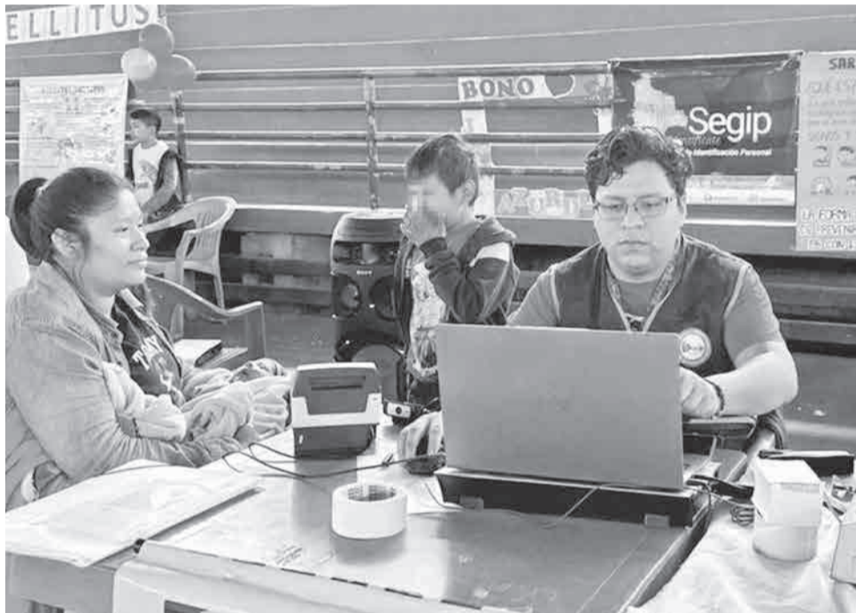
El pago del bono Juana Azurduy a las beneficiarias (Archivo).

En los centros de salud de La Paz, el panorama es desolador. Una madre residente en Bajo San Pedro relató que a que su hijo, quien cumplirá un año, solo recibió dos pagos