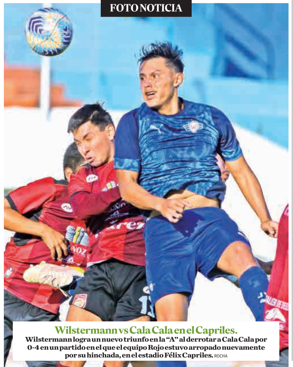
Wilstermann vs Cala Cala en el Capriles. Wilstermann logra un nuevo triunfo en la "A" al derrotar a Cala Cala por 0-4 en un partido en el que el equipo Rojo estuvo arropado nuevamente por su hinchada, en el estadio Félix Capriles. ROCHA