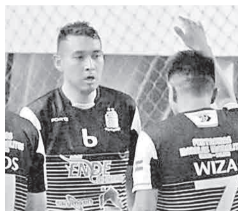
Un incidente del partido de futsal.