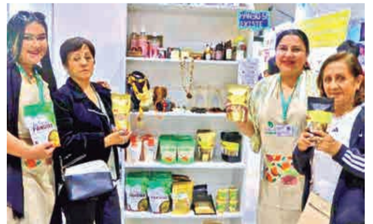
Pando dice presente en la Fexco con productos amazónicos.

En esta versión destacan los autos eléctricos como una nueva alternativa para la población para moverse sin problemas.