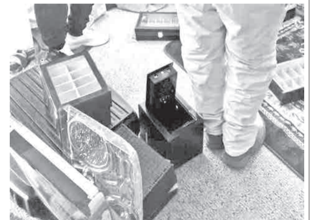
La casa donde se perpetró el robo.

Los vecinos que fueron consultados por la prensa manifestaron que el hecho pudo ser cometido por personas que conocían que en el domicilio de tenían objetos de valor y que nadie se encontraba en la vivienda.