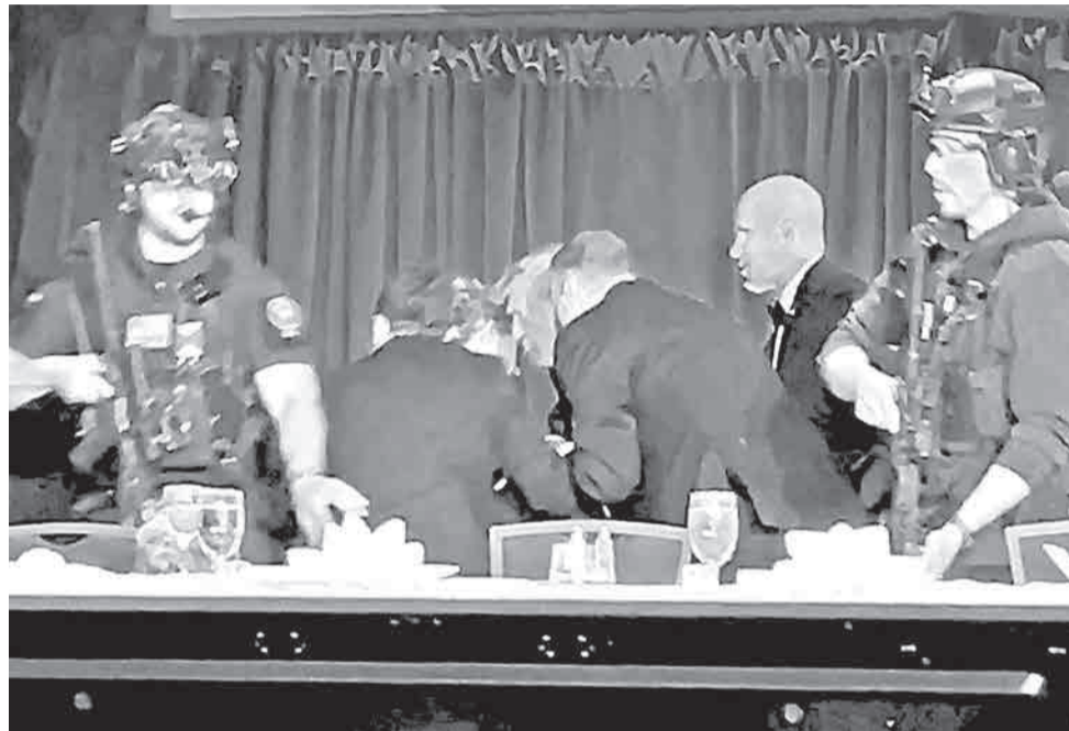
El presidente Donald Trump asistió a la cena y fue evacuado por seguridad.

Según reveló ayer el New York Post, el detenido envió a sus familiares un extenso manifiesto apenas diez minu-