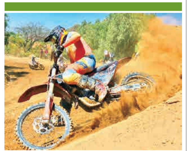
Motociclistas en el campeonato nacional. ROCHA

Una vez más el talentoso ex volante de marca de Bolívar dirigió el partido con jerarquía y actitud. Soria ingresó y dejó el Siles en medio de una ovación.