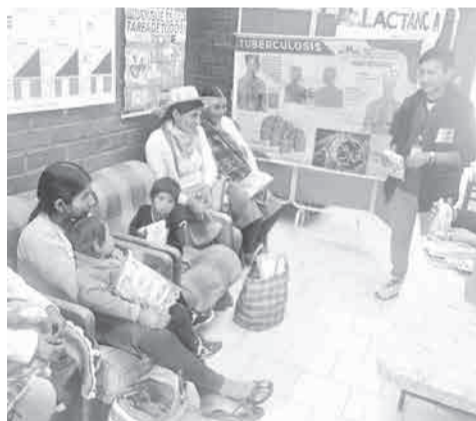
Una oficina para el pago del bono para las madres y niños.