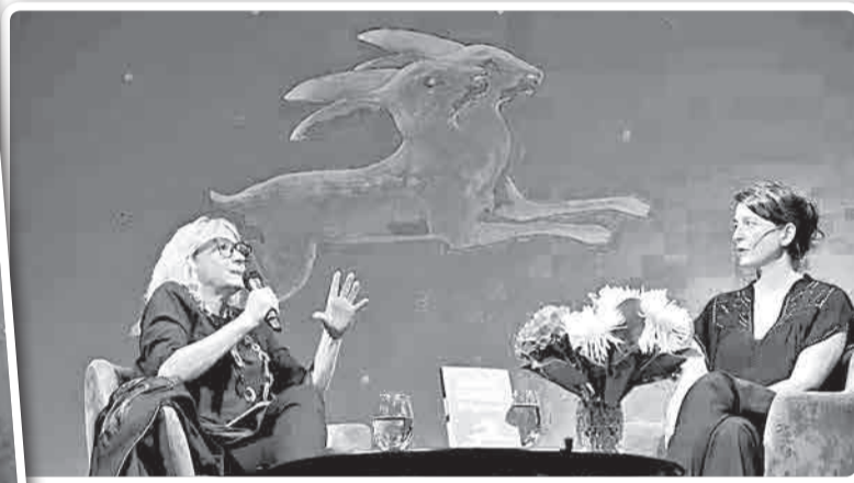
Samanta Schweblin y su obra “El buen mal”.