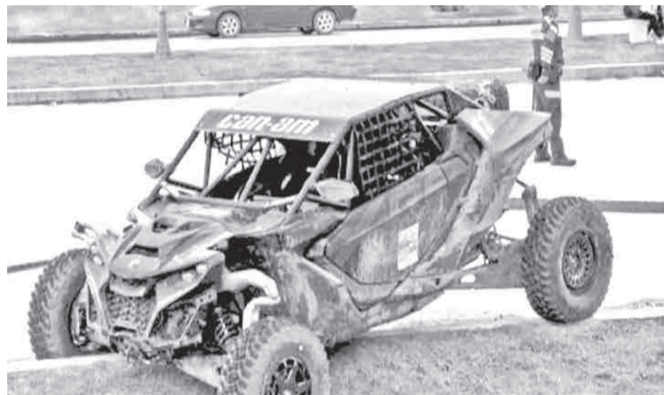
El piloto de rally murió a causa de múltiples disparos, el copiloto está herido. DEBER

La segunda víctima murió en el municipio de Puerto Quijarro cuando fue interceptada por desconocidos que abrieron fuego en su contra.