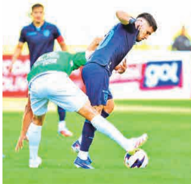
El partido de Bolívar ante Real Tomayapo.