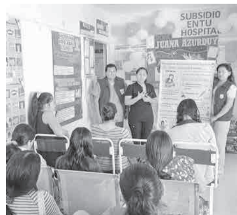
El beneficio se paga de manera irregular en 2026.

de todo el ciclo. “No pagan desde el año pasado. Han dejado de pagar noviembre, diciembre y comenzaron a silenciar el grupo. Actualmente ya no se puede enviar mensajes al grupo que tiene cada centro de salud, sólo nos conectamos por grupos de WhatsApp que crearon las madres”, especificó.