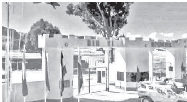
La base naval de Chia Cocani, en La Paz.

La institución informó que la madrugada del domingo personas inescrupulosas con presunto apoyo de extranjeros sustrajeron de manera ilegal armamento y munición militar de las instalaciones del