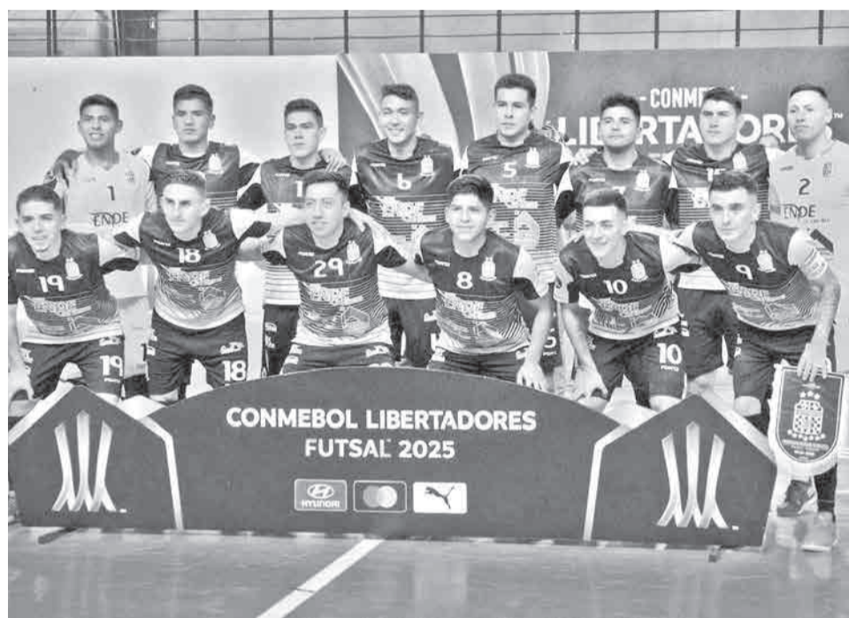
El equipo de futsal Fantasma Morales Moralitos.

El torneo internacional se disputará en Brasil, del 24 al 31 de mayo