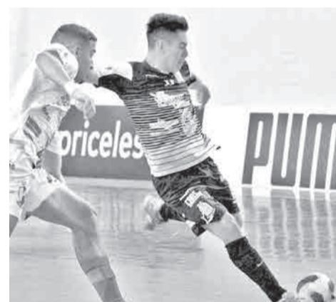
El equipo se alista para la Libertadores. CONMEBOL