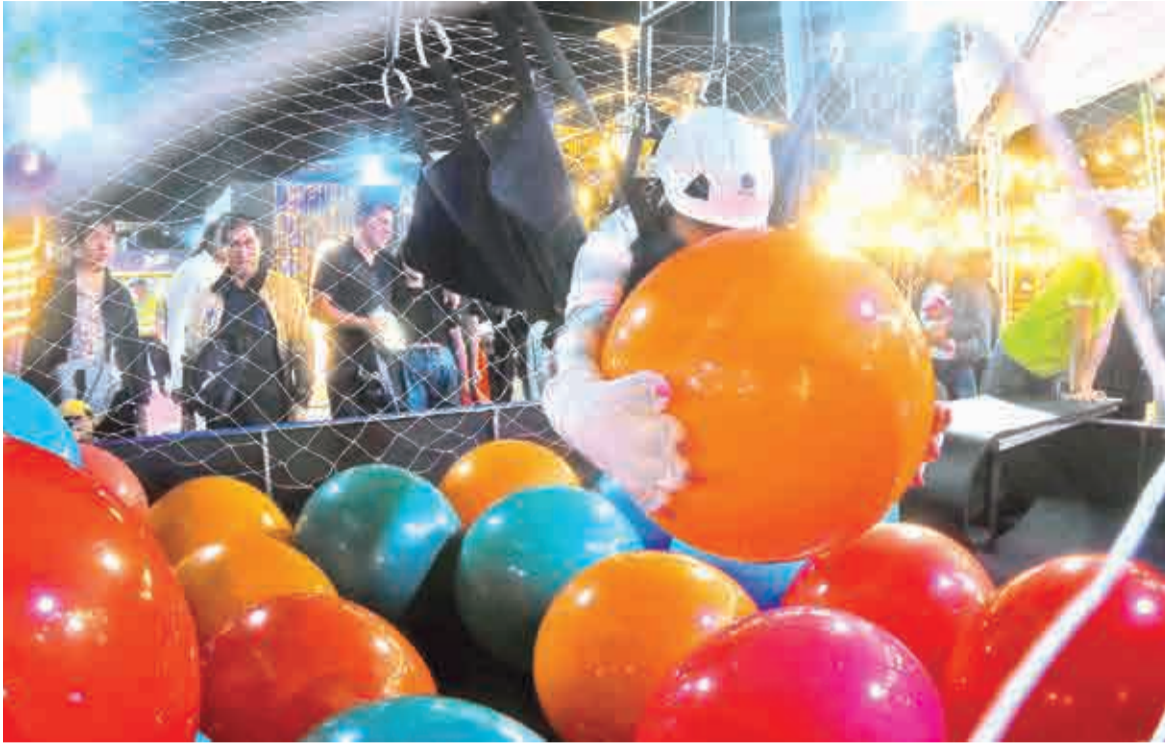
Uno de los espacios de diversión para los niños en la Feria Internacional. ROCHA