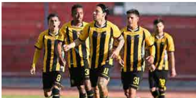
El partido The Strongest ante Totorá Real Oruro.