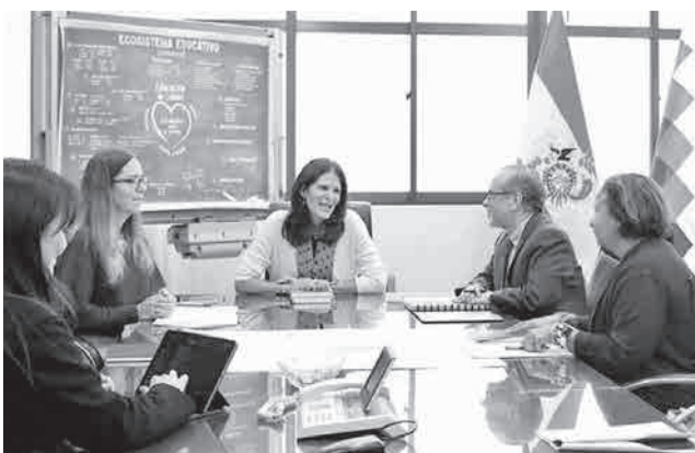
Ministra de Educación en la reunión con el BM. MIN.EDU.

De acuerdo con un boletín institucional, durante su estadía en la sede de gobierno, primero realizó un recorrido por las instalaciones de la em-