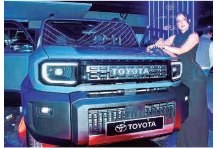
Los vehículos eléctricos, una novedad de la Fexco. ROCHA