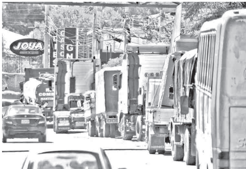
La fila de camiones que esperan diésel en la Av. Villazón, en Sacaba, ayer.