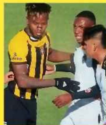
PARTIDO. Jugadores del Tigre en el Jesús Bermúdez.