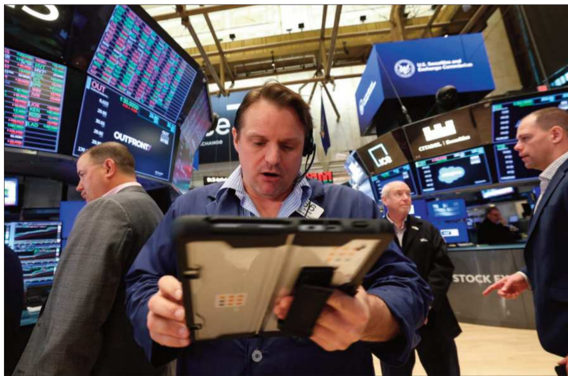
INESTABILIDAD. Wall Street tuvo una jornada complicada por el conflicto en Oriente Medio.

Efecto. La creciente incertidumbre en Oriente Medio afecta el mercado