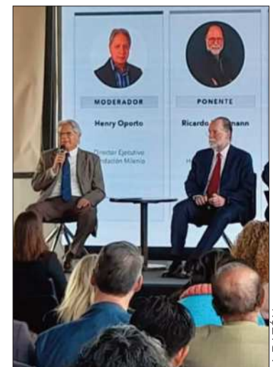
Panel de expertos en el evento.

En torno a lo más urgente, Hausmann detalló que es necesario apurar la marcha.