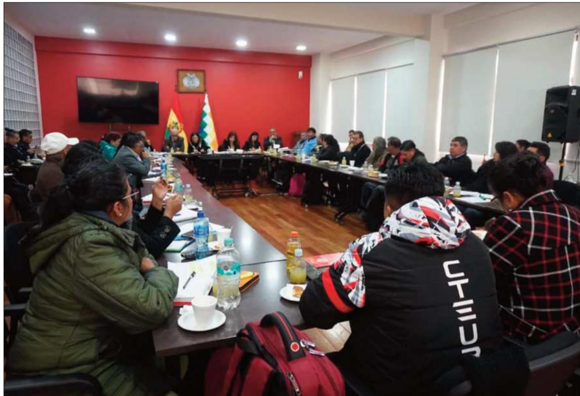
ENCUENTRO. La ministra de Educación, Beatriz García, y dirigentes del magisterio urbano en la reunión.

La ministra de Educación, Beatriz García, aseguró la asignación de 4.000 ítems nuevos. Sin embargo, explicó a los maestros que la situación económica que atraviesa el país no le permite al Gobier-