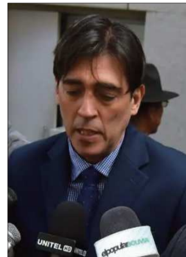
El ministro Mauricio Zamora.

El siniestro dejó un saldo de al menos 20 personas fallecidas y más de una veintena de heridos, varios de ellos con lesiones de gravedad que fueron trasladados de emergencia a distintos centros de salud.