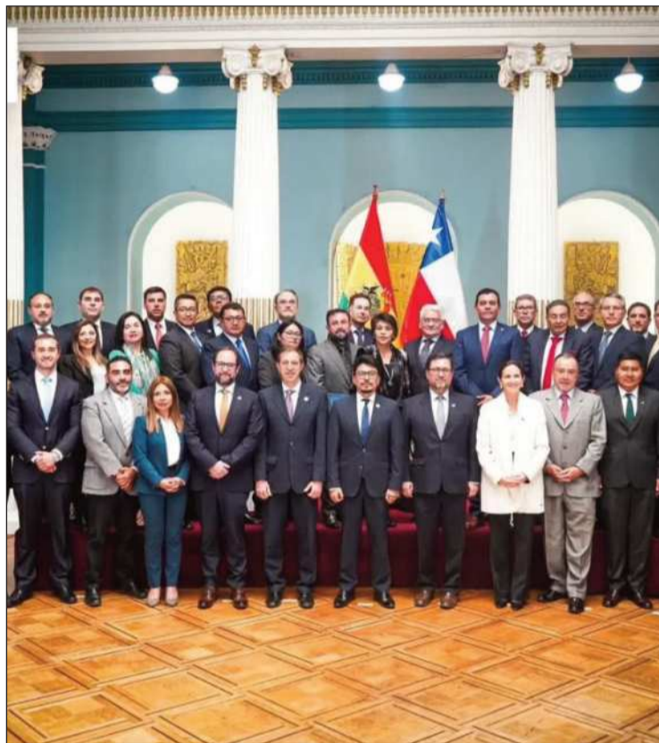
ENCUENTRO. Autoridades y los empresarios de Bolivia y Chile.

Asimismo, Morales dijo que se analizaron oportunidades y beneficios que ofrece el Puerto de Arica para potenciar las exportaciones e importaciones bolivianas.