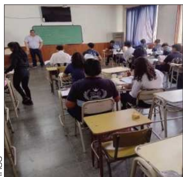
Registan reducción de alumnos.

Autoridades de educación identifican tres factores para el decrecimiento