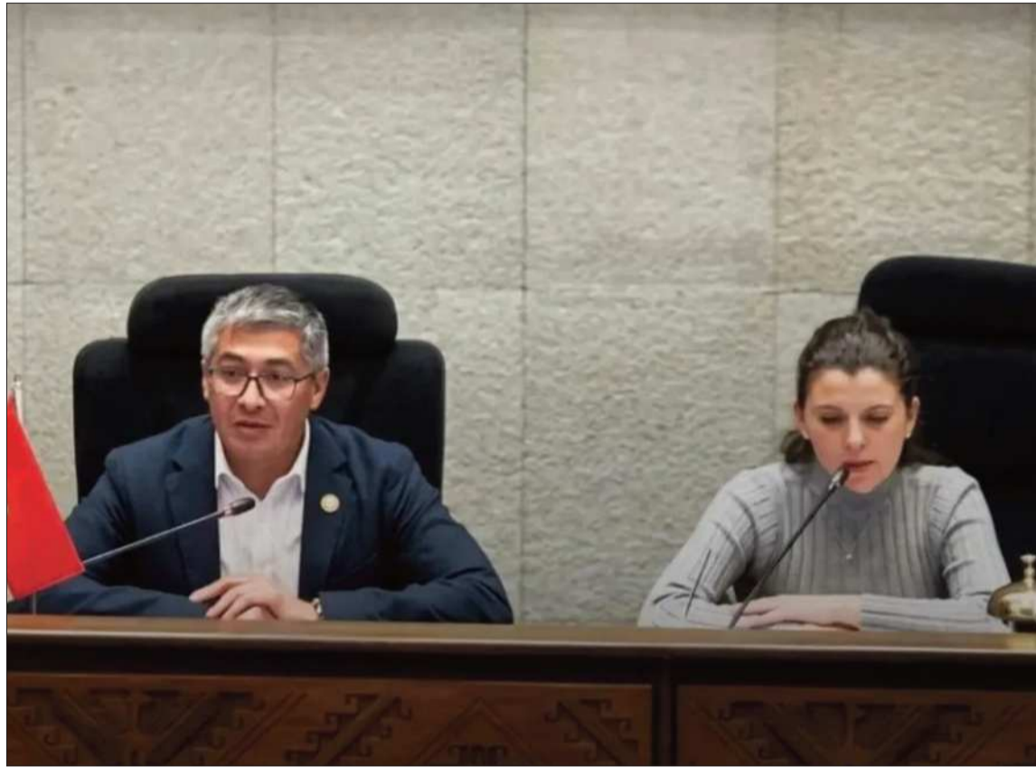
INICIATIVA. El ministro de Economía, José Gabriel Espinoza, llegó hasta la sesión de la Cámara de Diputados

En la actualidad, una fiscalización puede extenderse hasta ocho años. La nueva propuesta reduce ese plazo a un máximo de cuatro años y establece que cada proceso debe iniciarse y concluir en no más de dos años.