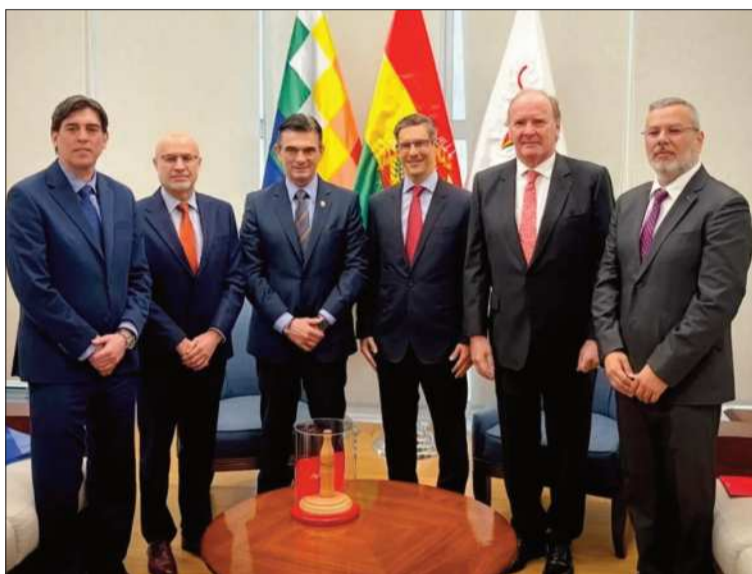
ENCUENTRO. El presidente Rodrigo Paz junto a ejecutivos de Coca-Cola

El anuncio se produjo durante una visita oficial, el presidente de Coca-Cola América Latina, Bruno Pietracci, quien sostuvo un encuentro