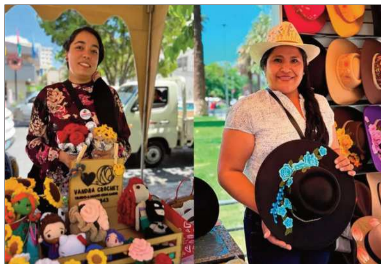
MUESTRA. Dos emprendedoras participan de la Fexco en Cochabamba.

Este viernes, el grupo de empresarios chilenos estará en Santa Cruz, donde se prevé también reuniones con el sector privado.