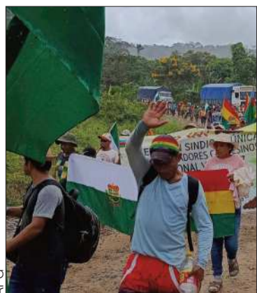
La marcha de campesinos.

Autoridades se reúnen con todos los sectores para explicar los alcances