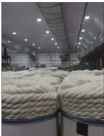
Las instalaciones de Yacana.

De 67 empresas públicas existentes, una proporción no logra generar ingresos