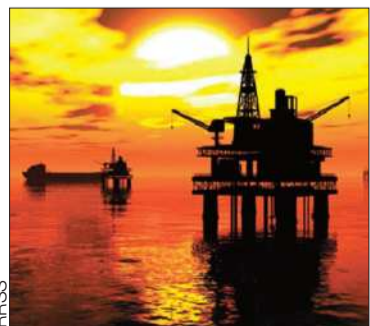
Se redujo la producción.

El mercado internacional está castigado por casi dos meses de guerra