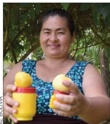
Productora de aceite de piquí.

El proyecto ProAmazonía trabaja para potenciar el desarrollo en esa región