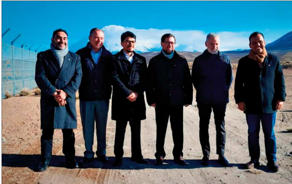
ENCUENTRO. Cancilleres de Bolivia y Chile se reunieron en la región fronteriza de Tambo Quemado.

En tanto Aramayo remarcó que ambos países tienen historia y deben construir pensando en el futuro, no anclados en el pasado.