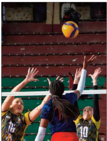
Incidencia de un partido anterior.