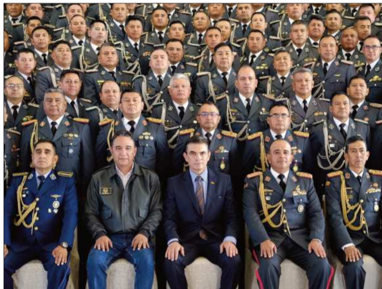
DIÁLOGO. El presidente Rodrigo Paz junto a comandantes del Ejército.

“Los últimos 20 años de la construcción del Estado y sus instituciones (...) tuvieron un alto grado de ideología (...) y a