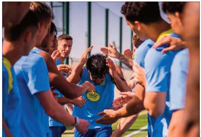
FIGURA. El astro español Lamine Yamal con la casaca del Barcelona español.

No obstante, la lesión de Lamine se añade a la incertidumbre sobre varios jugadores importantes actual-