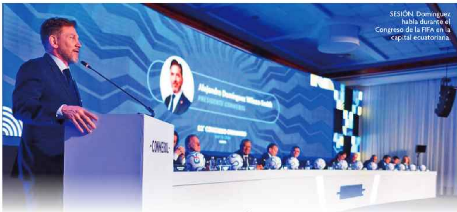
SESIÓN. Domínguez habla durante el Congreso de la FIFA en la capital ecuatoriana.

En Quito se realizó el Congreso de la Conmebol con la participación del Presidente de la FIFA, quien recibió la banda de capitán.