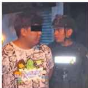
INSEGURIDAD. El sujeto fue aprehendido.

El sujeto captaba la atención de jóvenes, de aproximadamente 14 años, a quienes posteriormente pedía imágenes y material con contenido sexual explícito de ellas mismas.