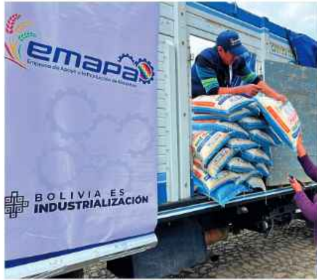
CASO. Uno de los proyectos es el de Emapa.