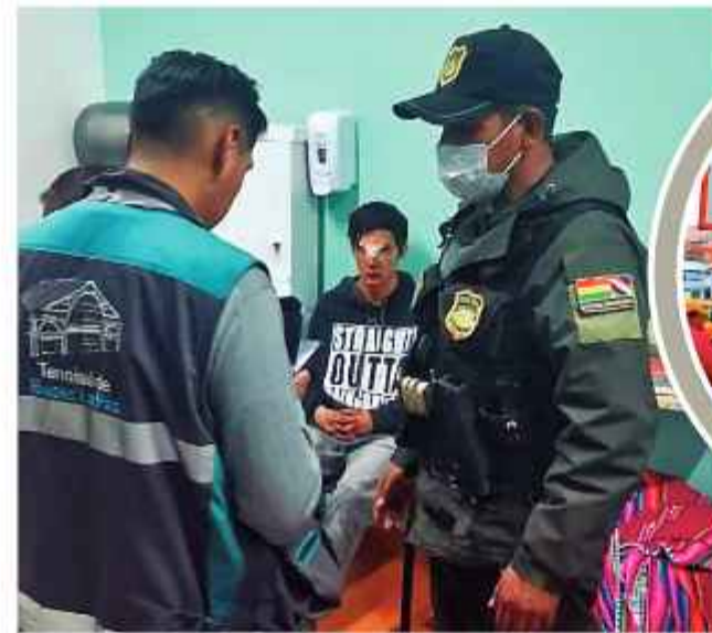
CASO. Policías y funcionarios ediles reciben una denuncia.

El hombre se convirtió en una de las víctimas de los delincuentes que dopan a las personas para robarles sus pertenencias. Se trasladó en un bus. "Tenía una chamarra que me cubría mis pies, ahí estaba todo mi dinero, pero se lo llevaron. Fui a la Policía a poner la denuncia, me tomaron los datos y la declaración. 'Si quieres que agilice tu denuncia y venga el Fiscal para hacer revisar las cámaras, debes pagar', me dije-