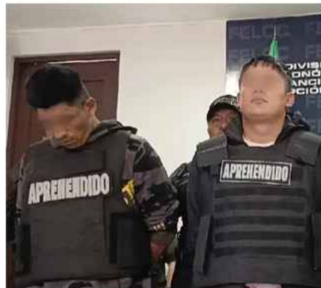
DELINCUENTES. Dos de los delincuentes que robaban motos.