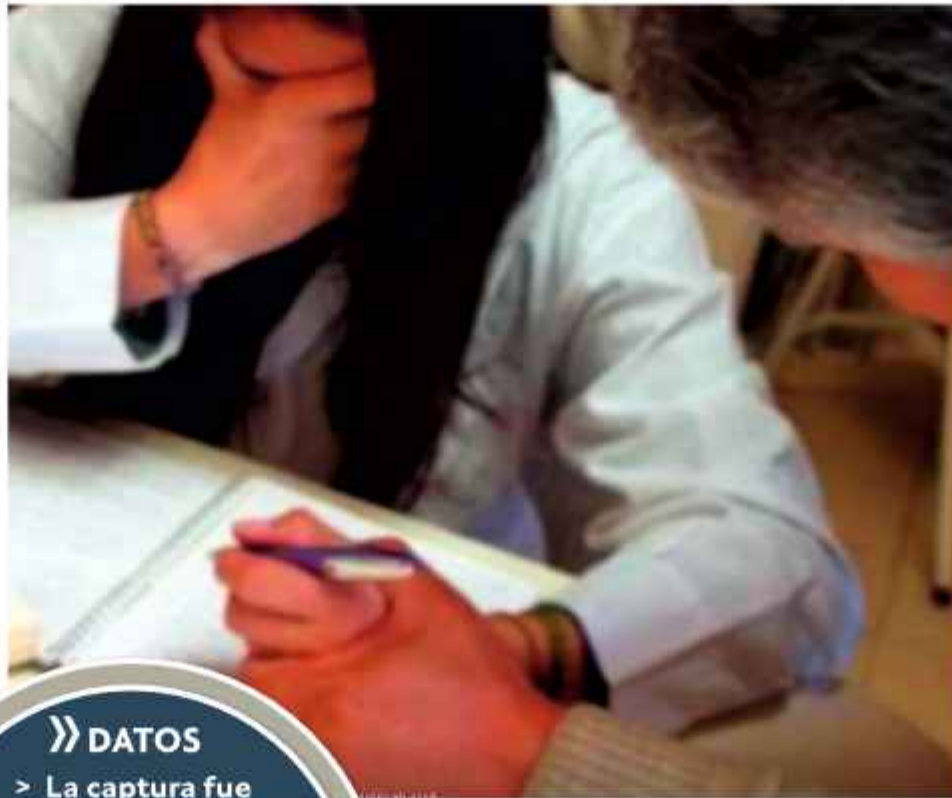
AGRESIONES. La foto es referencial.

"Hemos recibido la noticia fehaciente de la violación en contra una estudiante de