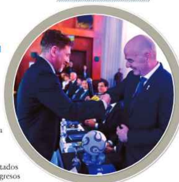
SÍMBOLO. Infantino recibe el cintillo de capitán.

Gracias al fortalecimiento económico y financiero los premios y aportes a los clubes y selecciones nacionales superaron los 316.525.000 de dólares. El alcance mediático de los torneos de la Conmebol llegó a 194 países y territorios el último año.