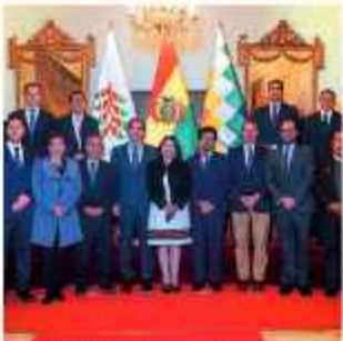
SESIÓN. El Canciller y participantes en el evento.

En este sentido, el martes se realizó el Taller de Alto Nivel sobre el Proceso de Adhesión de Bolivia al Mercosur, actividad que estuvo orientada a socializar los avances normativos, se informó.