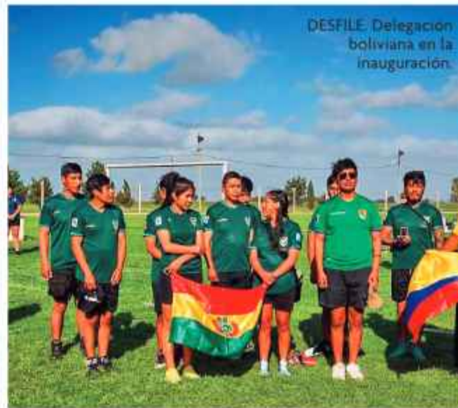
DESFILE. Delegación boliviana en la inauguración.

PARA COMPETIR EN EL SUDAMERICANO, LOS REPRESENTANTES NACIONALES VIAJARON POR CARRETERA