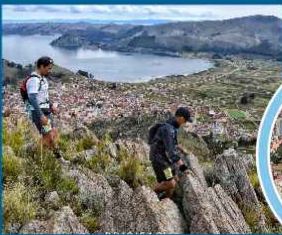
CARRERA. En 2025 los corredores pasaron con buena nota las dificultades que se les presentó.

"Es un centro de peregrinación muy importante al encontrarse la imagen de la Virgen de Copacabana", dijo el dirigente. Para la ocasión, se confirmó la participación de corredores procedentes de Santa Cruz, Cochabamba, Potosí, Sucre, Oruro, La Paz, además del extranjero, quienes competirán sobre 30, 18 y 10 kilómetros.