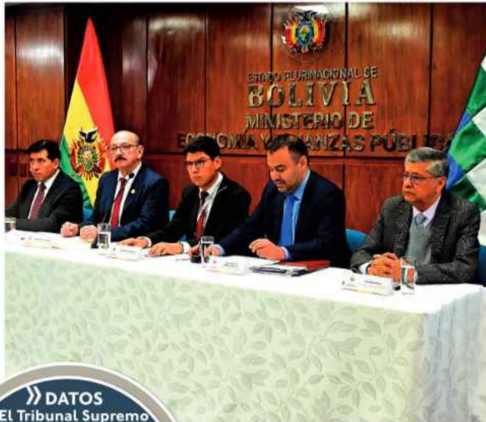
INFORME. Autoridades de Economía, la Procuraduría y la Gestora Pública, en rueda de prensa, ayer.

Los representantes del Ministerio de Economía, Procuraduría, Gestora y Autoridad de Pensiones explicaron que el fallo definitivo del Tribunal Supremo de los Países Bajos en contra del Estado