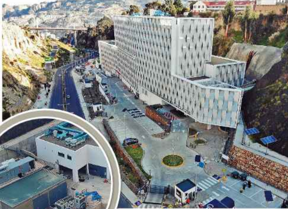
FACHADA. Vista general del hospital de cuarto nivel.

El contrato, suscrito en julio de 2018 bajo la modalidad “llave en mano”, obligaba a la empresa Maquiver a cumplir las fases de preinversión, inversión y operación. No obstante, informes técnicos