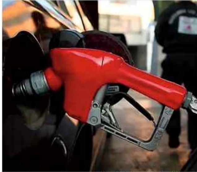
CRISIS. El sector rechaza el combustible de mala calidad.