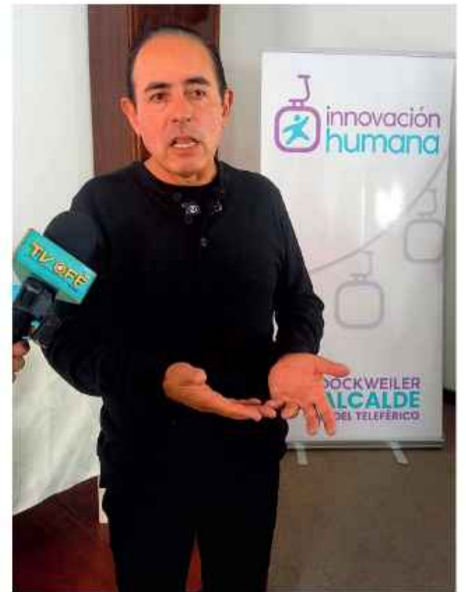
DENUNCIA. Dockweiler criticó la actitud de los salientes.

El alcalde electo de La Paz, César Dockweiler, denunció ayer que la autoridad saliente, Iván Arias, no cumple la transición. "Tuvimos más de 230 reuniones entre las comisiones que formamos, 122 se concretaron, pero fue para ir a tomar agua y café, porque no se entregó ninguna documentación", comentó la autoridad, quien agregó que envió 70 solicitudes formales para obtener información de las autoridades salientes, sin embargo, no recibieron respuesta alguna. Desde de la Alcaldía se informó que la documentación digital del proceso de transición se encuentra disponible desde el 20 de abril.