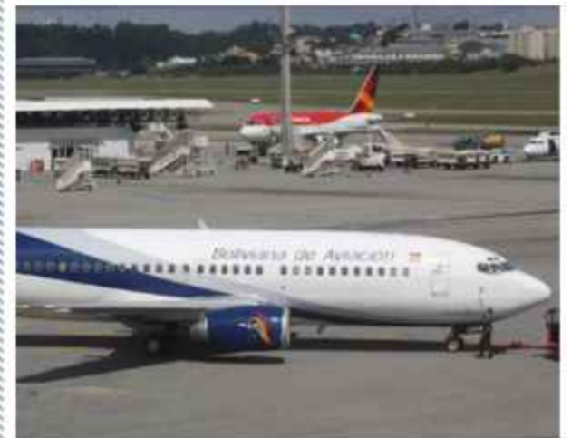
CASO. Auditorías revelan irregularidades en BoA.