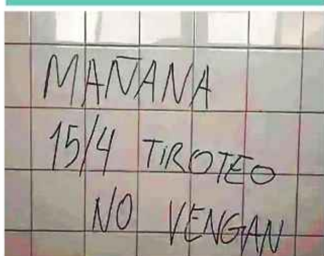
ADVERTENCIA. Una de las pintadas en una escuela.

La administración de Trump criticó la condena judicial aplicada al ultraderechista Bolsonaro y se alegró de Brasilia.