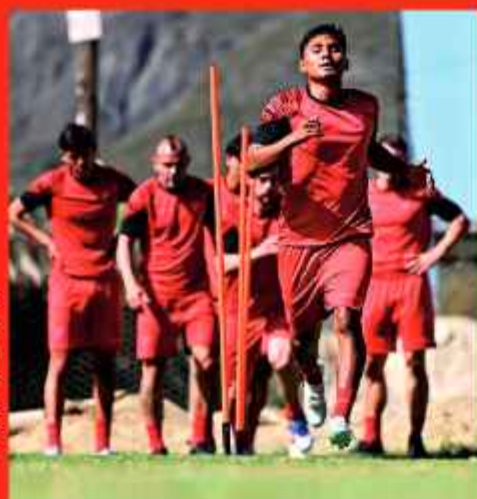
TRABAJO. Jugadores del plantel de Always Ready, en la práctica de ayer.

Always Ready enfrentará a Oriente Petrolero esta tarde en El Alto en partido válido para la tercera fecha del torneo de la División Profesional del fútbol boliviano, encuentro en el que estará ausente el delantero de 38 años, Marcelo Martins Moreno.