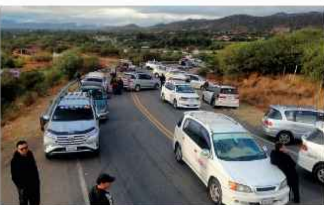
BLOQUEOS. Los choferes de Tarija cierran la ruta a Bermejo.

Ayer, los choferes del Transporte Libre de Tarija, iniciaron un bloqueo con camiones en la carretera a Bermejo en protesta por la mala calidad del combustible, mientras que choferes en Santa Cruz denunciaron que esperan hasta tres días para comprar diésel.