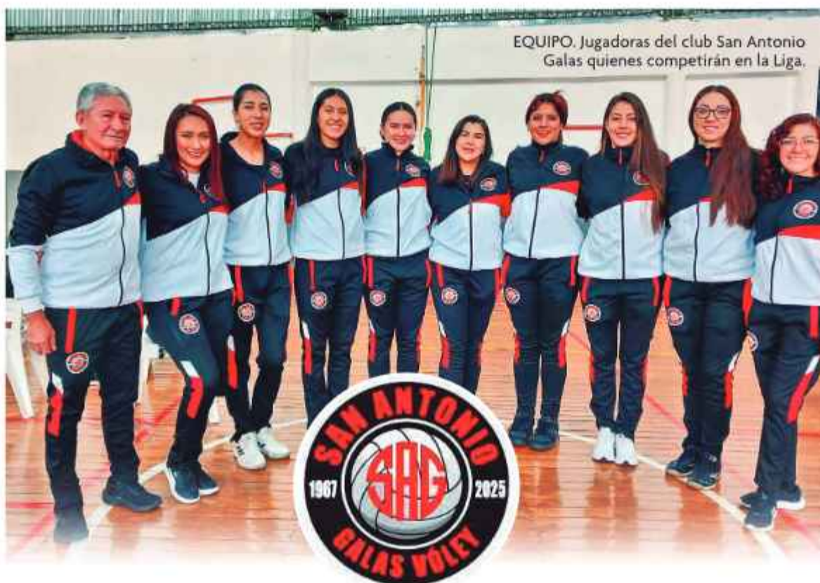
EQUIPO. Jugadoras del club San Antonio Galas quienes competirán en la Liga.

Con la participación de los clubes cochabambinos Olympic, San Simón, San Martín y Albert Einstein, además de América, de Oruro; Universitario, de Tarija; San Antonio Galas y Olympic, de La Paz, este sábado comenzará la nueva versión de la Liga Superior de Voleibol de la rama femenina. Este campeonato se iniciará con cambios en la convocatoria a fin de elevar el nivel competitivo.