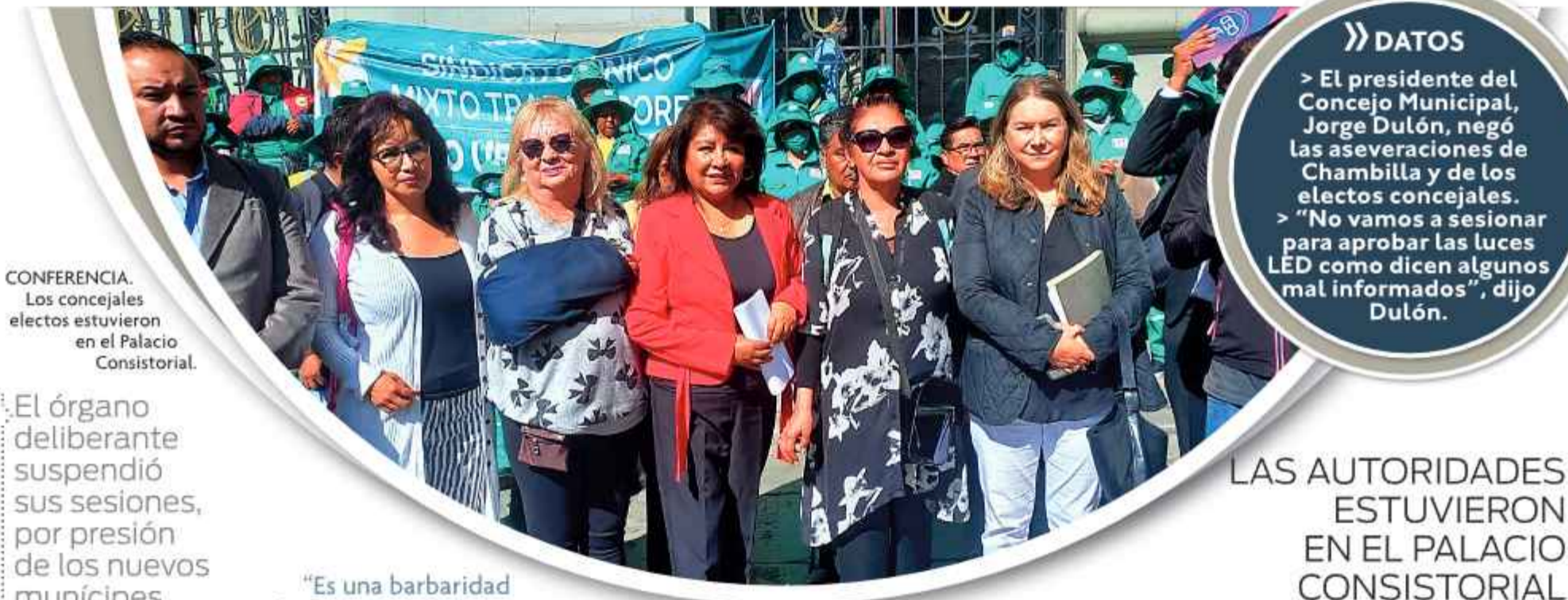
CONFERENCIA. Los concejales electos estuvieron en el Palacio Consistorial.

El órgano deliberante suspendió sus sesiones, por presión de los nuevos municipales.