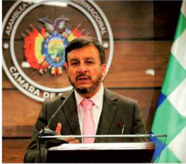
PERFIL. El ministro de Hidrocarburos, ante la Asamblea.

El ministro de Hidrocarburos, Mauricio Medinaceli, compareció ayer ante la Comisión Especial de la Asamblea Legislativa que investiga la crisis de carburantes en el país, ante la que ratificó que su despacho se limita al diseño de políticas energéticas.