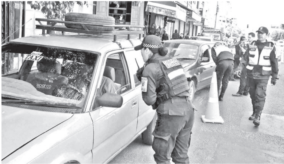
La sociación del plan "Taxi Seguro" en la ciudad de Cochabamba.