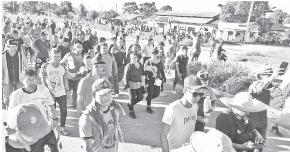
Marcha de campesinos e indígenas de Pando y Beni rumbo a La Paz, ayer en Yucumo. RR55