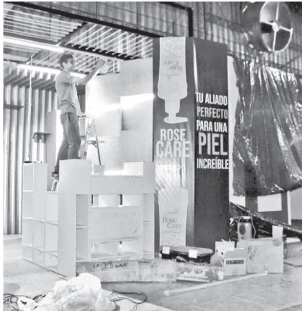
El armado de stands para la Fexco.