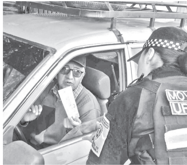
Guardia de Movilidad urbana difunde los requisitos.

Cochabamba es el municipio con la mayor cantidad de casos en el departamento; por ello, la autoridad resaltó la importancia de la destrucción de criaderos con el objetivo de evitar la proliferación.