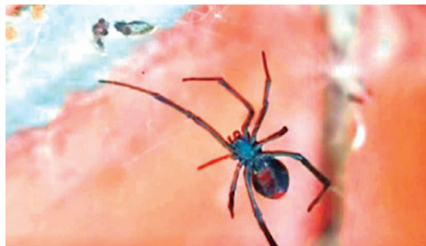
La invasión de arañas viuda negras en el estadio. LOS TIEMPOS

En la modalidad de dobles, Zeballos está muy cerca de ingresar nuevamente al Top-100 al ubicarse en el puesto 108 con 781 puntos. Subió dos casillas gracias a los 50 puntos que sumó en el Bolivia Open por ser finalista.