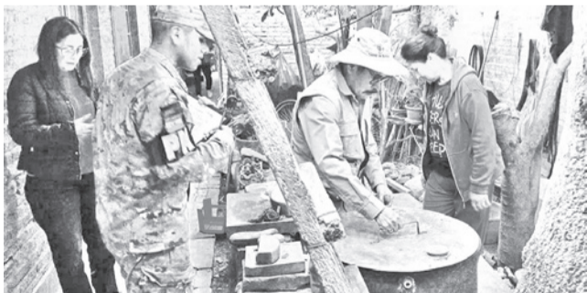
Campaña contra proliferación de mosquitos. DANIEL JAMES

Salud. Del total, al menos 900 familias se negaron a la inspección de sus casas y más de 3 mil no se encontraban en sus domicilios