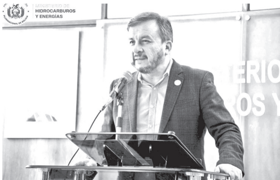
El ministro de Hidrocarburos, Mauricio Medinaceli.

“La Ley del Litio igual será dialogada sobre todo con la región de Potosí, eso que quede claro, el ejecutivo no está atrincherado de ninguna idea”, dijo el domingo en Haggamos Democracia de Erbol.