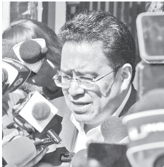
El exministro de Justicia César Siles.