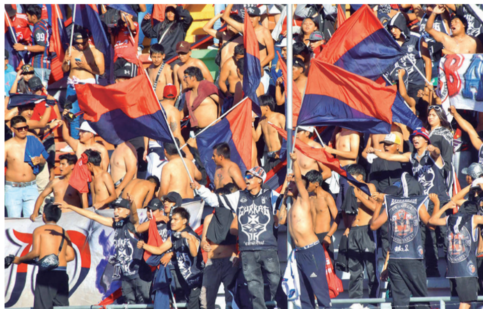
Hinchas demuestran su apoyo al Wilstermann, el domingo. DANIEL JAMES

En esa época Wilstermann tuvo gran apoyo de sus fanáticos, quienes asistieron a cada uno de los partidos de la Pri-