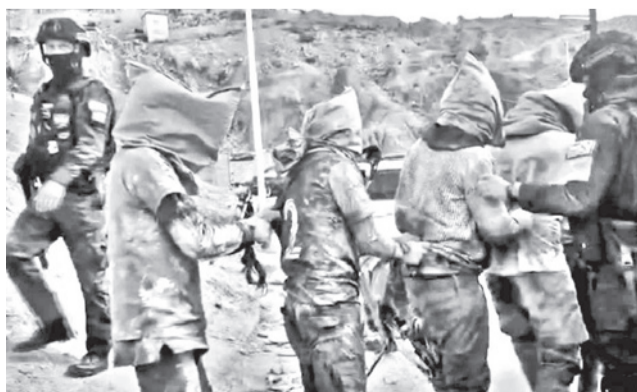
Los jukus se cubren la cabeza con bolsas.

Según el informe policial, cooperativistas del lu-