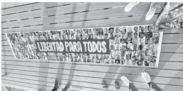
Cartel en favor de la excarcelación de los presos políticos cubanos. ANAMELY RAMOS

Amenaza. Washington presiona para la excarcelación de un par de artistas además del resto de prisioneros