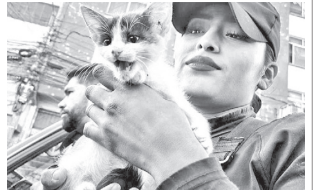
Mascotas rescatadas en la Pulacayo.

te acogida de los artistas emergentes que desean ser parte de la Fexco. Es el objetivo del alcalde, Manfred Reyes Villa promover a los nuevos talentos", dijo.