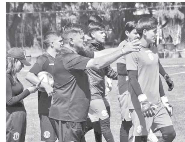
Universtario durante un entrenamiento.