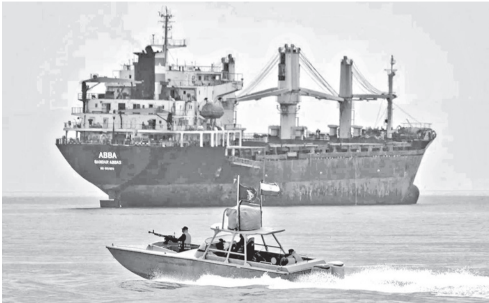
Un barco navega por el estrecho de Ormuz. EL ORDEN MUNDIAL