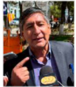
Brito lamentó la falta de información sobre este equipo médico

Asimismo, comentó sobre las declaraciones de un técnico que aseguró: "no es nuevo este equipo del resonador". En contraste, en una entrevista anterior, el director del Hospital General, Raúl Gutbarra, afirmó que el resonador "está funcional", aunque no se realizan estudios por razones legales. Sin embargo, no especificó los detalles de la demanda judicial relacionada con el equipo.