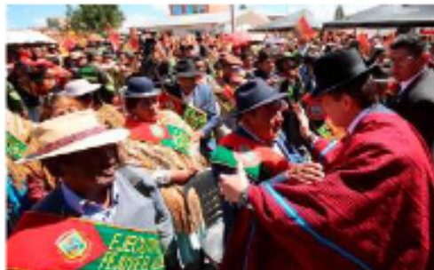
El Presidente Rodrigo Paz durante el aniversario de la Fejuve Sur