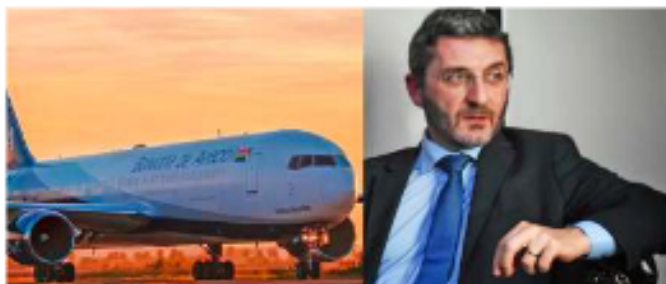
El embajador de Francia en Bolivia, Olivier Fontan, calificó de "incompetencia" el servicio de la aerolínea estatal tras la pérdida temporal de su equipaje /UNIL.

mático, quien incluso cuestionó si se trata de "incompetencia o sabotaje", fuentes cercanas a la aerolínea estatal señalaron que este tipo de contingencias operativas suelen deberse a factores logísticos externos o ajustes técnicos de último momento en el itinerario.