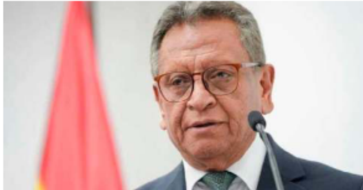
El ministro de Gobierno pidió ser interpelado con urgencia