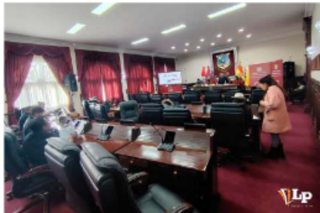
La ALDO tendrá nuevas autoridades a inicio de mayo

en la primera vuelta, la fuerza mayoritaria en la asamblea departamental será la Alianza Jacha, que contará con 14 de los 33 asambleístas. Con el triunfo en Sajama este domingo, la Alianza Oruro Avanza (AORA) mantiene cinco representantes.