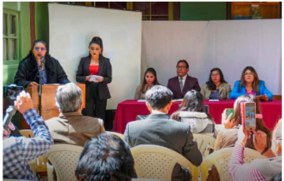
Presentación oficial del III Encuentro Nacional de Guías de Turismo

Desde el Gobierno Autónomo Departamental de Oruro se