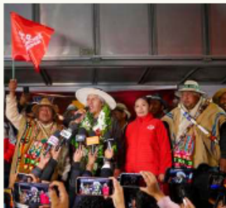
Se ratificó el triunfo de Sánchez en el balotaje, tras finalizar el cómputo oficial