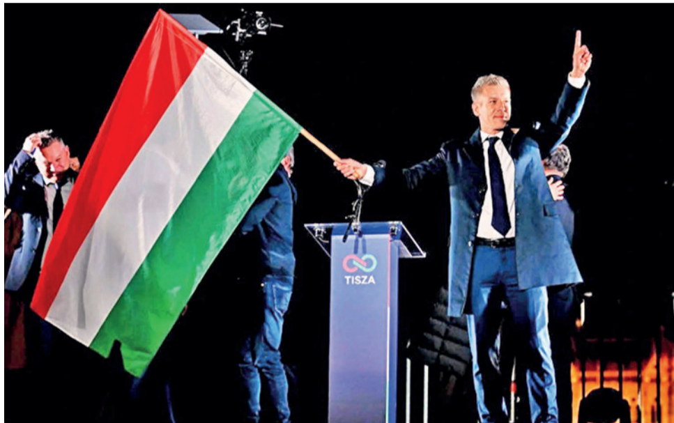
Péter Magyar celebra su victoria en los comicios de Hungría.

Uno de ellos cree en un "cambio significativo" tanto en el fondo como en el estilo, con una nueva Hungría más práctica y menos contraria a las normas. Un segundo diplomático se mostró mucho más comedido, señalando la asociación previa de Magyar con Fidesz, que podría perdurar. Un tercero se decantó por un "optimismo cauteloso", con especial énfasis en esta última palabra. "Por su-