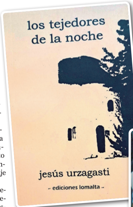
Jesús Urzagasti y su obra "Los tejedores de la noche".

En el desenlace conoce a uno de los trabajadores, como augurio del último viaje: Al fin me topé cara a cara y