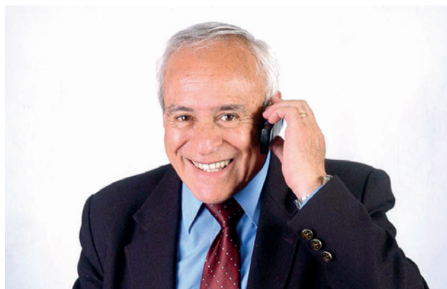
El actor y humorista David Santalla.

El reconocimiento, otorgado mediante la Ordenanza Municipal N.º 017/2026, destaca la labor de Santalla no solo como actor y humorista, sino como un “patrimonio vivo” que dejó reflexiones imborrables a través de más de 50 personajes, entre ellos la emblemática Imilla