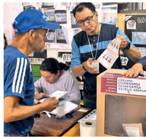
Las pasadas elecciones judiciales. C. LÓPEZ