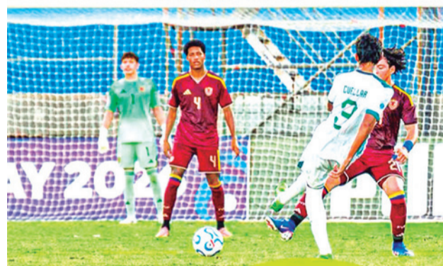
Una escena del partido Bolivia vs. Venezuela.