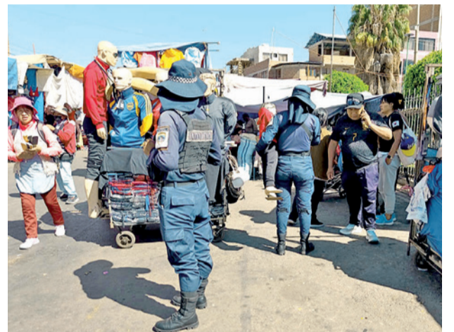
Control por parte de Intendencia Municipal.