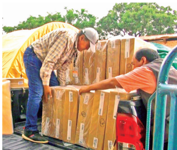
Distribución de material para la segunda vuelta en Santa Cruz. TED-SC

Mientras, en Tarija, la disputa estará entre Adrián Oliva, de