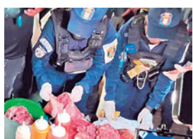
Control de alimentos de la Intendencia.

La Intendencia decomisó hamburguesas y carne en mal estado en dos puestos de comida rápida de la concurrida zona del Correo y lamentó la falta de conciencia de los comerciantes.