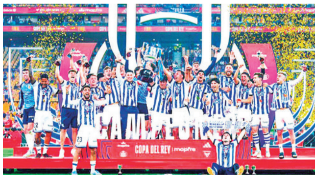
Jugadores de Real Sociedad celebran el título. MUCHODEPORTE.COM

España. El portero elegido por Matarazzo para la final de Copa fue protagonista en la tanda de penaltis, donde detuvo dos tiros