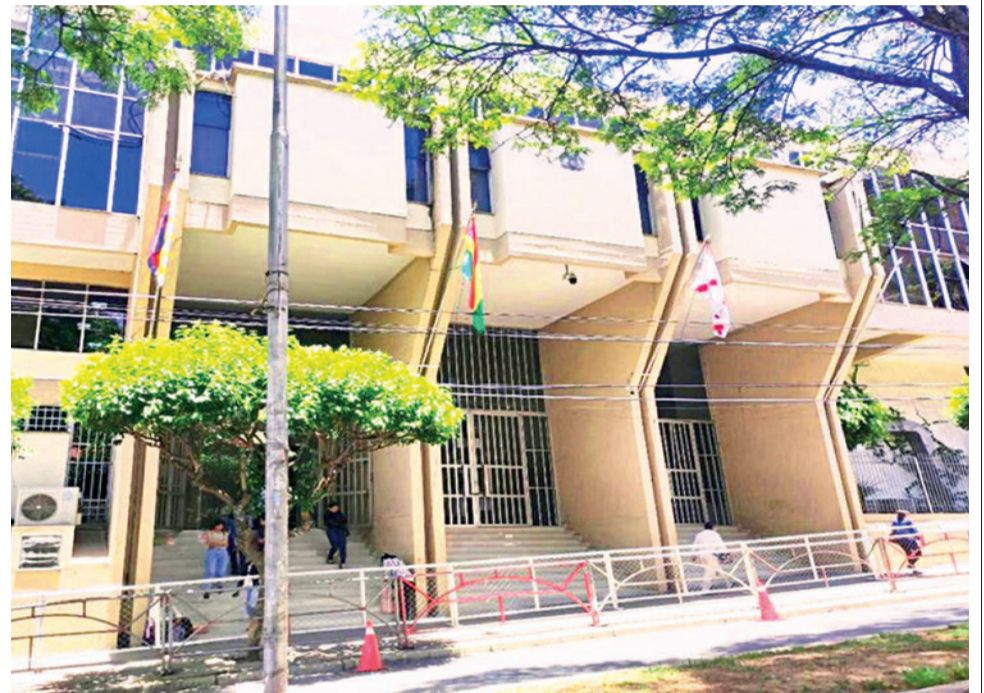
La sede del Tribunal Constitucional Plurinacional de Sucre. RRSS

La denominada “ley corta” está pendiente por la falta de coordinación entre las fuerzas políticas de la ALPQE