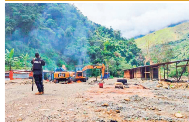
Un efectivo policial en el operativo de ayer. AJAM

La celeridad prevista en la difusión de resultados responde a que en esta votación solo habrá dos candidatos en cada papeleta.