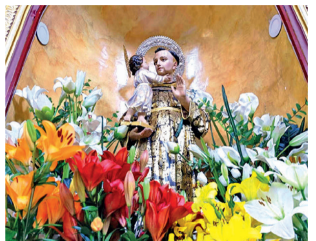
Imagen de San Antonio en la parroquia.