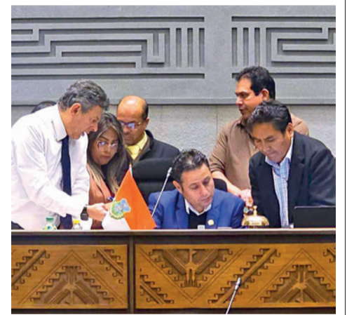
La Asamblea Plurinacional. VPEPB