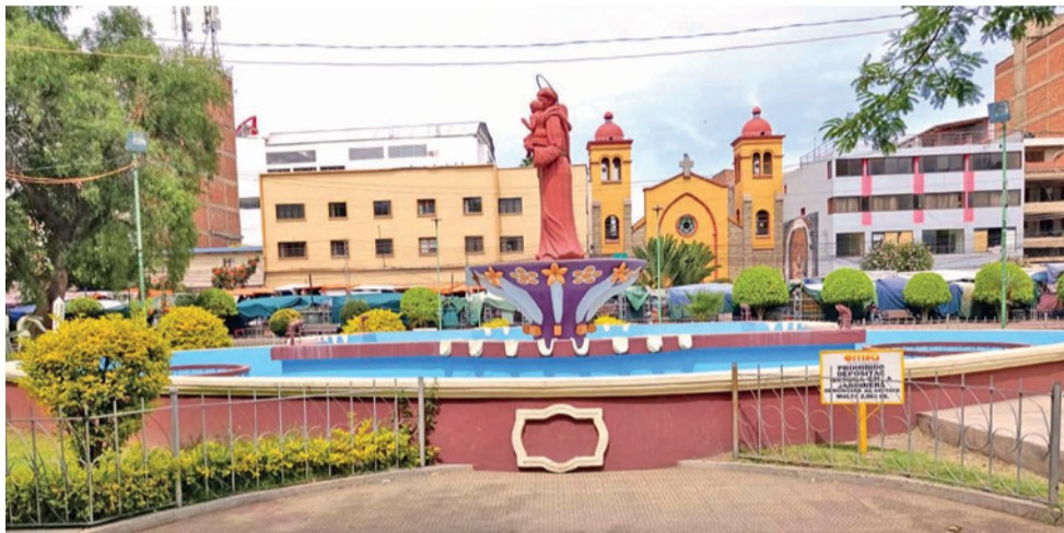
El centro de la plazuela San Antonio cerrada al público.

“A través de la OTB y del párroco del lugar, para que se recupere esta zona paulatinamente, hay lugares, días y horas específicas de ingreso”,