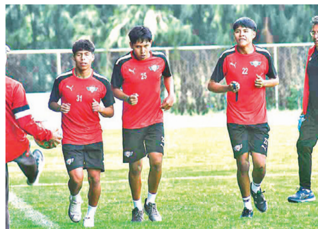
Aprestos del club Wilstermann en su reducto.