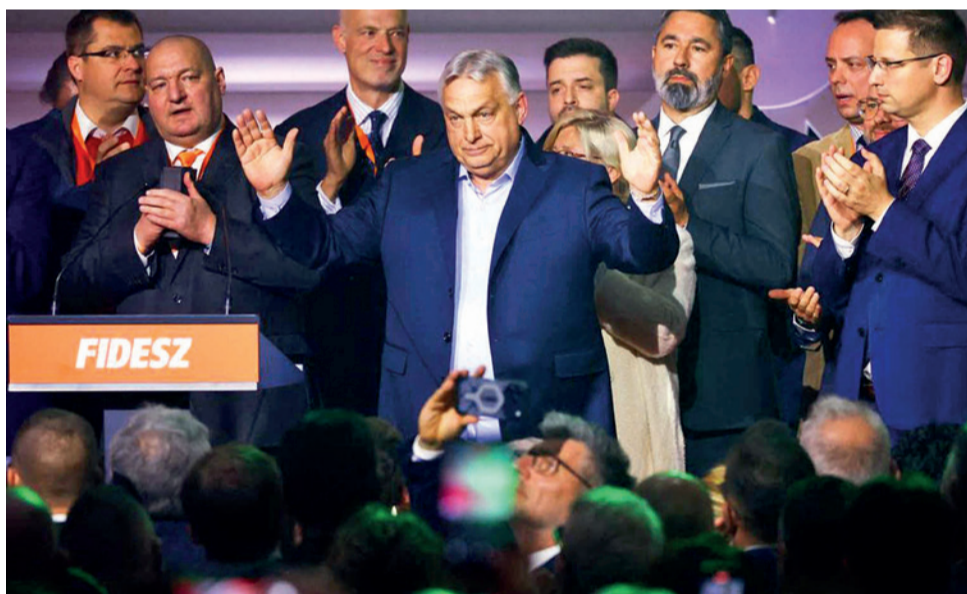
Viktor Orbán reconoce su derrota electoral en Hungría.