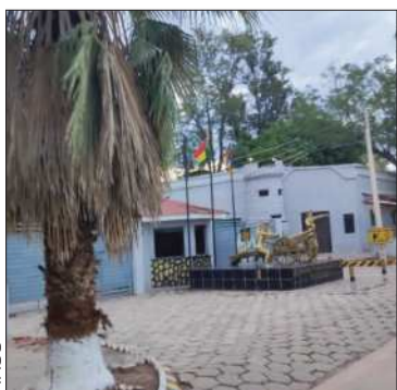
FRSS Frontis del recinto cuartelario.

La Policía aprehendió a una funcionaria del SLIM y a la esposa del uniformado