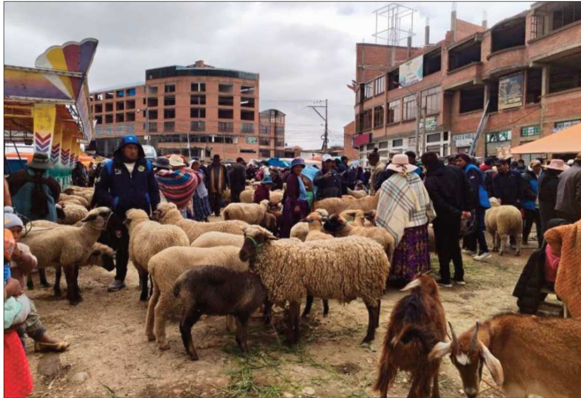
EXPOSICIÓN. La Feria de Ramos ofrece una variedad de productos incluyendo ganado.

También productos agrícolas como queso, frutas, verduras, cereales, ganado ovino, vacuno y