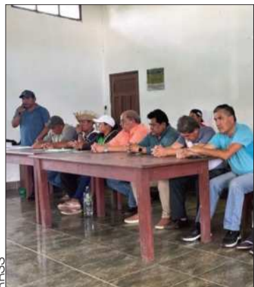
Dirigentes campesinos en reunión.

El encuentro buscaba atender las demandas del sector pero no prosperó