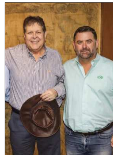
Autoridades de Gobierno y la CAO.

Asimismo, se subrayó que este tipo de espacios refleja la voluntad institucional de fortalecer la cooperación entre el Estado y el sector privado.