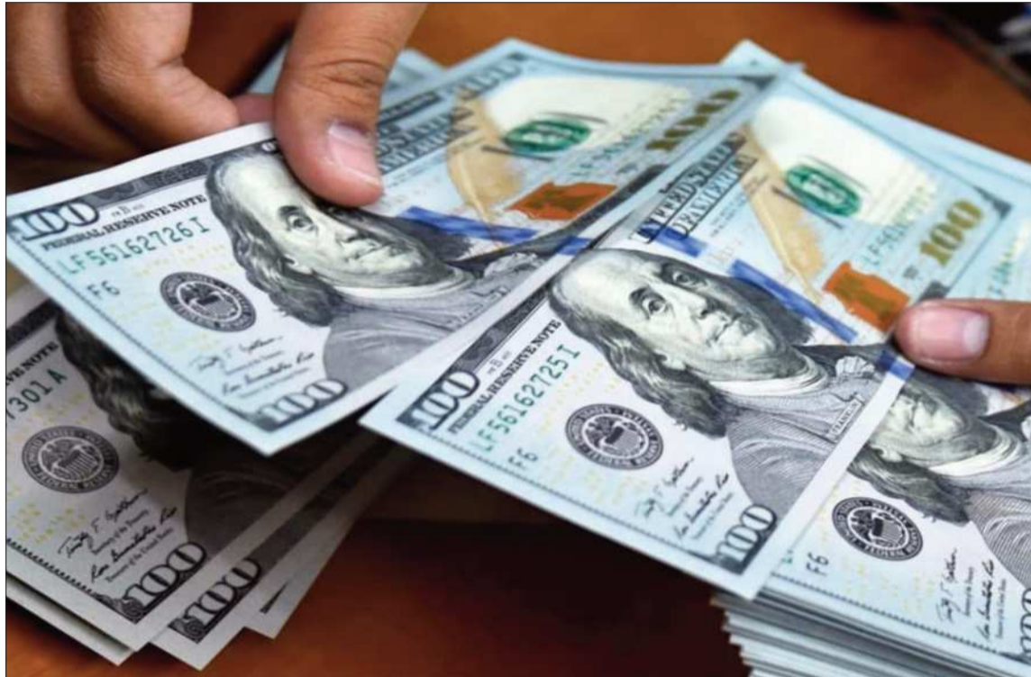
MONTOS. El BCB presentó el Informe de la Deuda Externa Pública de Bolivia al 31 de marzo de 2026.

Las transferencias netas (desembolsos menos amortizaciones) registraron un saldo negativo de 865 millones, lo que refleja una mayor salida de recursos en comparación con el ingreso de financia-