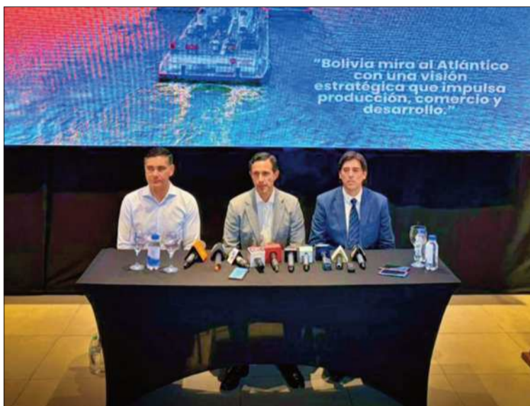
ENCUENTRO. Las autoridades del Estado participan de la reunión.

Puerto Busch es un puerto fluvial situado al extremo sureste de Bolivia, en la provincia Germán