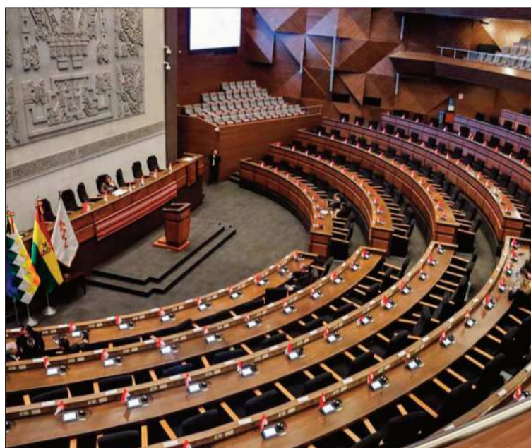
AUSENCIA. El vicepresidente Edmand Lara, en la sesión de Asamblea.

Recordó que, durante la sexta sesión ordinaria realizada la semana pasada, se comunicó al vicepresidente del Estado la realización de una sesión del pleno del Senado en la ciudad de Tarija. También se informó sobre el desplazamiento de la directiva de la Cámara de Diputados, además de la coincidencia con la jornada