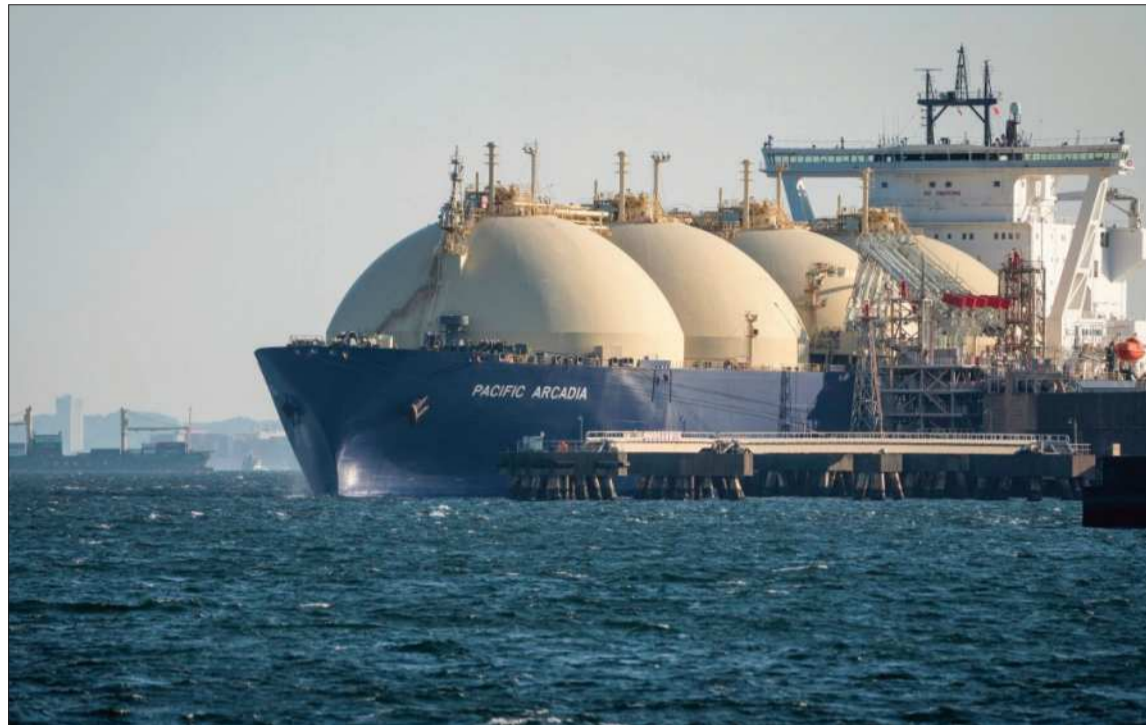
NORMALIZACIÓN. Los buques con gas y petróleo comenzaron a cruzar el estrecho.

“Hemos estado en la calle yendo de un lugar a otro porque no había espacio en los refugios”, afir-