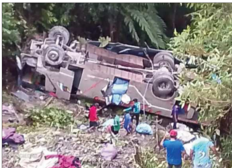
TRÁGICO. Un bus cayó a un barranco en la carretera a Apolo.

“Estamos atravesando por una etapa de siniestralidad alta que responde a diferentes situaciones y circunstancias por las cuales la