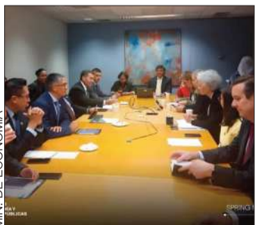
La reunión con el Banco Mundial.

Ministros de tres carteras se reunieron en EEUU con el Banco Mundial