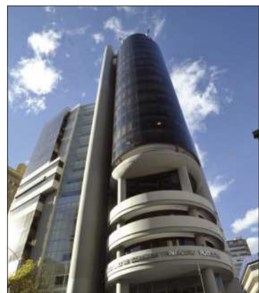
El ministerio de Economía.

Se pagó el bono de Incentivo a la Permanencia a 174.396 maestros