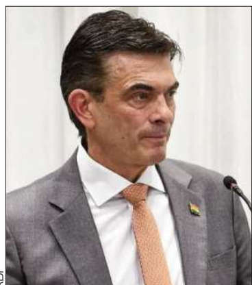
ABI El presidente Rodrigo Paz.

El mandatario convocó a las futuras autoridades a enfocarse en el trabajo