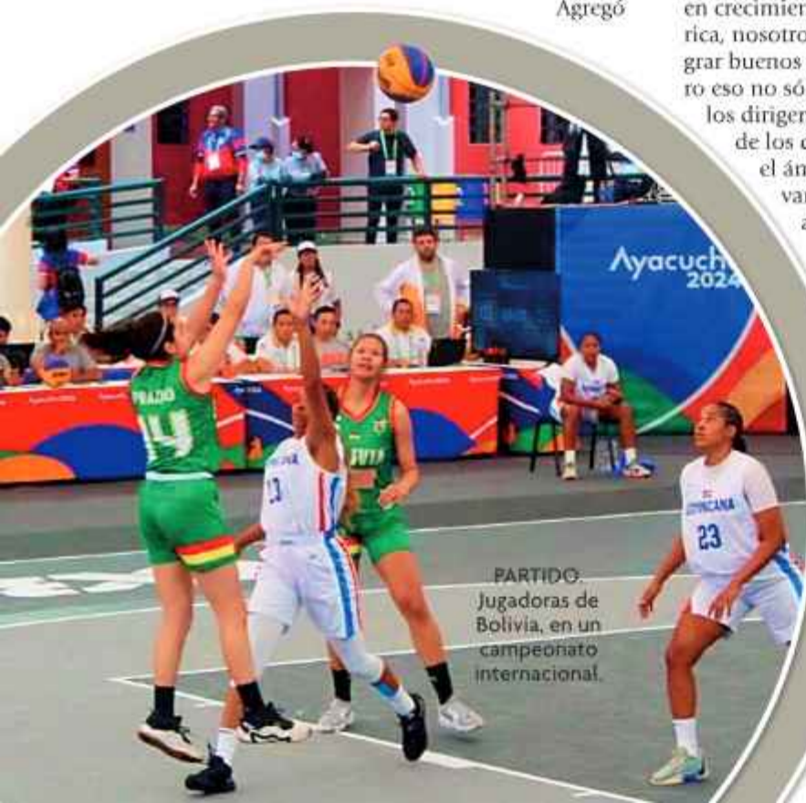
PARTIDO: Jugadoras de Bolivia, en un campeonato internacional.

"Los partidos duran 10 minutos o hasta que un equipo llegue a 21 puntos. Cada enceste cuenta: los tiros dentro del arco valen un punto y los que se hacen desde fuera valen dos. Este juego exige velocidad, agilidad y resistencia excepcionales por parte de sus jugadores, lo que garantiza que cada enfrentamiento sea intenso", concluyó el entrenador.