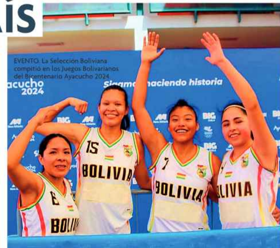
EVENTO: La Selección Boliviana compitió en los Juegos Bolivarianos del Bicentenario Ayacucho 2024. Sigamos haciendo historia.

En Bolivia, este deporte se practica desde hace más de 10 años, pero a nivel de grupos de deportistas no "asociados". De acuerdo con los datos de la Federación Boliviana de Básquetbol, a nivel competitivo no se realizan torneos oficiales, sí torneo relámpago que convocan los mismos jugadores de Cochabamba, Santa Cruz, Tarija, La Paz, Oruro y Potosí.