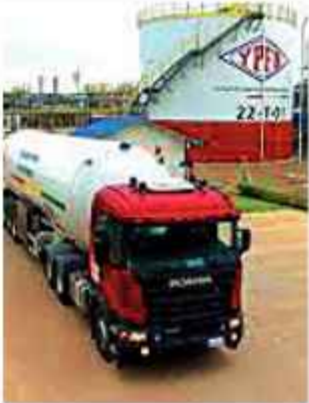
FILAS. Cisternas esperan en la planta de Senkata.

Ejecutivos la CAO y Asosur Santa Cruz expresaron su preocupación.