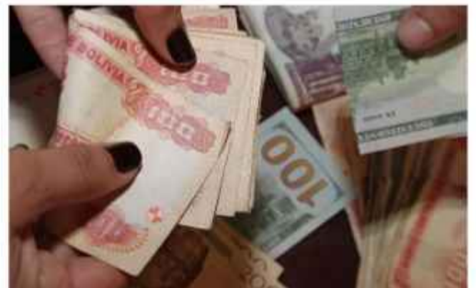
INFORME. La deuda externa se redujo en un 5 por ciento.

Desarrollo (BID) encabeza la lista de acreedores con 4.387,7 millones de dólares, equivalentes al 32,7 % del total; CAF-Banco de Desarrollo de América Latina y el Caribe, con 3.366,1 millones de dólares, que representan el 25,1 %; y el Banco Mundial con $us 1.707 millones que significan el 12,7 por ciento de la deuda.