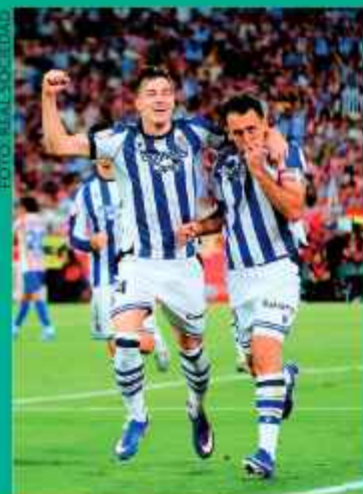
ALEGRÍA. Jugadores de Real Sociedad festejan un gol.

Mientras que Marcos Llorente, del Atlético de Madrid, admitió que "hemos salido mal al partido, regalamos la primera parte y en partidos así te cuesta mucho. En la segunda parte jugamos mejor. Cuando llegas a los penaltis puede pasar cualquier cosa y se la han llevado ellos".