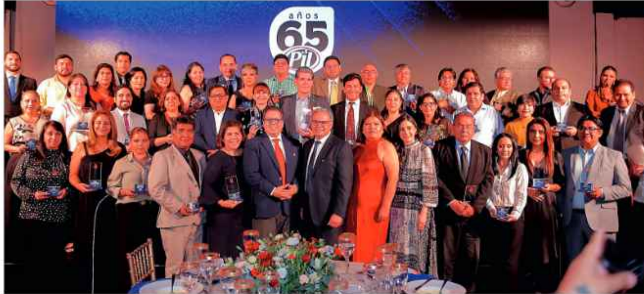
DISTINCIONES. Ejecutivos de PIL junto a los periodistas a quienes distinguieron por su larga trayectoria en los medios.

Para entender el fenómeno provocado por esta empresa en la Bolivia contemporánea es preciso retroceder a la década de 1970 en la sede del gobierno, una ciudad por entonces con menos de medio millón de habitantes,