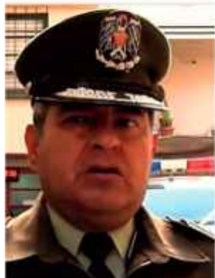
AUTORIDAD. Javier Salgueiro, subcomandante.

"El cuerpo estaba envuelto en un frazada dentro de una bolsa plástica. Se encontró algunas prendas de vestir, toallas higiénicas con sangre, una ecografía, una vela de cumpleaños y otros objetos. Se investiga el caso", informó ayer Javier Salgueiro, subcomandante departamental de la Policía de La Paz.