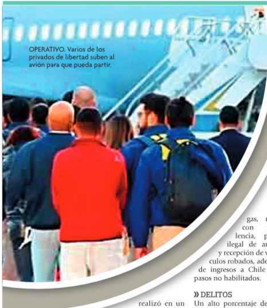
OPERATIVO. Varios de los privados de libertad suben al avión para que pueda partir.