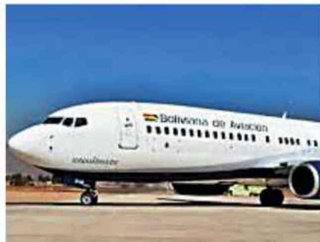
AVIACIÓN. La imagen de esta nave sólo es referencial.

"La DGAC informa a la comunidad aeronáutica general que la nave de Boliviana de Aviación, con matrícula CP-2925, número de vuelo OB400 y que cubría la ruta a La Paz-Cobija se declaró en emergencia. Se reportó una alerta en el sistema de presurización a las 9:17. Se realizará el seguimiento correspondiente conforme a la normativa vigente", se lee en el comunicado.