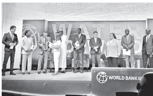
Los ministros en los encuentros en EEUU.

Las autoridades nacionales participan en el marco de la iniciativa global Water Forward: Driving Jobs and Prosperity (Impulsando el empleo y la prosperidad en español), donde se desarrolló un importante encuentro