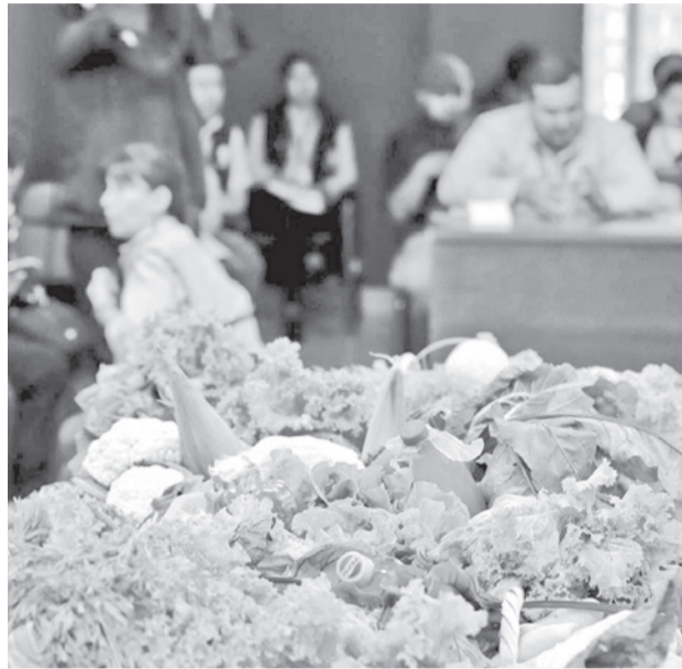
La promulgación de ley de huertos urbano.

Sacaba, que forma parte de la Región Metropolitana Kanata del departamento de Cochabamba, cuenta con una población de 219.092