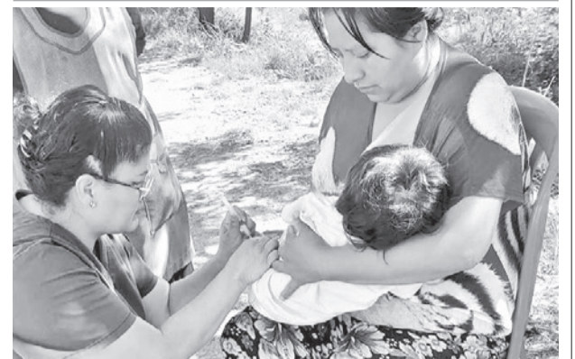
La vacunación contra la influenza. MINISTERIO DE SALUD

la economía local, garantizar alimentos saludables y proteger el medio ambiente. Entre los principales alcances de la ley se destacan el fortalecimiento de capacidades productivas.