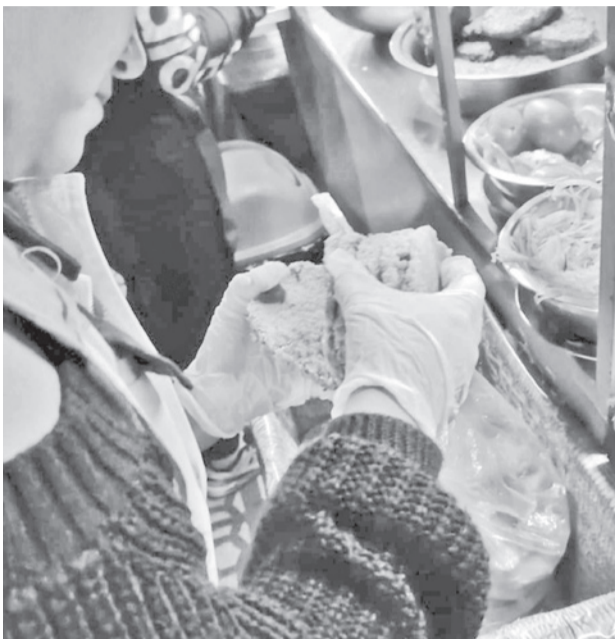
El decomiso de carne en mal estado. INTENDENCIA

Sin embargo, ayer, Defensa del Consumidor de la Alcal-