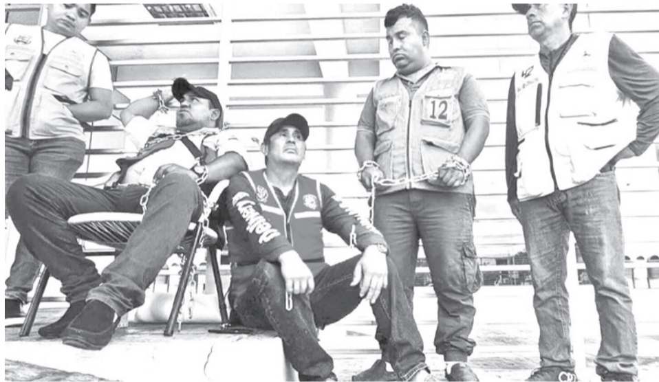
Mototaxistas se encadenan en puertas de YPFB para exigir el resarcimiento.

“No va a servir ninguna ampliación ni fechas estable-