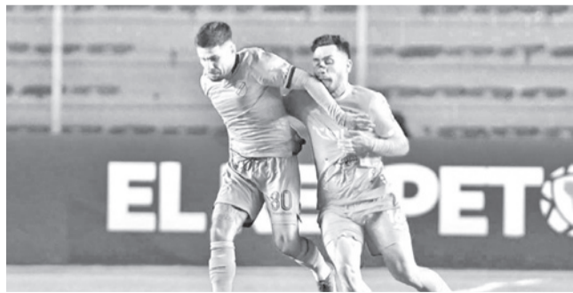
Bolívar en el partido ante Deportivo La Guaira. M.REGISTRADA

Balance. Los jugadores señalaron que se hacen responsables de los resultados y hablan de mejorar para los próximos cotejos