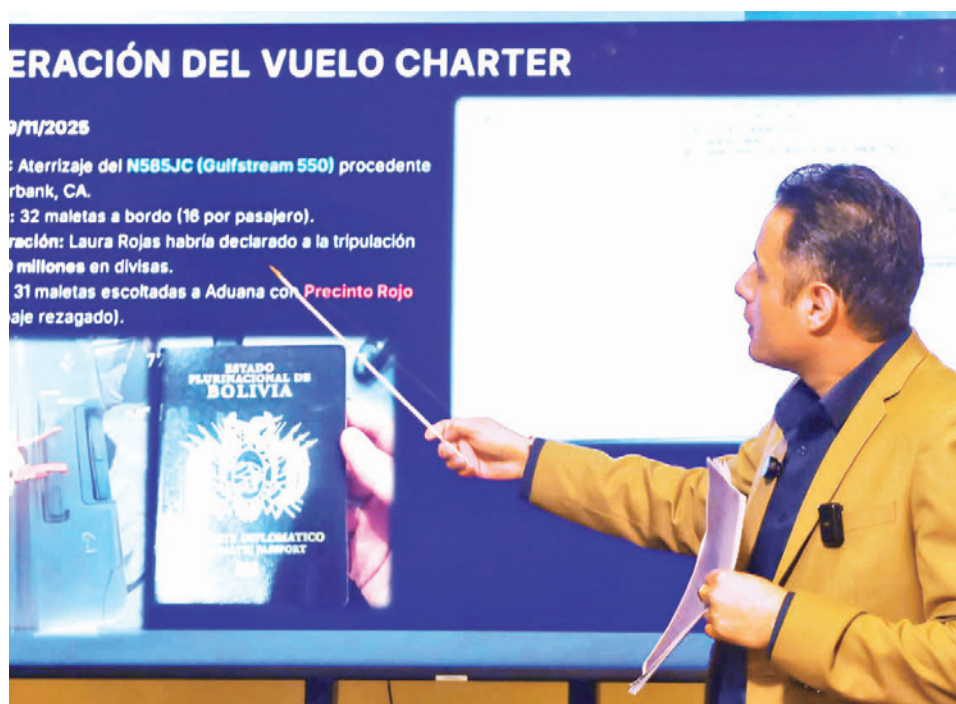
El vicepresidente del Estado, Edmand Lara, en conferencia de prensa. VPEPB