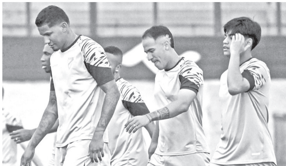
La preparación de Always Ready para enfrentar al equipo argentino.