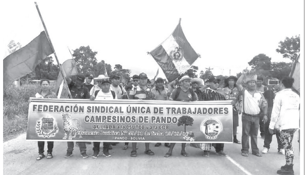
La marcha de los campesinos de Pando y Beni rumbo a La Paz contra la ley 1720.