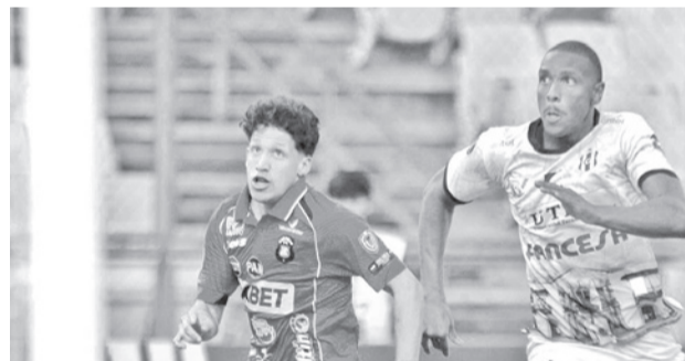
Incidentes del partido de Caracas e Independiente, ayer, en la capital venezolana.

El próximo cotejo de la Academia celeste será ante Independiente el 21 de abril en Sucre en cotejo válido para el campeonato nacional.