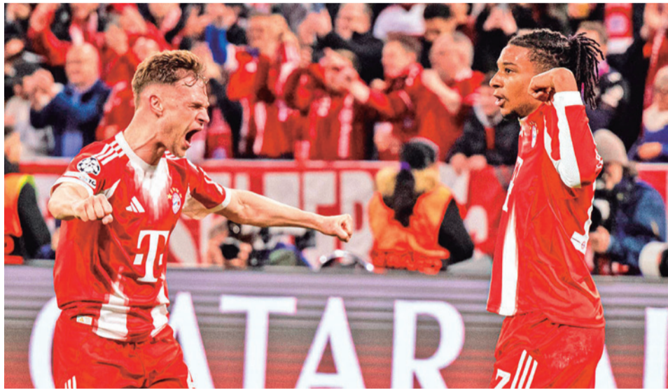
El festejo del Bayern de Múnich tras vencer al Real Madrid.

El programa de partidos de ida de las semifinales de la Champions League está previsto el martes 28 y el miércoles 29, mientras que las revanchas están previstas el 5 y el 6 de mayo. El duelo por el título se jugará el sábado 30 del próximo mes en el Puskas Arena de Budapest.