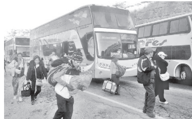
El bloqueo en Parotani, ruta al occidente.