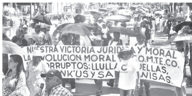
La marcha de los socios de Comteco. JOSE ROCHA

Conflicto. Los manifestantes advierten que continuarán con las protestas hasta conseguir cambios en la administración de la telefónica