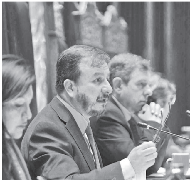
Sesión de Asamblea durante una interpelación.

Llamado. El pleno de la Asamblea Legislativa podría convocarlos ante la falta de información de diferentes procesos.