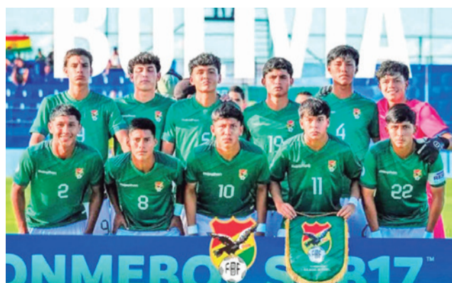
La Selección de Fútbol Sub-17. CONMEBOL

Antes del choque boliviano en el mismo escenario deportivo se enfrentarán las selecciones de Uruguay y Venezue-