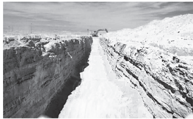
La zanjas en la frontera con Chile.

“Queremos usar las retroexcavadoras para construir un Chile soberano (...) que ha sido vulnerado por la inmigración ilegal, por el narcotráfico, por el crimen organizado”, dijo el mandatario chileno cer-