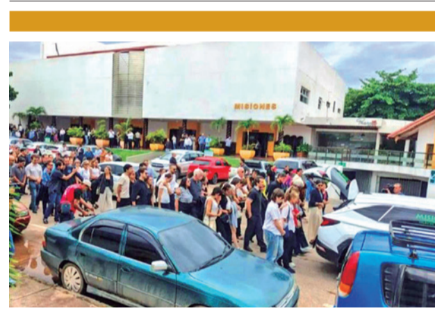
El funeral de los pilotos, ayer en Santa Cruz.

"Hay documentación respaldatoria que lo van a encontrar en el texto e, independientemente de este texto, se tiene el cúmulo de documentos. No es solamente un relato", afirmó.