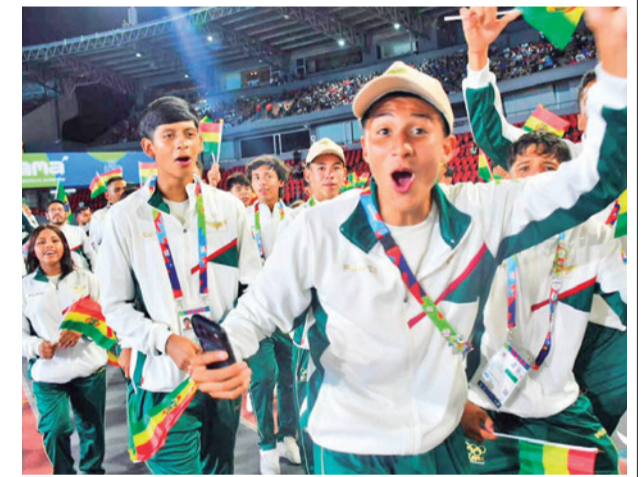
Deportistas en los Juegos Bolivarianos.