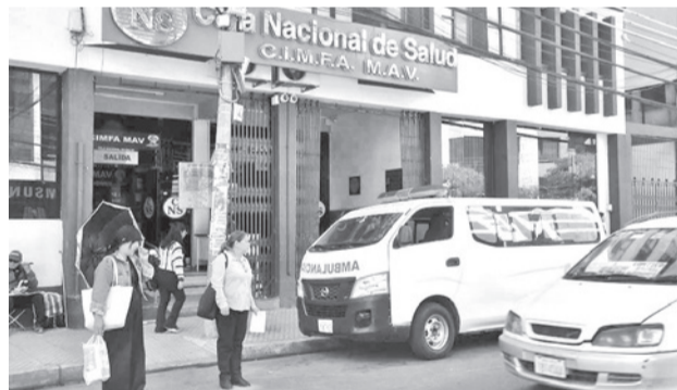
Las instalaciones de la CNS, en el centro. JOSE ROCHA

En medio del conflicto interno, persisten exigencias de ambas partes sobre las condiciones del proceso electoral, por lo que su realización continúa en la incertidumbre para superar los problemas que enfrenta la institución.