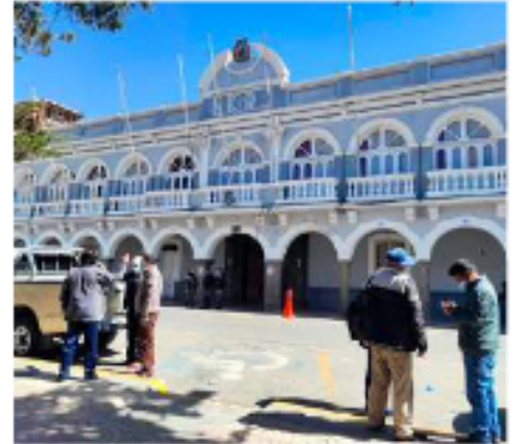
El domingo por la noche se conocerá al nuevo gobernador de Oruro y se prevé que la transición inicie la siguiente semana