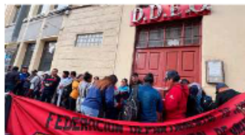
Maestros rurales se declaran en estado de emergencia / LA PATRIA

En el ámbito de salud, los maestros rurales denunciaron deficiencias en la atención de la Caja Nacional de Salud (CNS). Señalaron la necesidad de mejorar la calidad y eficiencia de los servicios para el sector. También expresaron su rechazo a la denominada "optimización de ítems", medida que, aseguran, estaría re-