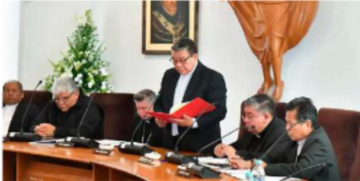
La Iglesia boliviana defiende el mensaje de paz del Papa frente a los recientes señalamientos del mandatario estadounidense

LA PATRIA La Conferencia Episcopal Boliviana (CEB) se reunió en Cochabamba para respal-