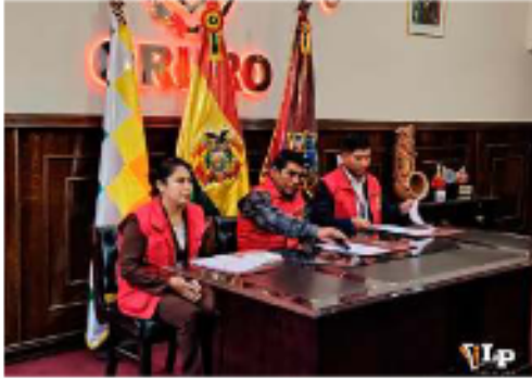
Autoridades departamentales presentaron el decreto

1. Desde las 00:00 del jueves 16 hasta las 18:00 del domingo 19, queda prohibida cualquier forma de manifestación pública a favor o en contra de las candidaturas.