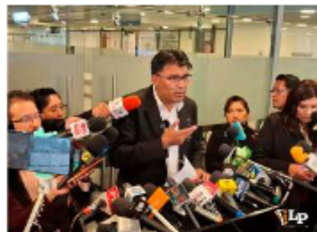
El senador Nilton Condori en conferencia de prensa.

La diputada destacó que muchos casos de violencia sexual ocurren en el hogar y que actualmente no existe en Bolivia el delito de "violación incestuosa".