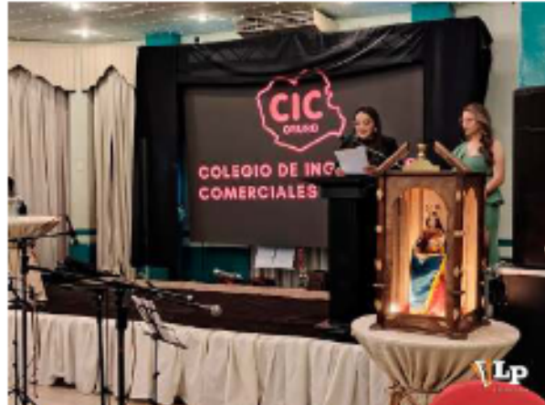
Acto de conmemoración de la creación del CIC Oruro

Finalmente, subrayó que el color carmesí representa pasión