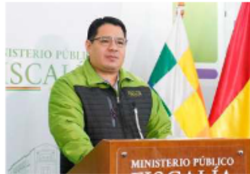
El fiscal general del Estado, Roger Mariaca.

La desvinculación masiva se ejecutó bajo dos frentes administrativos definidos por el Ministerio Público. Por un lado, 18 funcionarios fueron apartados tras culminar procesos disciplinarios donde se probó la comisión de faltas muy graves en el ejercicio de sus cargos. Por otro