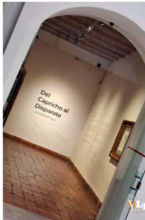
La exposición muestra 80 piezas que llegaron a Bolivia y se exponen en La Paz

aprovechando la cercanía de la Noche de Museos, se extendió hasta el 16 de mayo. Se espera una afluencia masiva de personas que podrán ver los 80 grabados. Posteriormente, las obras viajarán a Santa Cruz y Cochabamba.