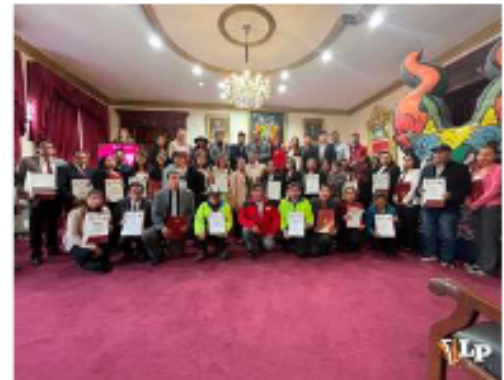
Los gestores tienen proyectos y emprendimientos turísticos en distintos municipios de Oruro

nio cultural y natural de Oruro en oportunidades económicas, situando el desarrollo en manos de los propios territorios.