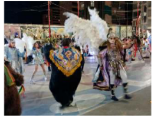
Demostración coreográfica de la Diablada Artística Urus en la Av. Cívica Sanjinés Vincenti

Además, la noche llena de alegría y colores