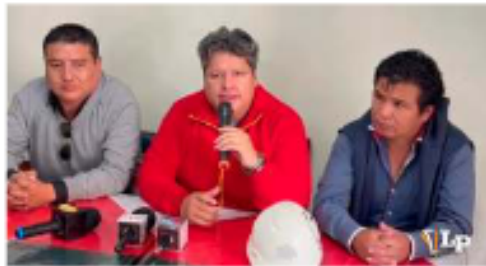
Medina (centro) reapareció tras las elecciones del 22 de marzo

Medina expresó: "hemos tenido una campaña, nosotros un poco dura, creo que hemos llegado a parámetros muy complicados en el tema de la guerra sucia". Además, lamentó que hubo una campaña en contra de su candidatura dentro de la misma alianza. Afirmó que ciertos dirigentes no respetaron el