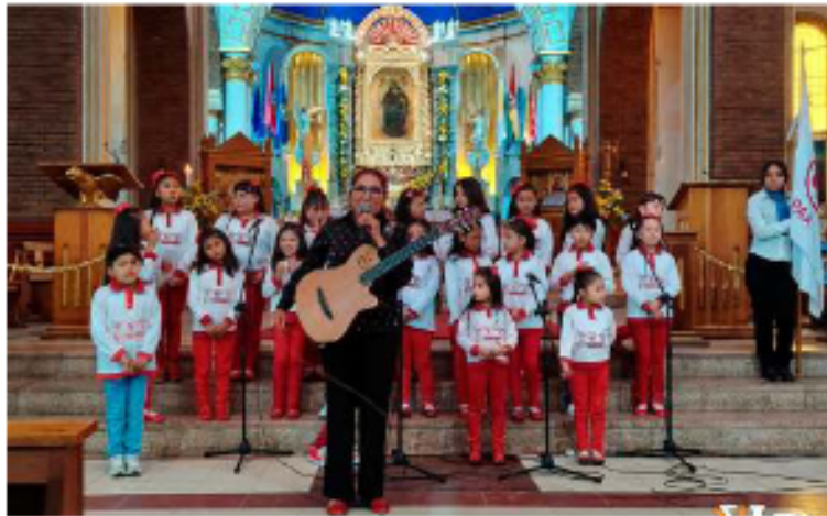
La Sociedad Coral Infantil Oruro conquistó al público asistente al espacio sagrado