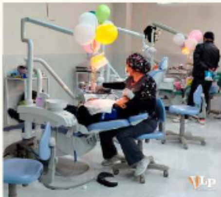
Varios niños recibieron la atención de los especialistas.