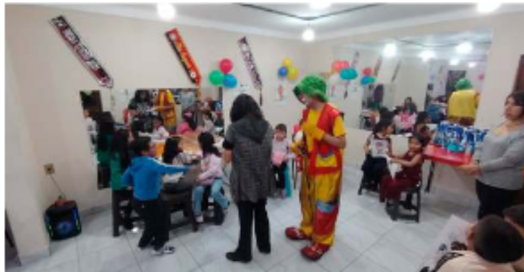
Los niños participaron de varias actividades durante el festejo.

La Corporación Artística La Cábala de Oruro organizó una celebración especial para el Día del Niño. Este evento, realizado el sábado 11 de abril, reunió a cerca de 20 niños que disfrutaron de diversas actividades artísticas. La jornada incluyó dibujo, pintura, teatro y cuenta cuentos, creando un ambiente festivo y creativo.