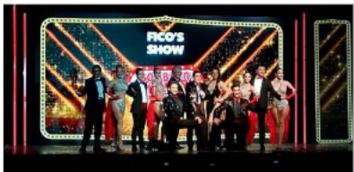
FICO'S SHOW presenta "BOMBAZO de HUMOR"