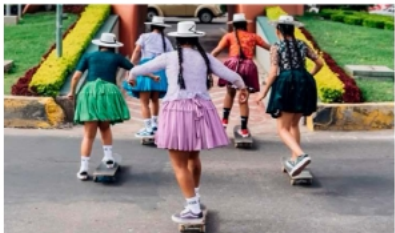
Las jóvenes skaters usan la pollera tradicional andina como símbolo de orgullo y resiliencia cultural.

Dirigido por la cineasta Rebecca Basauré y el real-