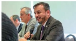
El ministro de Hidrocarburos, Mauricio Medinaceli, no se presentó hoy a la sesión en la ALP