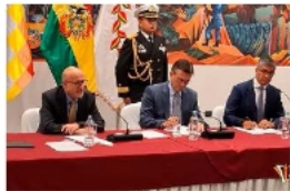
El Presidente Rodrigo Paz junto a ministros de Estado anunciando el Decreto Supremo 5600

"161 decretos por más de 96 millones de dólares