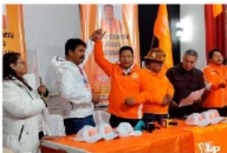
Chambi durante un acto proselitista.

Tras confirmarse el balotaje en Oruro, sur-