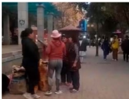
Comerciantes no pueden retirar puestos en vía pública /IRSE

Pally explicó que, según la Ley 482 de Gobiernos Autónomos Municipales, solo funcionarios autorizados, como los comisarios de área dependientes de la Unidad de Defensa al Consumidor, pueden llevar a cabo acciones de control en espacios públicos. En este contexto, cuestionó hechos recientes en el Parque de la Unión, donde comerciantes intentaron retirar a una vendedora de pan. "Al