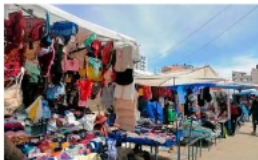
Gremiales rechazan reordenamiento sin alternativas.

Este tipo de planteamientos no es nuevo. Según Vélaz, ha sido recurrente en distintas gestiones municipales. Sin embargo, ninguno ha logrado concretarse por la falta de infraestructura. "No hay un recinto donde se pueda recibir a los comerciantes. Pretenden llevarlos a los extremos de la ciudad sería atentar contra su fuente laboral", sostuvo.