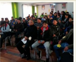
Hubo bastante interés ciudadano en la subasta

El notario de fe pública también estuvo presente