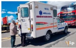
Los pobladores de Turco llevaron una ambulancia al punto de bloqueo /NIFMA MILLU

Los dirigentes del transporte insistieron en