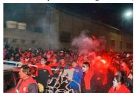
Las excursiones escolares en Oruro podrán realizarse, pero bajo condiciones /ME

Se reiteró que el cumplimiento de la normativa vigente es obligatorio. Por lo tanto, cualquier excursión debe desarrollarse dentro de los marcos establecidos, priorizando tanto la seguridad de los estudiantes como la continuidad del proceso educativo.