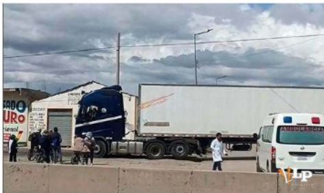
Grupo de conductores impidió el paso de la ambulancia /FR 15

La ambulancia cumplía funciones de referencia para pacientes provenientes del municipio de Poopó, quienes requerían atención en centros