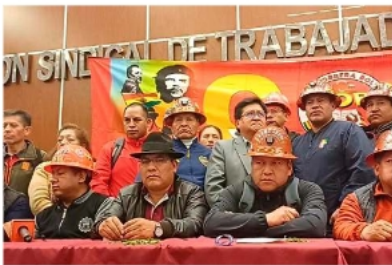
Dirigentes nacionales de diversos sectores sociales cierran filas para la convocatoria del próximo 1 de mayo

Tras un ampliado nacional, la COB lanza su convocatoria al Gran Cabildo del 1 de mayo para abordar distintos temas