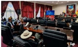
La sesión se extendió por poco más de cuatro horas

A pesar del desinterés, se aprobaron seis carpetas. La primera fue una modificación presupuestaria que traspasa recursos de la Gobernación al municipio de Toledo. Este dinero financiará la ejecución y mantenimiento del tramo carretero Cruce KI.