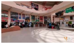
Los viajes se normalizan tras levantarse puntos de bloqueo / IBERA

La reactivación del servicio responde al acuerdo alcanzado entre el sector