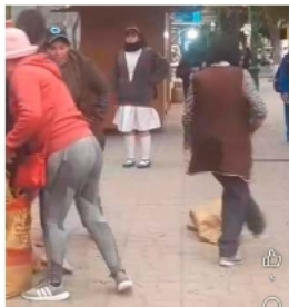
En el video se observa a otras comerciantes botando un saco vacío de pan

Este caso reabrió el debate sobre el control de precios, la competencia en la venta de productos básicos y el uso de espacios públicos en Oruro. Mientras tanto, se espera una reunión entre vecinos y autoridades municipales para esclarecer la situación y definir posibles acciones.