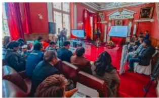
Alcaldía presenta rendición de cuentas inicial 2026

La autoridad también hizo énfasis en la importancia de optimizar los ingresos propios del municipio. Identificó como una de las tareas pendientes el ordenamiento territorial. Entre los puntos considerados prioritarios se encuentran la aprobación de planimetrías y el saneamiento territorial, medidas