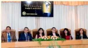
Acto por la celebración de los 131 años de la Cámara de Comercio de Oruro

En ese marco, el viernes 27 de marzo la Cámara de Comercio celebró su aniversario con un acto conmemorativo que reunió a autoridades, empresarios y representantes institucionales, en una cere-