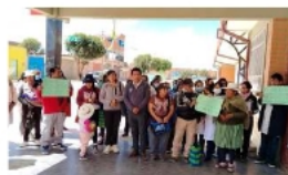
Centro de Salud 7 de Marzo se declaró en estado de emergencia / REDDA A LA PATRIA

En total, el centro requería cerca de 45 trabajadores bajo contrato municipal para su funcionamiento pleno, todos los cuales actualmente están fuera del sistema. Esta situación no se está aislando. Según el jefe médico, otros establecimientos de salud del municipio atraviesan problemas similares, lo que podría derivar en cierres o restricciones adicionales en distintos puntos de la ciudad. Desde la Secretaría Municipal de Salud se informó que las convocatorias ya estarían en proceso de publicación en el Sistema de Contrataciones Estatales (Sicoes). No obstante, el personal del centro advierte que incluso si se publican de inmediato, los plazos administrativos podrían extenderse hasta 45 días