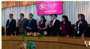
Momento del brindis por el aniversario de la centena institución LA PATRIA