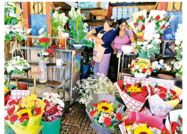
Comerciantes acomodan los ramos de flores. NELSON RAMOS