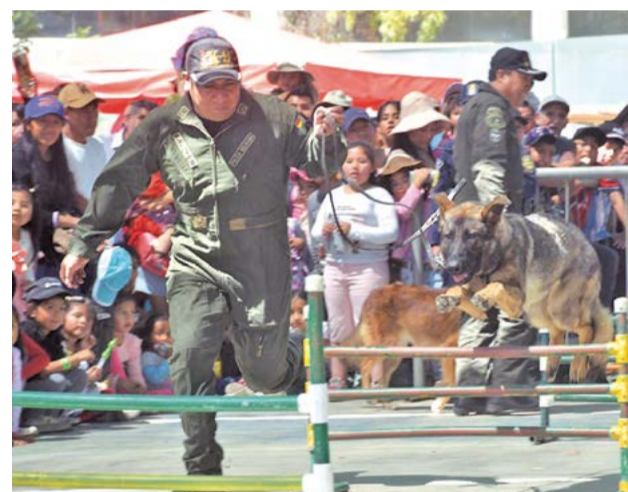
Demostración canina. CARLOS LÓPEZ