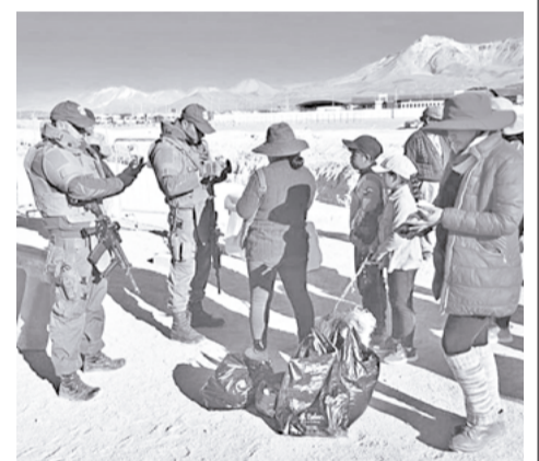
La revisión en el límite entre Bolivia y Chile. CARABINEROS