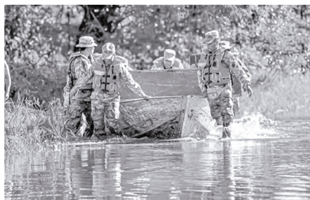
El rescate de una víctima de los desastres.

“La afectación que estamos teniendo por las lluvias se ha podido observar en los departamentos de Santa Cruz, Cochabamba, Beni y La Paz, pero eso no significa que no en los demás departamentos; tene-