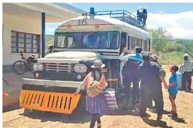
Buscarril de colores blanco y azul. RADIO ESPERANZA

Durante la inauguración, los representantes destacaron la importancia de este servicio para mejorar la co-