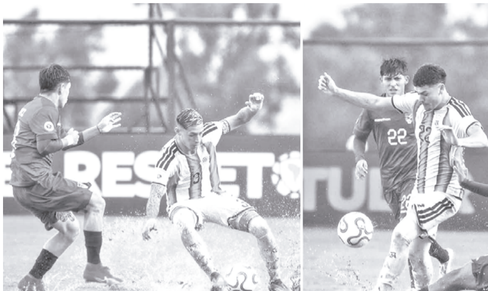
Jugadores de Bolivia y Argentina disputan el balón durante el partido.