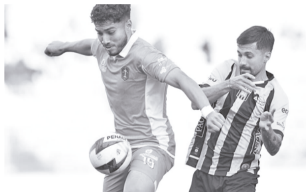
Los jugadores del Tigre y San Antonio, ayer. MARKA REGISTRADA

Totora-Real Oruro empató con Blooming 2-2 ayer en el estadio Jesús Bermúdez, en partido válido para la segunda fecha del torneo de la División Profesional, con lo que volvió a ceder puntos en casa,