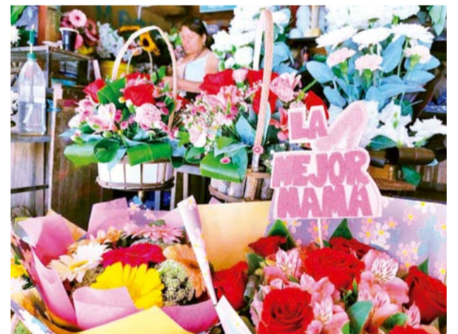
Oferta de arreglos para ocasiones especiales. NELSON RAMOS