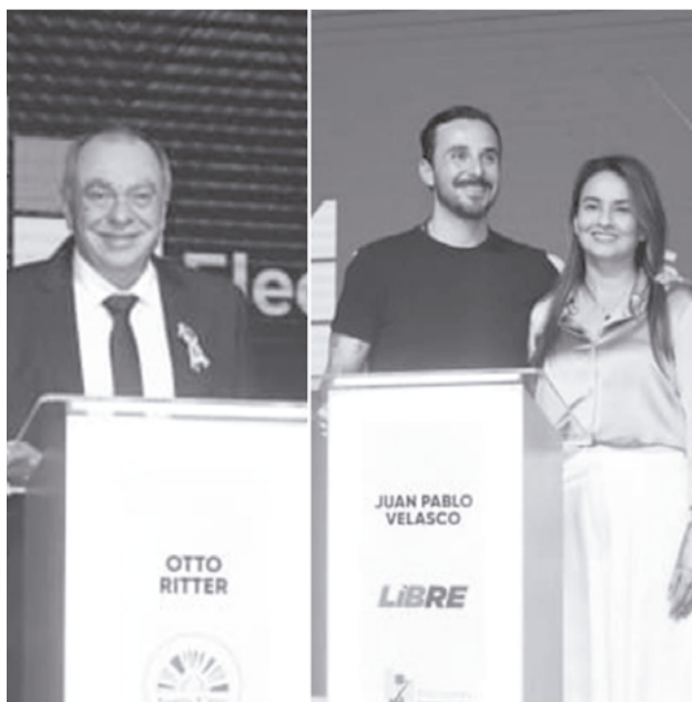
Uno de los debates realizados para el balotaje.

El estudio que terminó de realizarse el pasado 9 de abril, otorga a Velasco una ventaja de 8,9 puntos porcentuales sobre su rival, Otto Ritter.