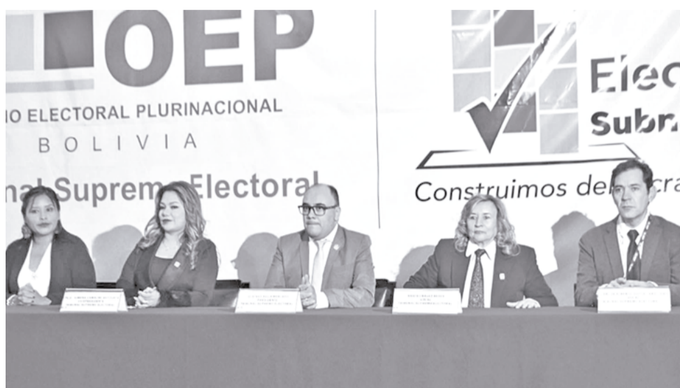
Gustavo Ávila, presidente del TSE, junto a otros vocales del Órgano Electoral. TSE

Sin embargo, pese a la orden judicial, ayer la red televisiva Unitel difundió una encuesta de preferencia electoral realizada por la empresa Ciesmori para las elecciones en segunda vuelta en los cinco departamentos en los que se realizará la segunda vuelta electoral.