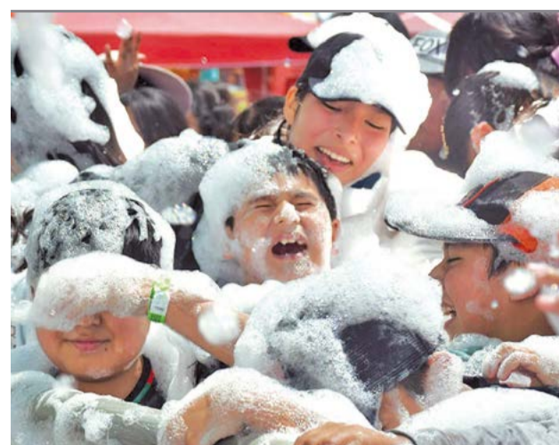
Niños cubiertos de espuma. CARLOS LÓPEZ