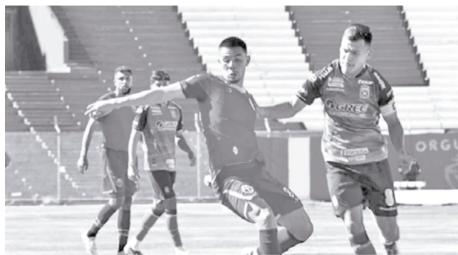
Incidencias del partido entre Real Oruro y Blooming. LT

Igualdad. El partido es válido para la segunda fecha del torneo de la División Profesional del Fútbol Boliviano.