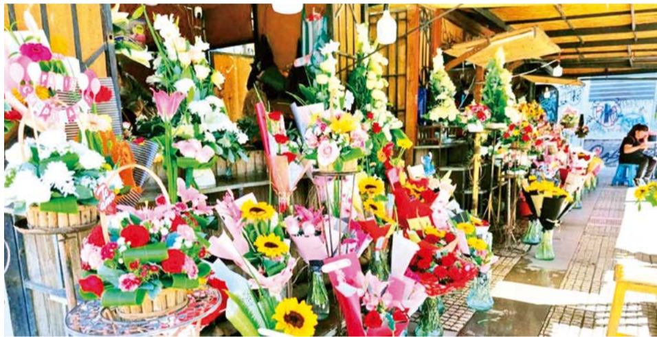
La fila de puestos de flores en la plaza Del Granado.