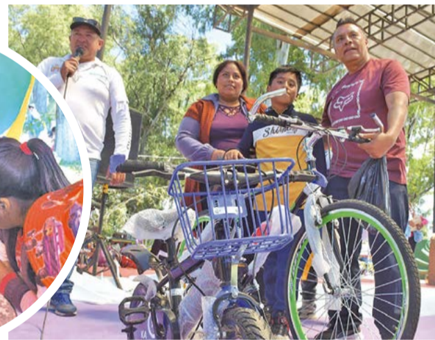
Niños gana sorteo de bicicleta. CARLOS LÓPEZ