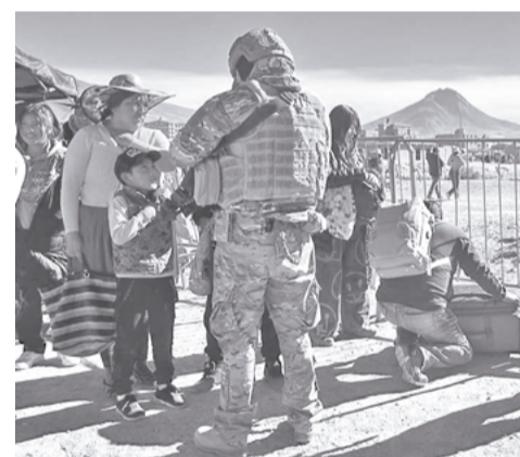
Control fronterizo a niños y pobladoras del lado boliviano.