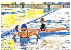
La escuela de natación.