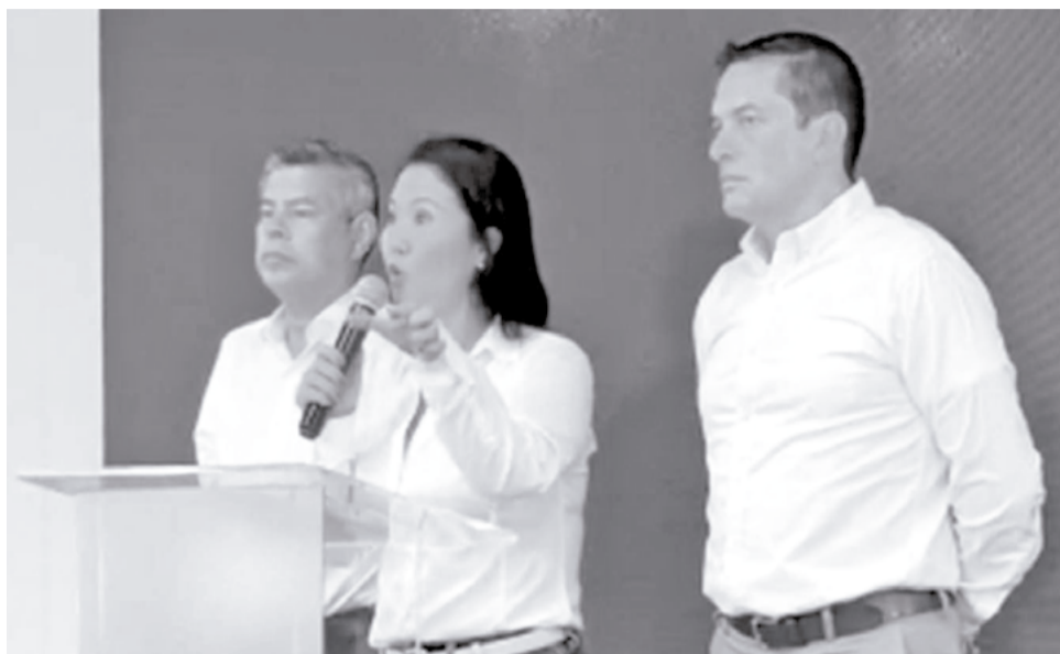
La candidata Keiko Fijimori, según sondeos a boca de urna, asegura ir a 2da vuelta.

El candidato ultraconservador peruano Rafael López Aliaga afirmó que las elecciones generales que se celebran este domingo en Perú "se han manchado" con la falta de material electoral en varios centros de votación de Lima y pidió que se convoque a elecciones complementarias "en el término de 24 horas". López Aliaga, quien también es exalcalde de Lima, consideró una "grave irresponsabilidad" los retrasos que dificultaron y, en algunos casos, impidieron que se celebre el proceso en centros de votación de Lima.