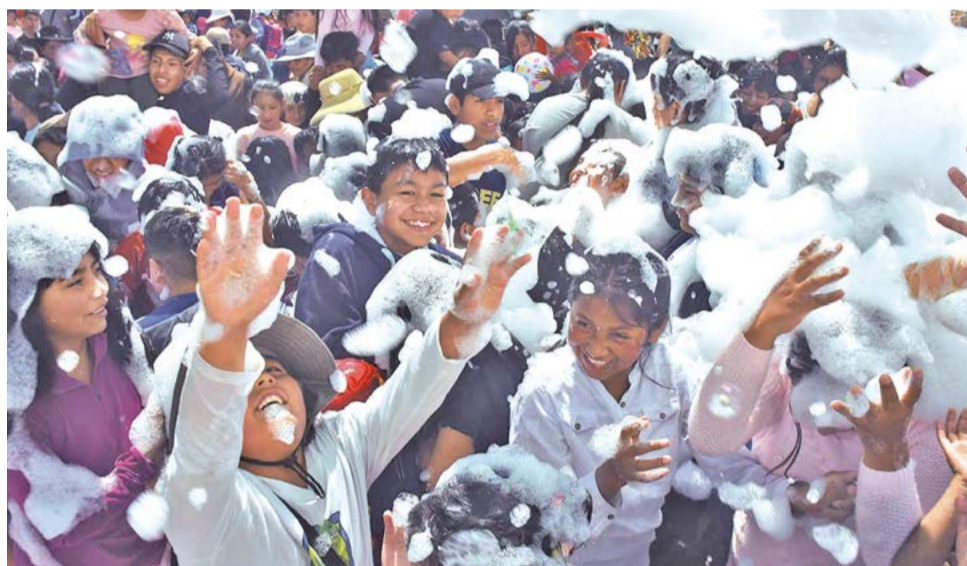
Niños disfrutando del show de espuma.