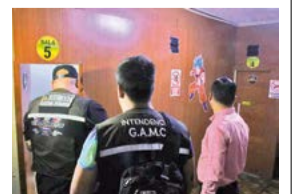
Cierran los mini cines en el centro. GAMC

Clausuran cuatro mini cines, ubicados en la zona central, por no contar con licencia de funcionamiento y por funcionar como moteles. En uno se encontró a dos menores de edad.