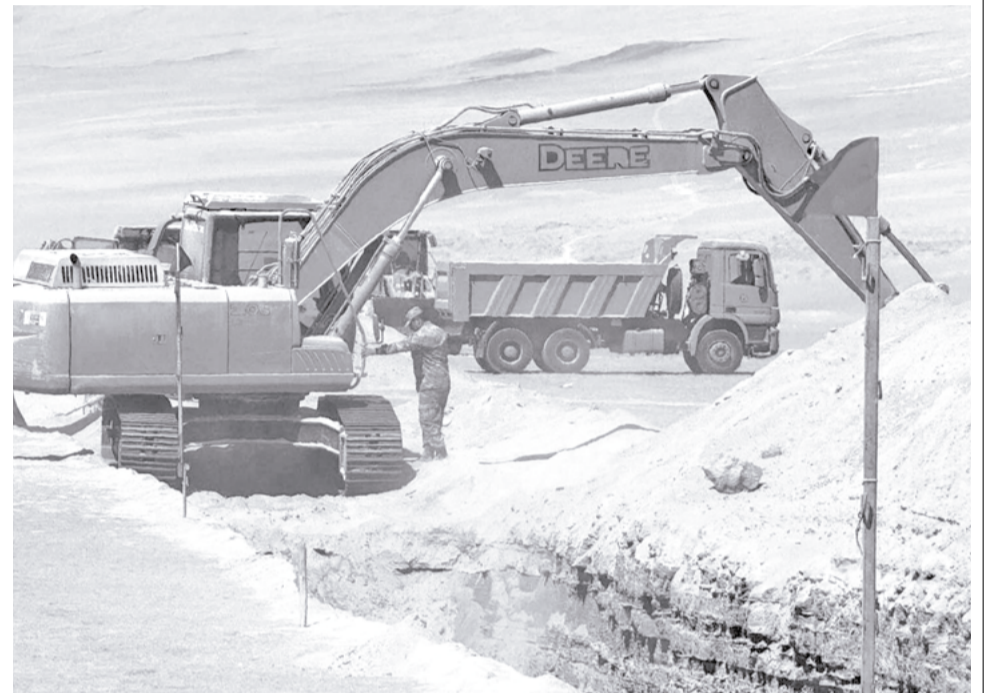
La construcción del muro chileno contra la migración ilegal. CARABINEROS

Bolivia y Chile no tendrían que inventar nada nuevo. En la región hay corredores escolares seguros como entre Colombia y Venezuela, y escuelas binacionales en la “frontera de la paz” entre Uruguay y Brasil. Estos casos demuestran que, cuando existe voluntad política, los Estados pueden priorizar el derecho humano a la educación por encima de la militarización y su seguridad interna. La propuesta técnica es clara: las escuelas en Colchane y Pisiga deben implementar una matrícula protegida y flexible. El estatus migratorio de los padres no puede ser un muro previo al ingreso a las aulas.