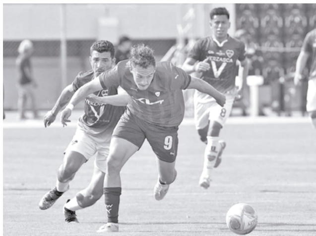
Jugadores de Wilster y Exótico disputan el balón, ayer. CL

Además del fútbol, en el entretiempo, los hinchas gozaron de una actividad distinta, pues también hubo paracaidismo, además de regalos para los asistentes, que dejaron conformes a los seguidores del rojo, en cuyo plantel se pudo observar a jugadores ex-