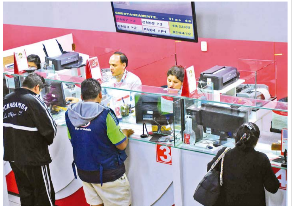
Trabajadores de la banca y usuarios. CARLOS LÓPEZ

La audiencia pública de rendición de cuentas 2025 del BCB dice que a “pesar del déficit de las empresas públicas en los últimos años, hasta octubre, el BCB continuó los desembolsos de las mismas”. Las “empresas públicas fueron deficitarias, con dependencia del TGN”.