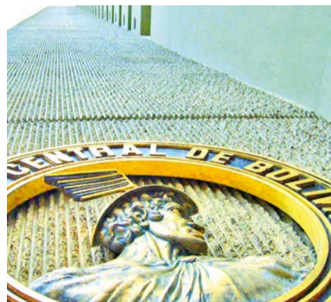
El logotipo del Banco Central de Bolivia.