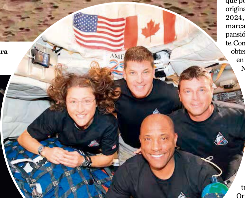
La tripulación de Artemis II.