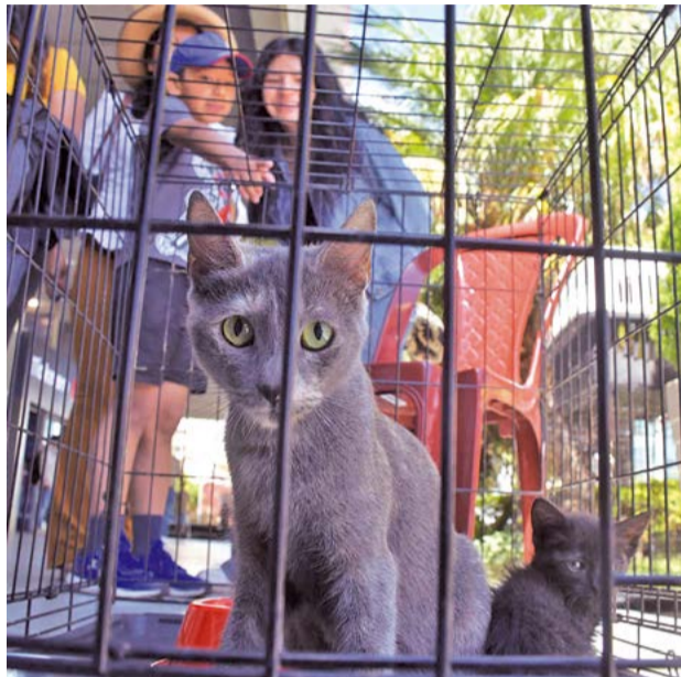
Gatos son dados en adopción a sus nuevos dueños, ayer. CARLOS LÓPEZ

En ese sentido, recomendó a la población asumir esta responsabilidad con compromiso. “Es importante