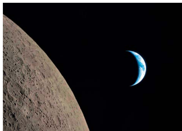
La Tierra, en fase creciente, pasando detrás de la Luna.

como agua y metales. Este interés coincide con la competencia geopolítica con China, cuya misión tripulada hacia el polo sur está prevista para 2030. Aunque el Tratado sobre el Espacio Ultraterrestre de 1967 impide la propiedad privada de la Luna, la presencia física otorga un control de facto sobre su utilización. Por ello, la exploración ya no se limita a una carrera, sino a la creación de una infraestructura permanente, que incluirá una estación espacial lunar en órbita y una base sobre el suelo satelital.