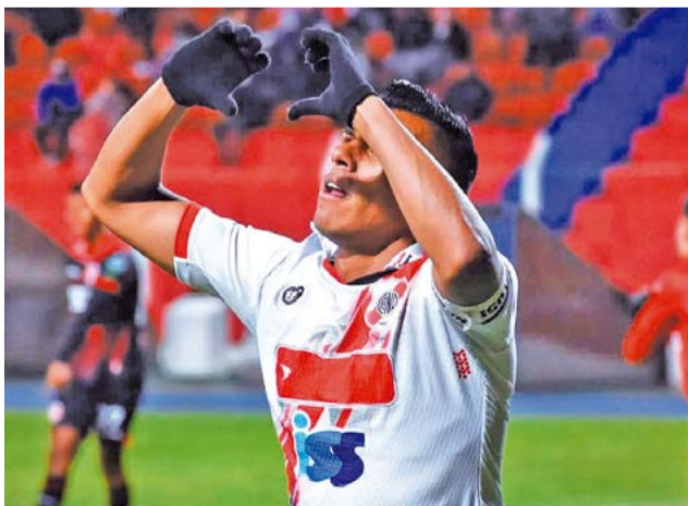
Un jugador de Nacional Potosí festeja el gol.