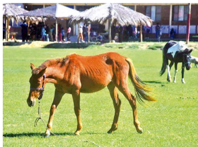
La equinoterapia para los niños del centro.