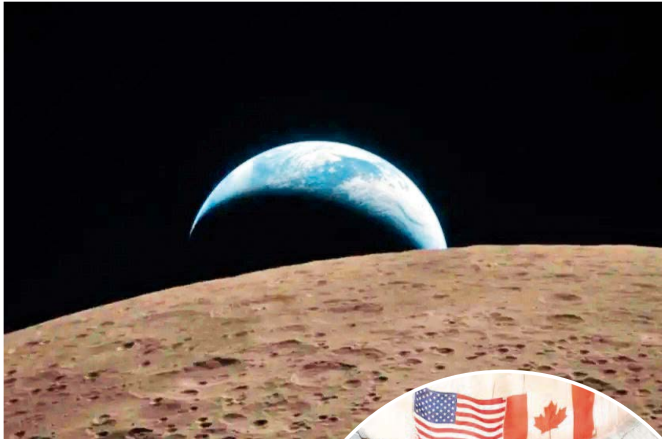
Primera imagen de la Tierra realizada desde la cara oculta de la Luna. NASA

El alunizaje, que la agencia espacial proyecta para al menos 2028, es un objetivo ambicioso. Rebecca Morelle, editora de ciencia de la BBC, señaló que la complejidad radica en la construcción del módulo de aterrizaje y los trajes espaciales. Este retraso es estratégico: la NASA busca un despliegue seguro en el polo sur lunar, una región de alto valor científico y económico por sus recursos