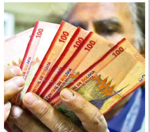
Dinero en bolivianos. CARLOS LÓPEZ