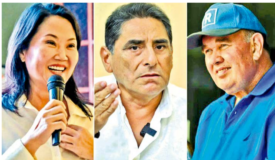
Keiko Fujimori, Rafael López, Carlos Álvarez lideran las encuestas en los comicios de Perú, que se celebran hoy.