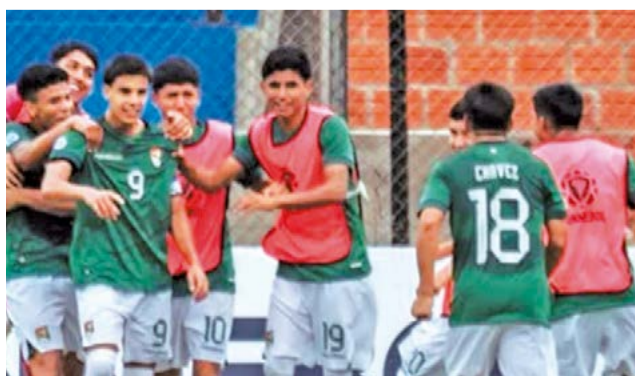
Los integrantes de la Sub -17.

En otro compromiso de esta serie rivalizarán Bra-