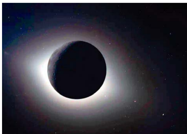
Eclipse solar que que los astronautas han presenciado.