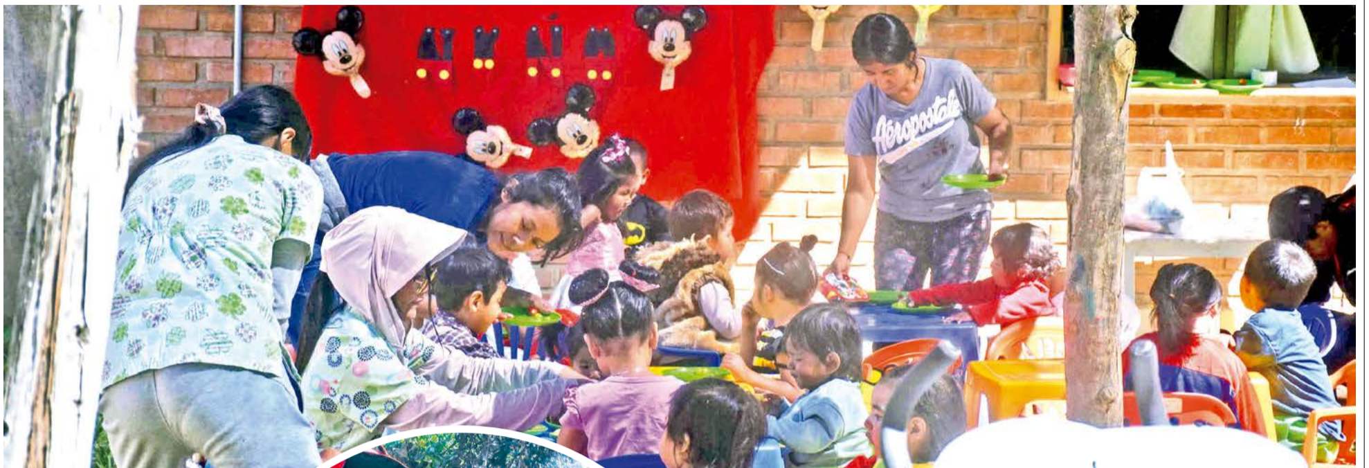
Una clase en la Casa de los Niños, en Sarcobamba. JOSÉ ROCHA