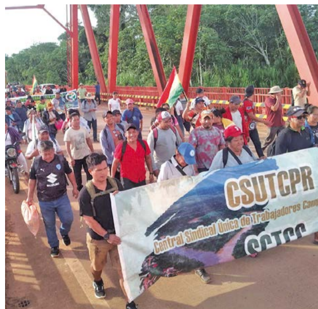
Campesinos e indígenas de Pando, rumbo a La Paz.

Las primeras voces de rechazo surgieron en Pando, donde organizaciones indígenas advirtieron que la ley podría afectar la integridad de los territorios comunitarios de origen (TCO) y favorecer la concentración de tierras. En ese contexto, pueblos como los Yaminahua, Machineris, Esse Ejja, Tacana, Pacahuara y Cavineño se reunieron en una asamblea en Nanagua, donde resolvieron iniciar la marcha.