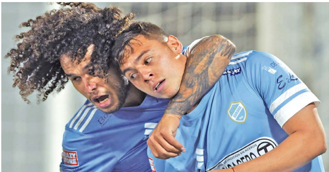
Los jugadores de Aurora celebran el gol del empate frente a Always Ready, ayer en el estadio Félix Capriles.

El segundo tiempo no cambió la forma de juego del local, que siguió al pie de la le-