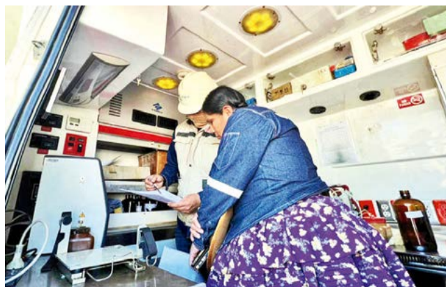
Una funcionaria atiende las máquinas de la ANH. ANH

“Desde que entramos nosotros, tuvimos que implementar los laboratorios móviles que en 10 años no tuvieron