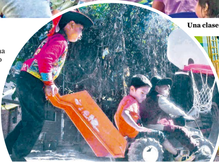
Niños comparten momentos de juego al aire libre.

El enfoque también incluye la educación en valores como la equidad y la responsabilidad compartida. "Tra-