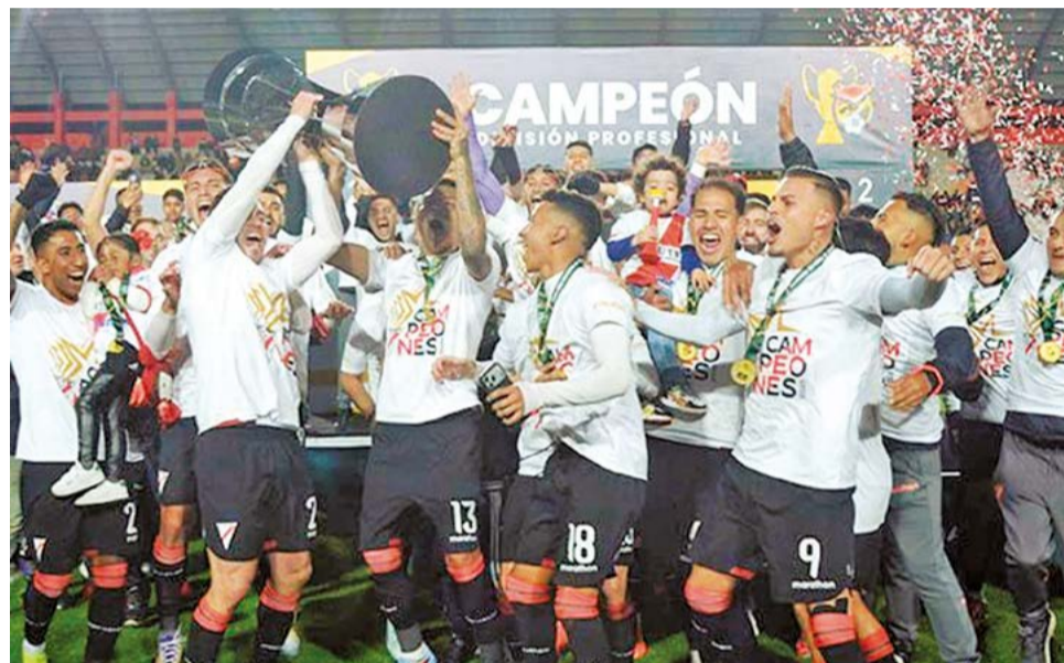
Always Ready durante el festejo tras lograr el campeonato de la División Profesional.

Yano es imbatible en la ciudad de El Alto, la caída ante el ecuatoriano Liga Deportiva Universitaria de Quito, así lo demostró, por lo que deberá recuperar el terreno perdido al jugar como visitante. El club emplea las instalaciones deportivas de Huarina, destinadas no solamente a su primer equipo, sino también a las divisiones formativas y al equipo femenino.