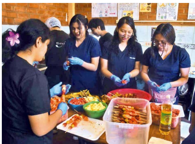
Voluntarios elaboran alimentos para los estudiantes. ROCHA

Dato. Un centro comunitario en Cochabamba que integra educación, salud, actividades educativas, terapias y aprendizaje cotidiano dentro de un modelo de atención integral