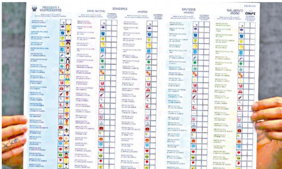
La cédula electoral donde figuran los 35 candidatos a la presidencia de Perú.

El sector militar está representado por José Williams (Avanza País), pro-