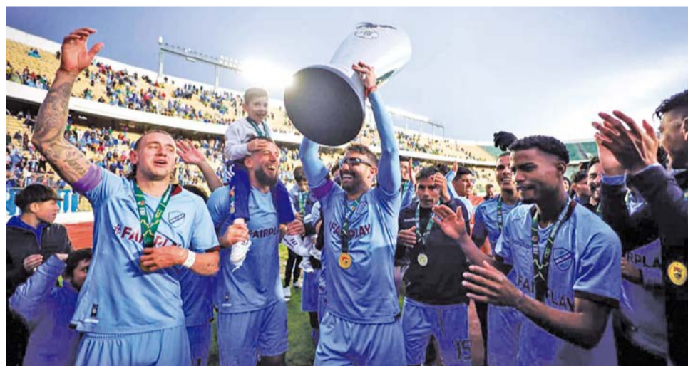
Los jugadores de Bolívar durante una celebración tras lograr título de campeón.