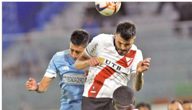
Aurora y Always disputan el balón, ayer.