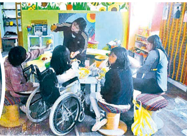
Niños con discapacidad en una actividad escolar. JOSÉ ROCHA