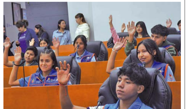
Encuentro de niños en la Asamblea Legislativa. CARLOS LÓPEZ

Asimismo, enfatizó que contó con la participación de niños de 47 municipios del departamento.