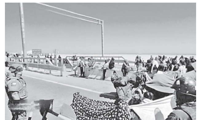
Migrantes en la frontera Perú con Chile.

La estrategia busca recuperar espacios donde operan redes criminales que aprovechan la dinámica de la frontera. En estas áreas, la movilidad constante de per-