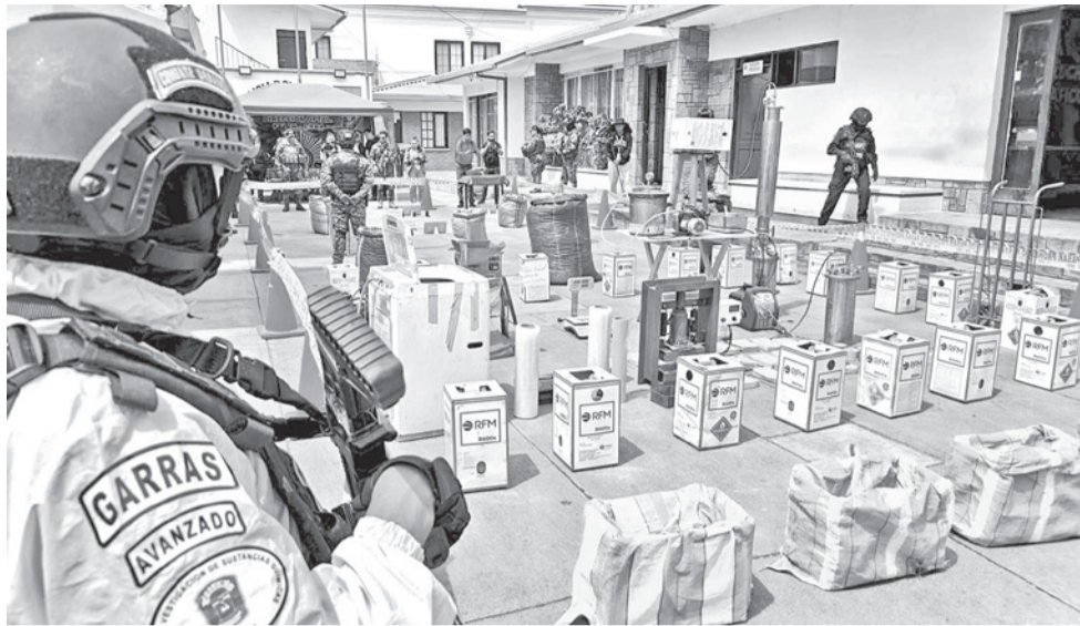
Felcn muestra las bolsas con marihuana y equipos del laboratorio de droga.