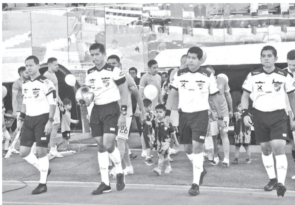
Un grupo de árbitros bolivianos.