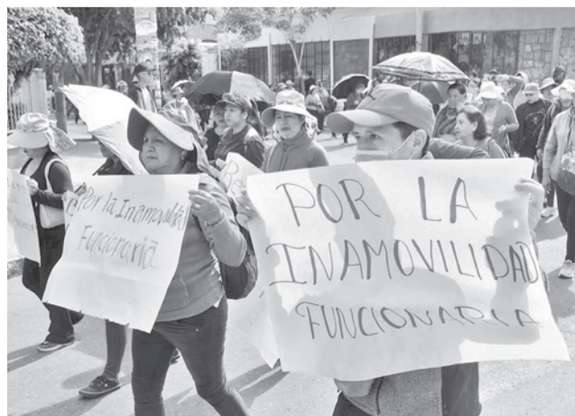
Marcha de los trabajadores en Salud en Cochabamba. C.L.

En el Hospital Materno Infantil la atención fue suspendida, pero con la diferencia que en este centro se atendieron a los pacientes que ya tenían citas programadas.