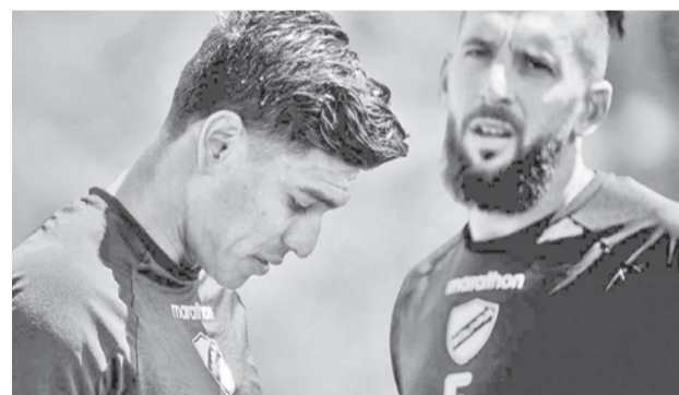
Los jugadores del club Bolívar. CLUB BOLIVAR

De acuerdo con los periodistas que acompañaron al Seleccionado Boliviano a México, está pendiente esa reunión evaluativa, aunque no precisaron fecha ni hora.