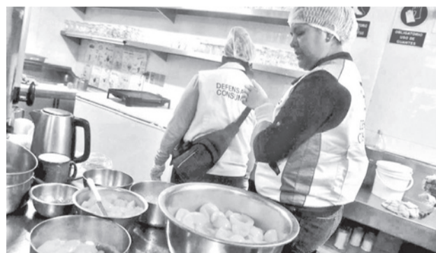
Intendencia inspecciona las heladerías.