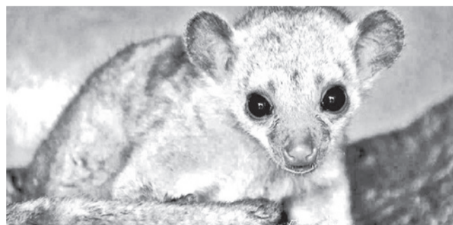
La martucha ( Potus flavus ) rescatada. CARLOS LÓPEZ

Medio ambiente. Se presume que el animal silvestre pariente de los mapaches fue traído con fines de tráfico ilegal y logró escapar