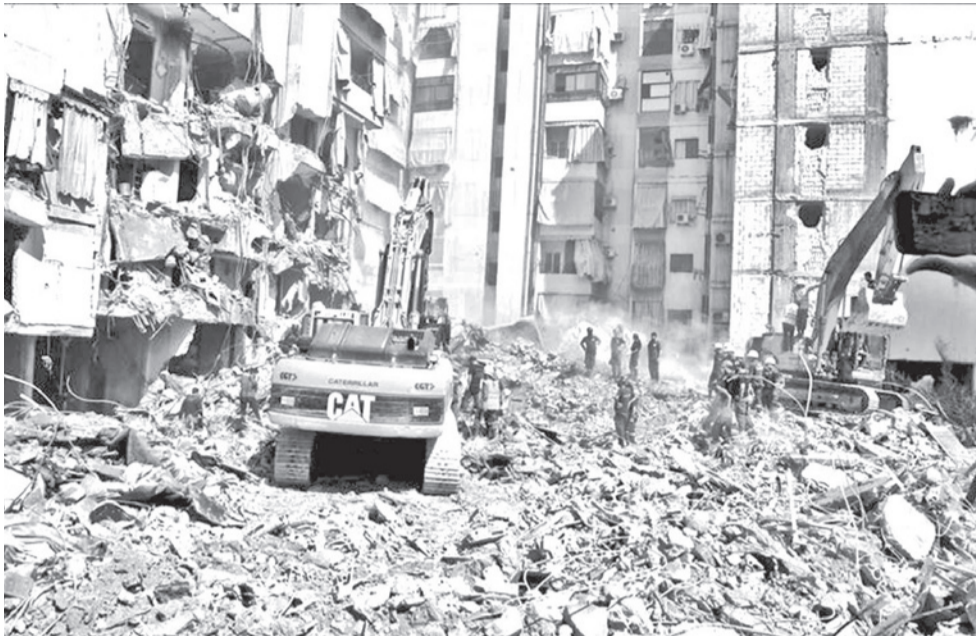
Edificios destruidos en Beirut tras ataques de fuerzas israelíes.