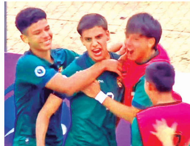
La Selección Sub-17 de Bolivia.

El seleccionador subrayó que para enfrentar a Argentina podrá disponer de todos los convocados.