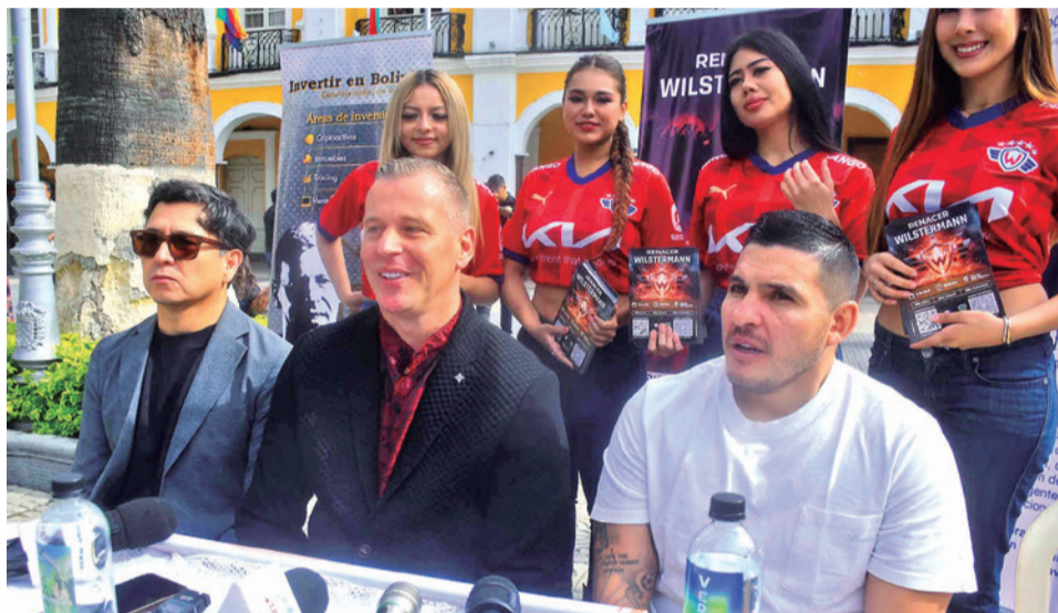
Müeller y Pochi plantean la “creación de un club de hinchas” en la plaza. JOSE ROCHA

La idea que tiene Müller es la “creación de un club de hinchas”, insistió, que cuente con personería jurídica en la cual se establezca que es una entidad sin fines de lucro. Esa