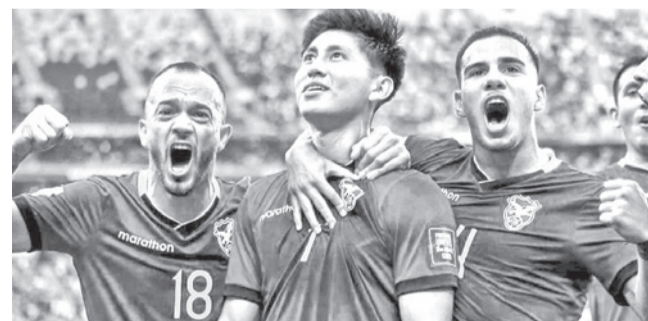
Los jugadores de la Verde. FBF

Plan. La FBF y el DT Óscar Villegas señaló que la Verde se prepara para la próxima eliminatoria al Mundial