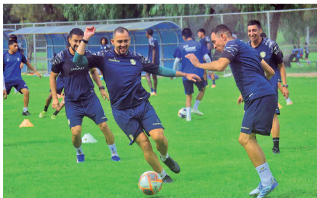
Un entrenamiento del club Aurora. CARLOS LÓPEZ

Rangel formó parte del club Llaneros, de Colombia, que todavía no envió el CTI, requisito para la actuación de cualquier futbolista., por lo que Aurora realiza gestiones ante la