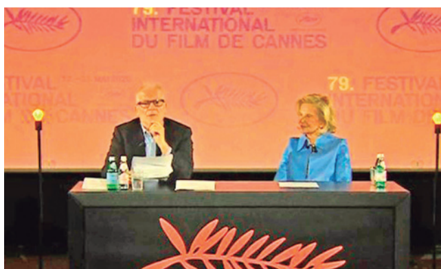
Películas. Los responsables del festival de Cannes. FESTIVAL DE CANNES

Pedro Almodóvar, Ron Howard, Steven Soderbergh, Andy García, Daniel Auteuil, John Travolta, László Nemes y Asghar Farhadi destacan entre los realizadores que prestigiarán la alfombra roja en el bulevar de la Croisette de la paradisíaca Costa Azul, en un evento señalado del 12 al 23 de mayo, aunque algunos