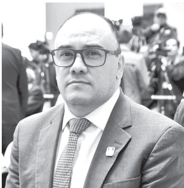
Gustavo Ávila, presidente del TSE. TSE

El reglamento también fija normas de conducta estrictas. Se prohíbe el uso de lengua-