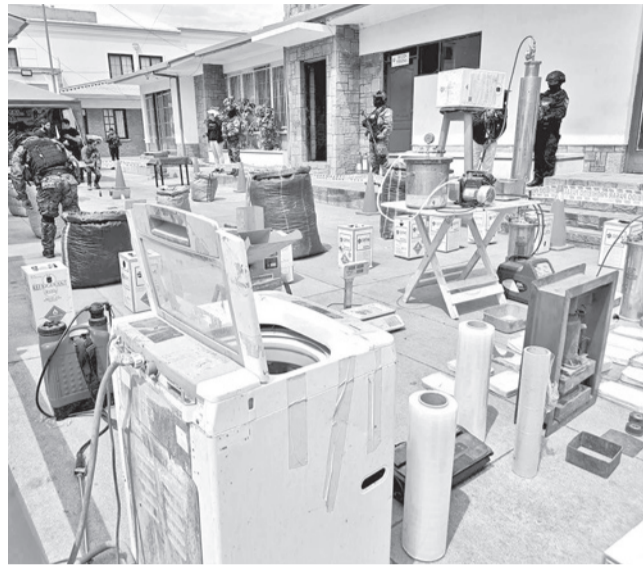
Parte de las piezas del laboratorio clandestino.