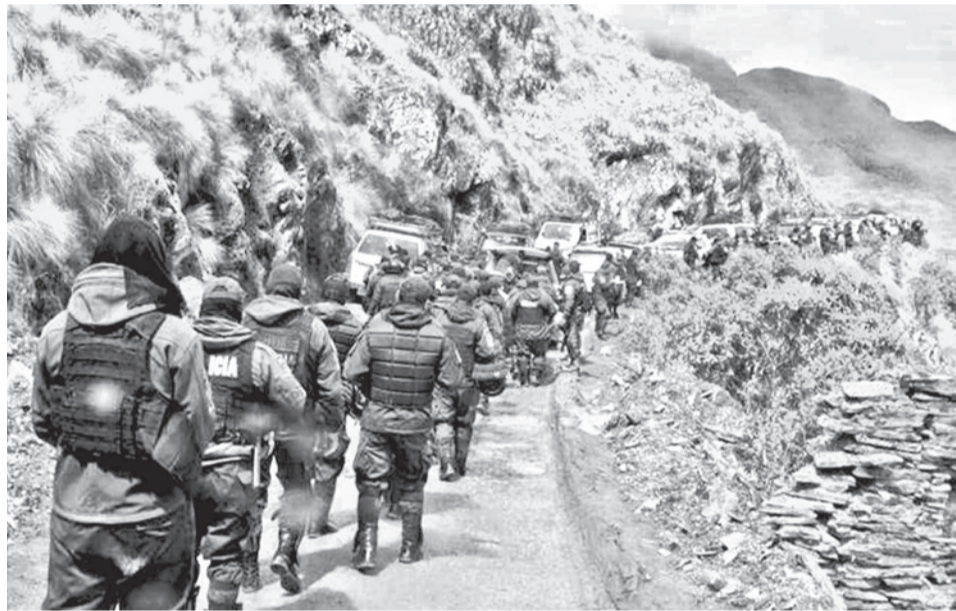
El conflicto por el avasallamiento de una empresa minera en Sorata. AJAM

La intervención, desarrollada en el marco de la Ley 535 de Minería y Metalurgia, contó con el apoyo de aproximadamente 350 efectivos de la Policía Boliviana, en una acción orientada a restituir el área minera conforme a derecho y