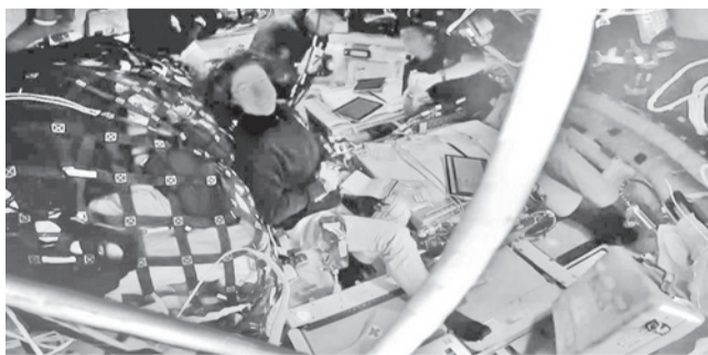
Los astronautas dentro de la nave Orión. NASA

Misión. NASA y Fuerzas Armadas de EEUU tienen planes de contingencia para el amerizaje de la nave Orión