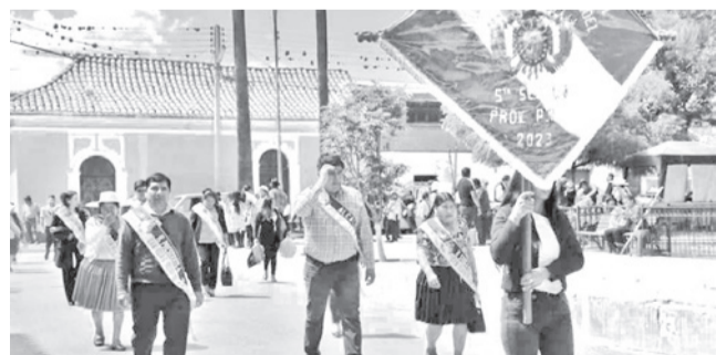
El desfile por el aniversario de Toco. GADC

Homenaje. El Gobernador junto con las autoridades participaron del desfile y la sesión de honor en el municipio del valle alto