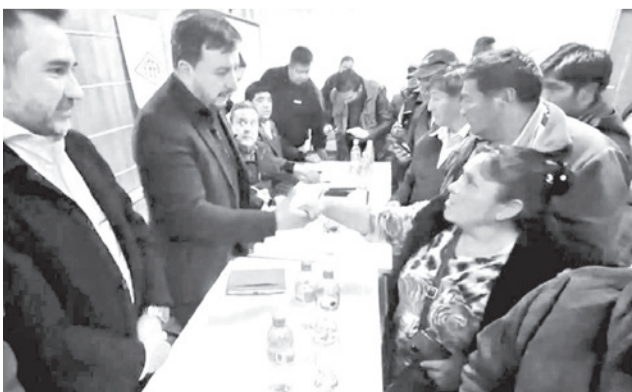
La firma del acuerdo con los choferes.

Las autoridades estatales firmaron un acta con los compromisos adquiridos luego de