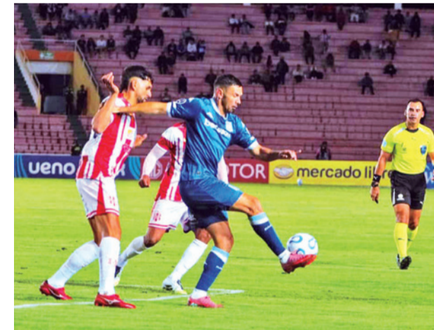
Independiente ante Racing, anoche.