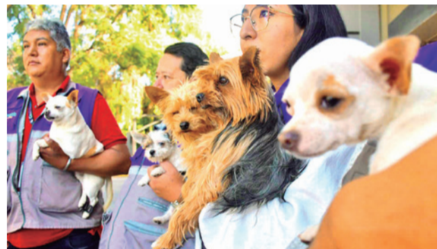
Canes rescatados en un criadero en Cala Cala.

“El Desafío Llajta Viva desde el 2019 ya está en Cochabamba impulsado por la Fundación Sanit y otros aliados para lograr que la población cuide la biodiversidad”, manifestó.