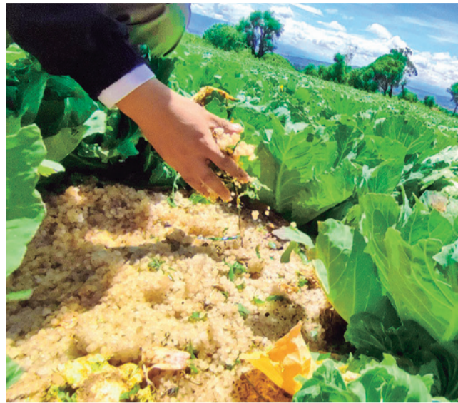
Los daños por las heladas en los valles. DANIEL JAMES