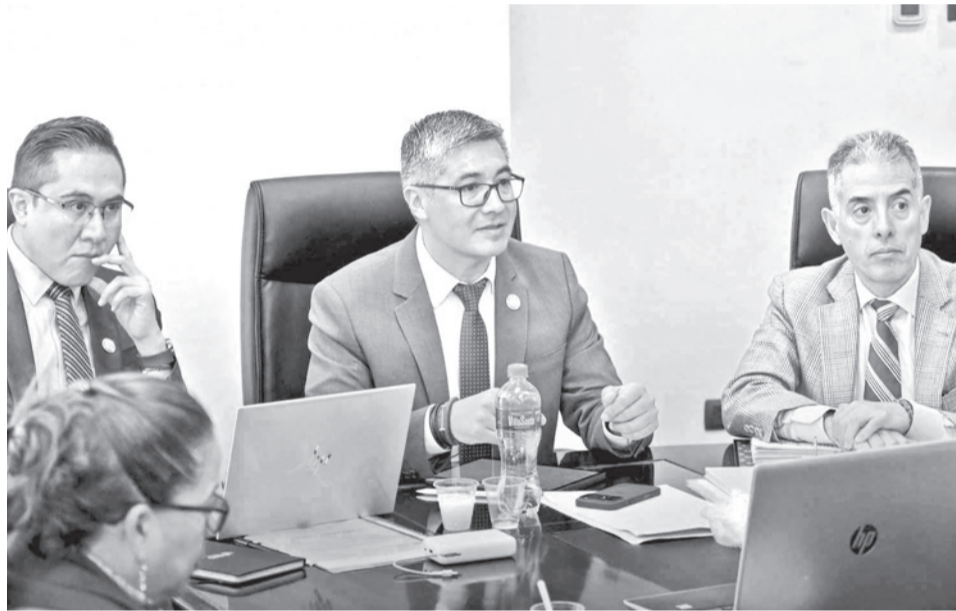
El ministro de Economía, José Gabriel Espinoza, en una reunión.

“Esto ha permitido que el sector financiero pueda comprar dólares en una cantidad suficiente para empezar a mantener un flujo de opera-