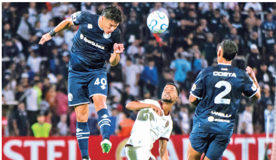
Incidentes del partido de Bolívar con Independiente de Rivadavia.