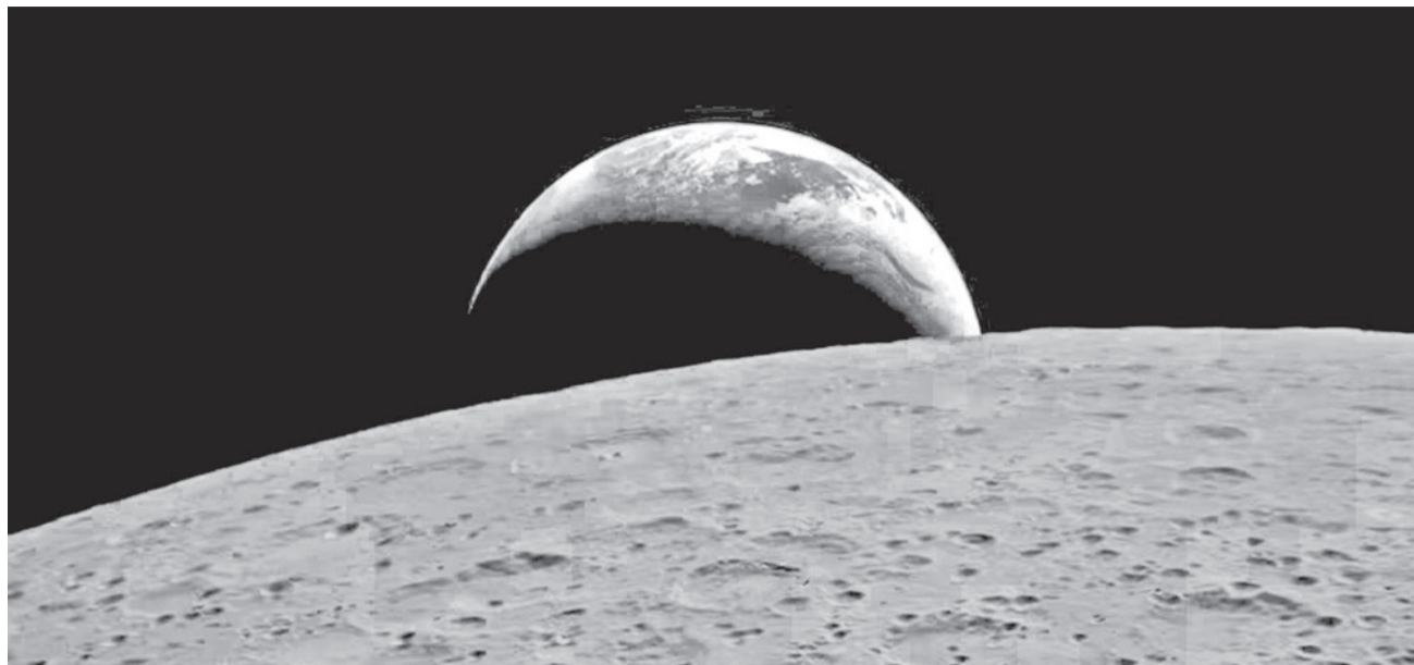
La imagen captada por la tripulación de Artemis II durante su recorrido por la cara oculta del satélite.

Más de 57 años después del célebre clic hecho por la mi-