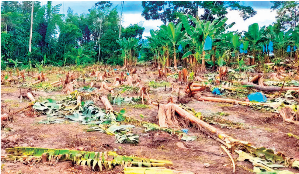
Los cultivos afectados por las inundaciones en el trópico.