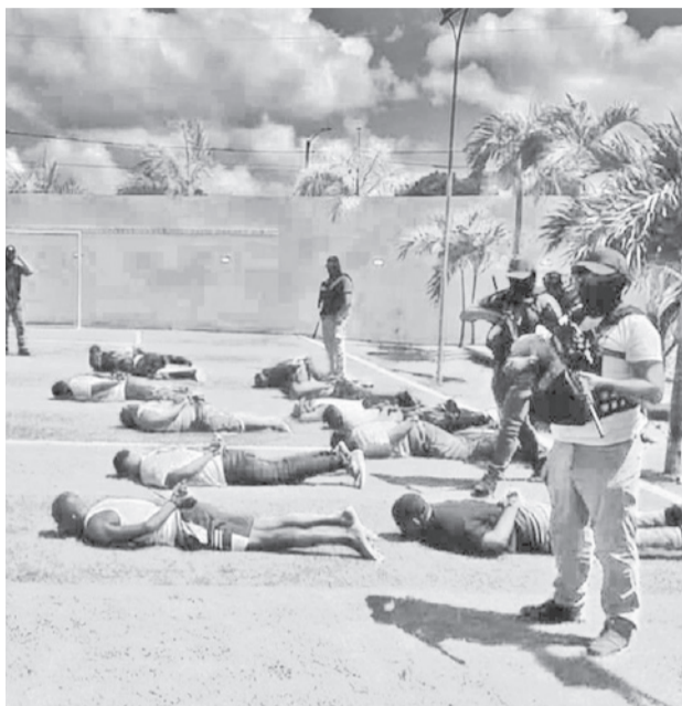
Los colombianos detenidos en el operativo.

Durante la fuga, los atacantes realizaron disparos para evitar la intervención.