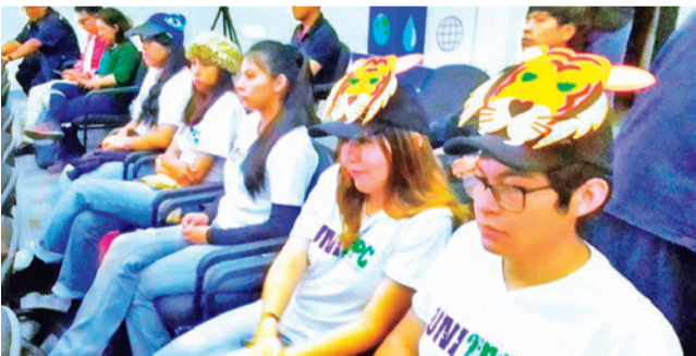
El lanzamiento de Llajta Viva 2026. GADC

Medio ambiente. El objetivo es que la población aprenda a cuidar y valorar la biodiversidad en todo el país