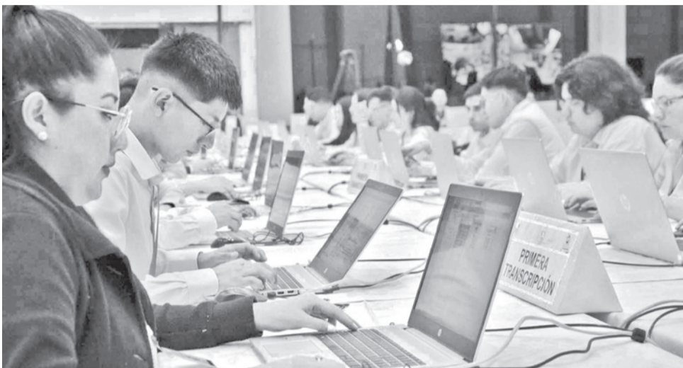
Integrantes del Tribunal Electoral Departamental en la jornada de conteo de votos. TED