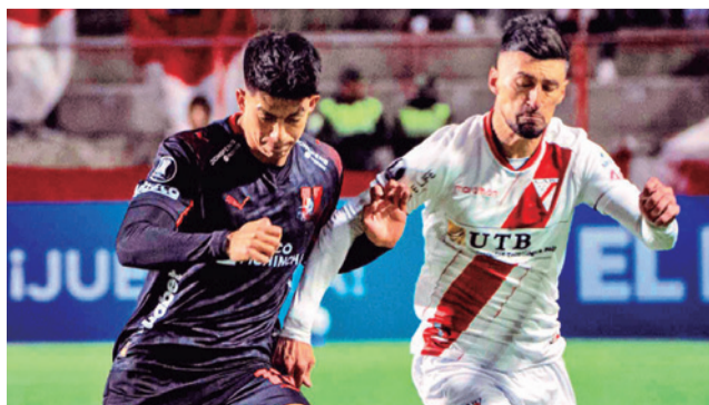
Incidentes entre Liga de Quito y Always Ready. CLUB ALWAYS READY

El cuadro de la banda roja se presentó oficialmente ayer por sexta vez en el torneo controlado por la Confederación Sudamericana de Fútbol, después de haberlo hecho en