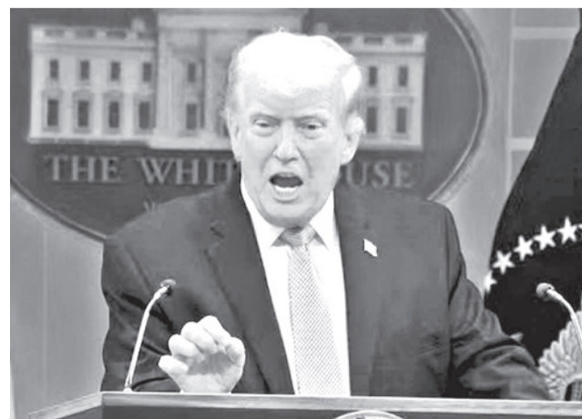
El presidente estadounidense, Donald Trump.

“He decidido suspender el bombardeo y el ataque contra Irán por un período de dos