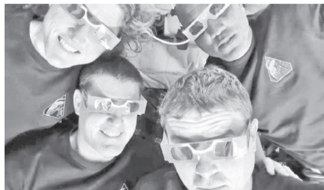
Los tripulantes con gafas para eclipses. NASA

Los cuatro astronautas de la misión Artemis II de la NASA alcanzaron el lunes un hito histórico al viajar más lejos que cualquier ser humano, al superar el récord de distancia para una misión tripulada con 406.771 kilómetros —por