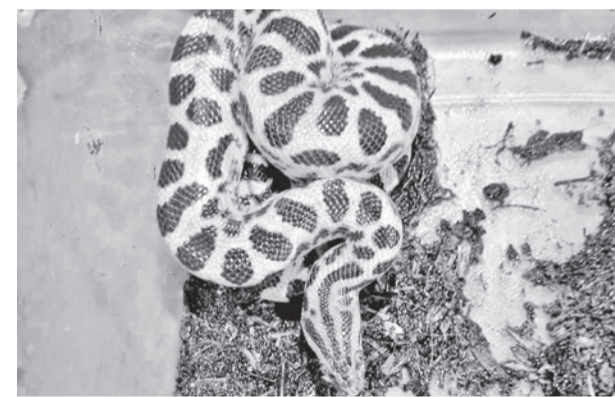
Uno de los animales silvestres rescatados.

Según la Policía, los especímenes estaban depositados en cajas de vidrio. Para Pofoma, la tenencia de estos reptiles responde a un interés estético o de lujo. Entre los animales en cautiverio estaba una anaconda bebé, que puede crecer varios metros.