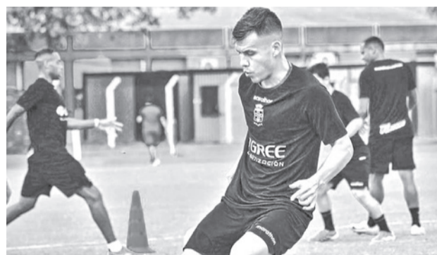
El entrenamiento de Blooming. CLUB BLOOMING

Los merengues presionaron ante su público y consiguieron descontar en el 74 con un golazo de zurada de Mbappé que estremeció las graderías, pero no pudieron firmar la remontada. Con este resultado, el conjunto alemán toma ventaja de cara al duelo de vuelta el próximo miércoles en Múnich y se acerca a su objetivo de avanzar a las semifinales y mantener viva la ilusión europea. Mientras que el Arsenal se impuso por 0-1 en Lisboa al Sporting de Portugal con un tanto de Kai Havertz en el minuto 91 que le acerca a las semifinales de la Liga.