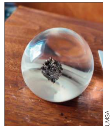
Un fragmento del suelo lunar.

En 1973 estos recuerdos fueron recibidos por el entonces presidente Hugo Banzer Suárez, quien dispuso su entrega a la UMSA, que desde entonces los conserva como parte de su patrimonio científico.