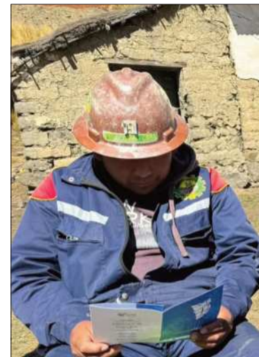
Trabajador minero lee una cartilla.

Este peso económico está respaldado por la dimensión operativa de la corporación, que cuenta con 5.718 trabajadores entre administración central, gerencias regionales, empresas filiales y unidades productivas. Se consolida así como actor clave en la generación de empleos en el país.