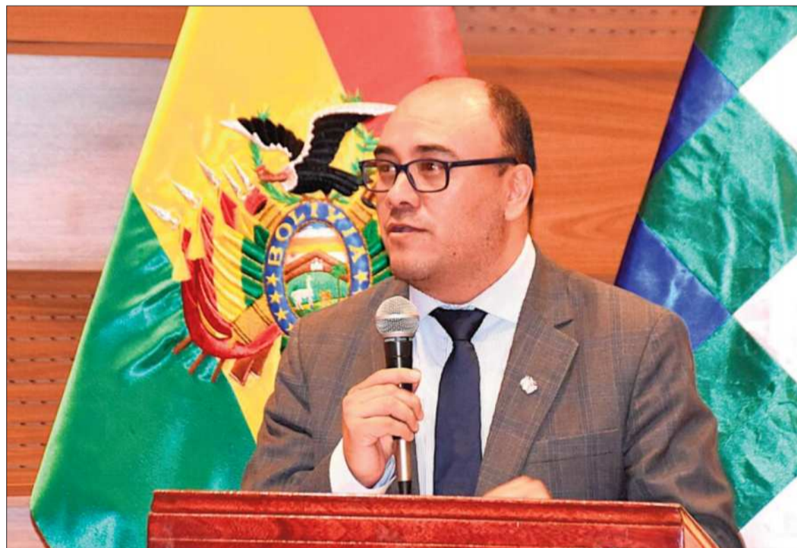
CITADO. El presidente del Tribunal Supremo Electoral, Gustavo Ávila, en una conferencia de prensa.

Sin embargo, pese a la restricción judicial, una red televisiva