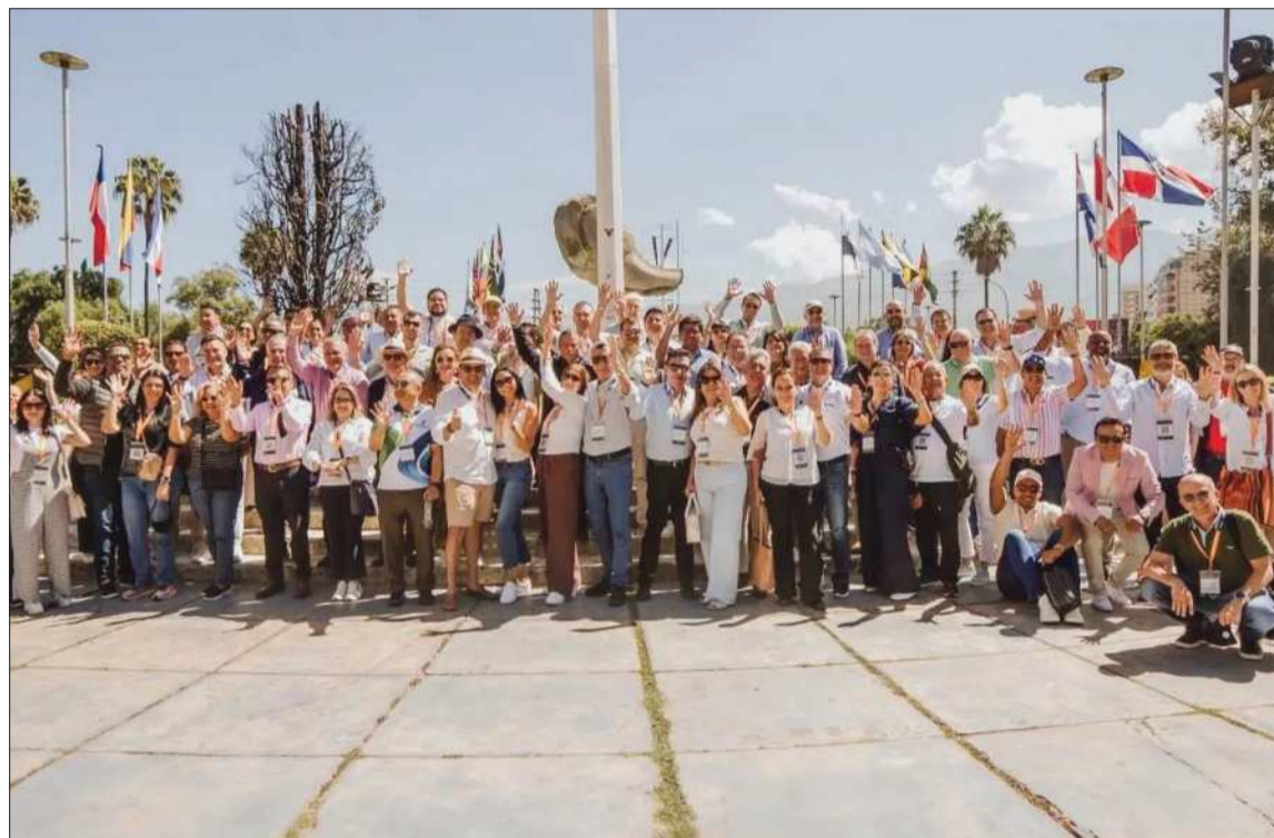
ENCUENTRO. Algunos de los empresarios que asistieron al evento en la ciudad de Cochabamba.