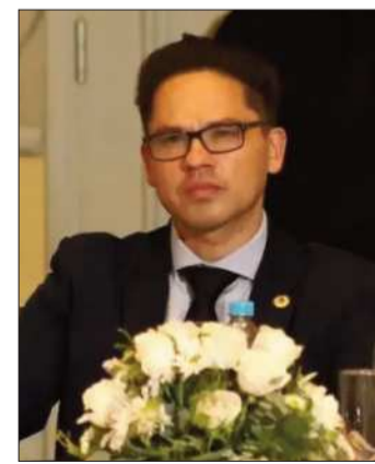
El presidente de la CNI.

Enfatizó que es necesario esperar el conteo oficial completo antes de dar por sentado cualquier escenario. “Algunos miles de votos pueden marcar la diferencia en una contienda tan reñida”, dijo.