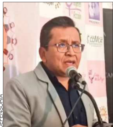
El Defensor del Pueblo.

Hubo denuncias de un recorte de presupuesto a varias instituciones