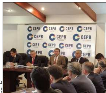
Una reunión del empresariado.

La CEPB recordó que ya el Gobierno determinó un incremento al salario