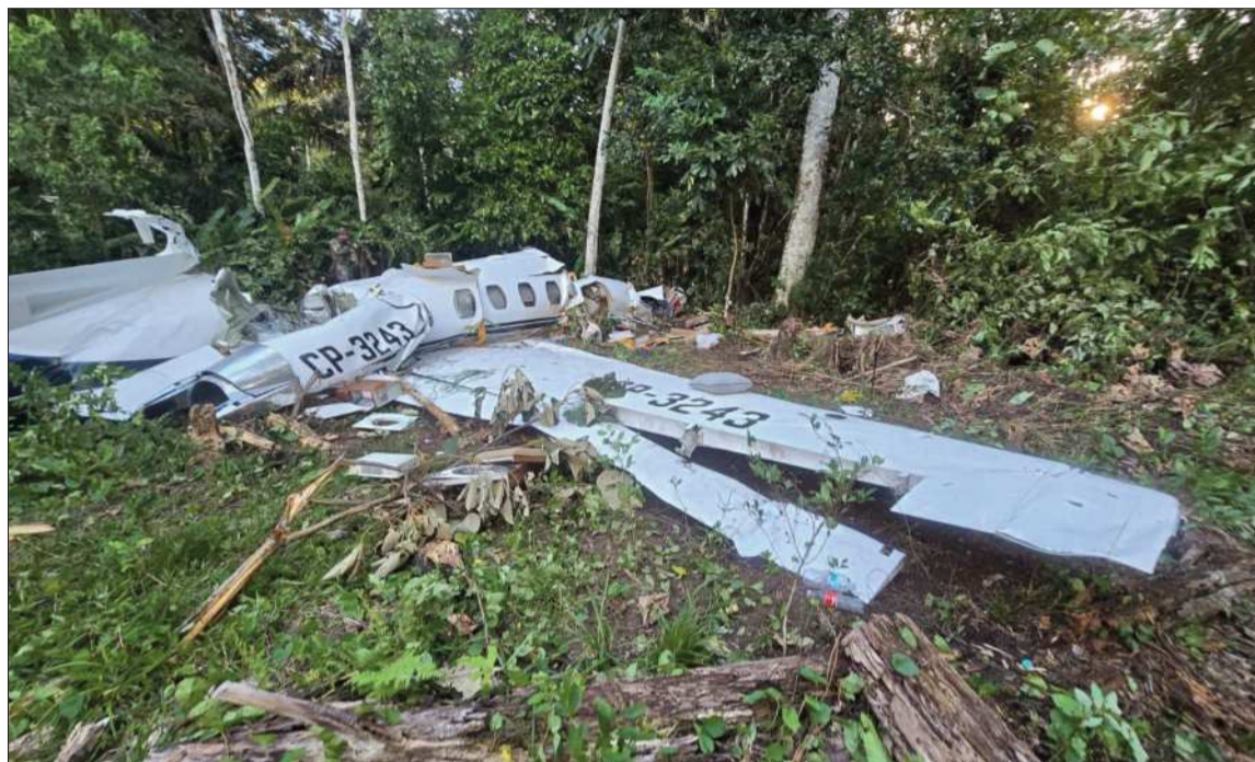
TRAGEDIA. La aeronave con registro CP-3243 quedó inutilizadas tras el siniestro ocurrido en el Trópico.

Tras el operativo de búsqueda desplegado en la zona del siniestro, el ministro de Obras Públicas, Mauricio Zamora, confirmó el fallecimiento de los dos pilotos de la aeronave. Equipos de rescate llegaron hasta el punto donde fue localizada la aeronave, luego de varias horas de rastreo aéreo realizado en un área de difícil acceso,