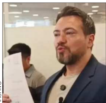
El legislador Alejandro Reyes.

El diputado Alejandro Reyes presentó una minuta de comunicación