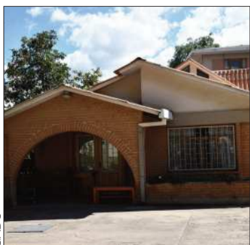
El Centro de Acogida 'Mi Hogar'.

La región es la segunda del país que tiene un lugar para atención a víctimas