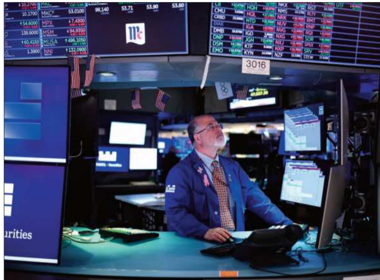
CIFRAS. Las bolsas cerraron al alza como efecto del bloqueo.