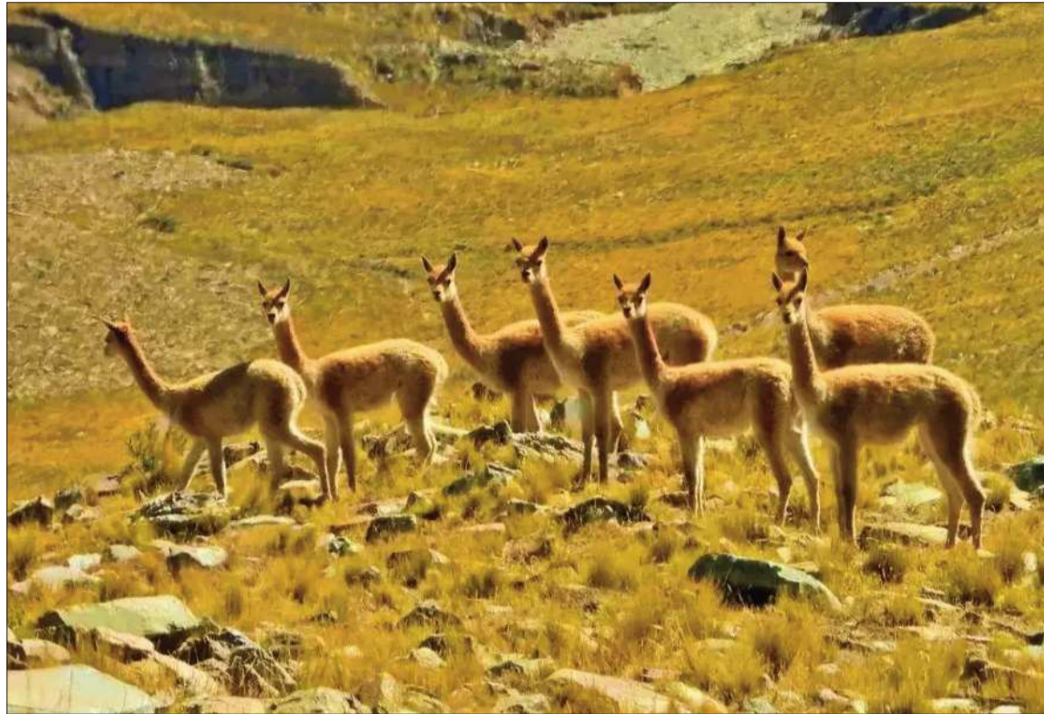
ESPECIE. Los camélidos tienen la fibra animal más fina del mundo y habitan en las zonas altas de Bolivia.

El proceso se realizará mediante metodologías de alta precisión técnica, incluyendo conteos directos y recorridos por transectos (línea o franja de longitud conocida que atraviesa el terreno), permitiendo a los especialistas y guardaparques registrar datos exactos sobre la distribución de la fauna y