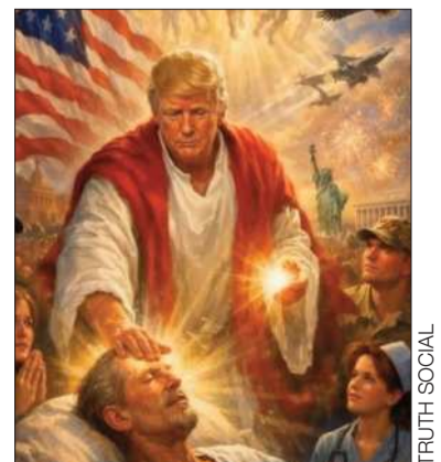
La imagen publicada.

"Tiene que retirar esto de inmediato y pedir perdón al pueblo estadounidense y luego a Dios", agregó. Trump ya ha utilizado imágenes religiosas antes. Durante su juicio por fraude bancario en el 2023, compartió un boceto en el que se lo veía junto a Jesús.