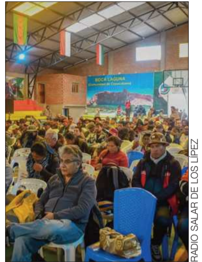
Participantes en Kolcha K, Potosí.

"No estamos planteando posiciones intransigentes ni intereses particulares; estamos hablando del pueblo potosino en su conjunto", aclaró el cívico de potosí.