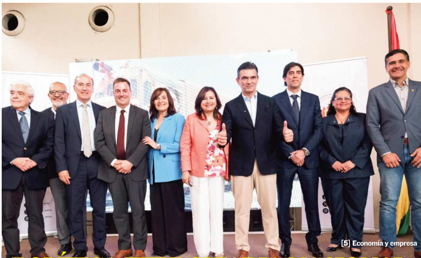
[5] Economía y empresa

► La cifra llega en plena transición económica