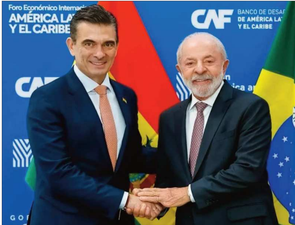
ALIANZA. Los presidentes Rodrigo Paz y Lula Da Silva, en un encuentro de organismos multilaterales.