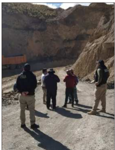
Operativo de la AJAM en Oruro

La inspección pudo evidenciar remoción reciente de tierra