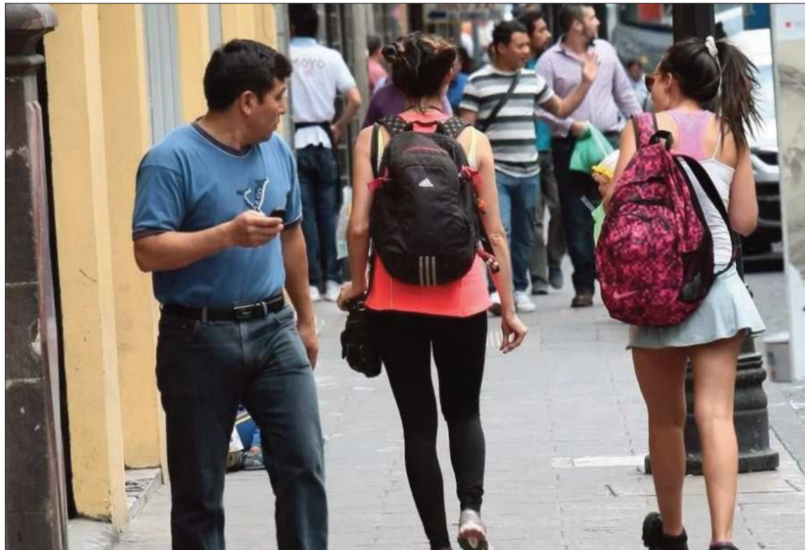
ACOSO. Autoridades municipales de Cochabamba buscan eliminar el acoso callejero o ‘piropos’.

La autoridad recordó que niñas, niños, adolescentes y jóvenes, tanto varones como mujeres, tienen el derecho de denunciar estos hechos en las oficinas del SLIM.