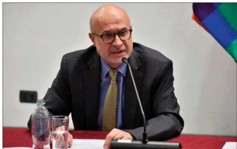
El ministro de la Presidencia, José Luis Lupo, en conferencia de prensa.

La Presidencia aclaró que los proyectos iniciados seguirán en ejecución