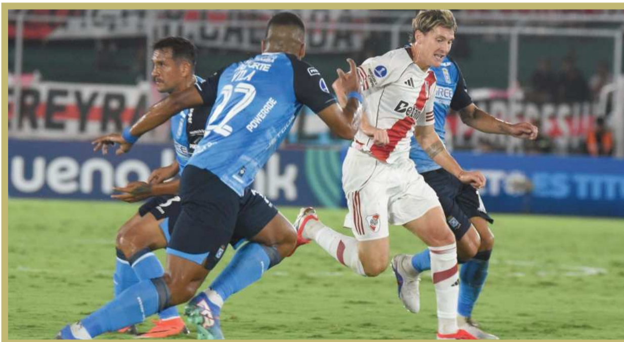
INCIDENCIA. Una acción del partido entre Blooming y River Plate anoche en el estadio Tahuichi Aguilera.

Con este triunfo, Bolivia suma cuatro puntos y se ubica en el segundo lugar del Grupo B, liderado por Brasil con seis unidades, mientras que Argentina tiene tres y Venezuela suma una.