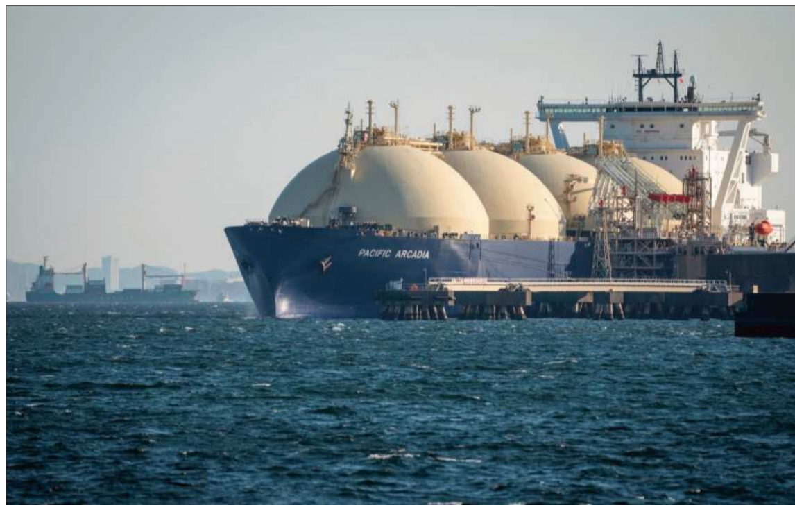
BENEFICIO. La apertura del estrecho de Ormuz es parte del acuerdo de alto el fuego.

Este era uno de los plan de 10 puntos que Irán propuso, según