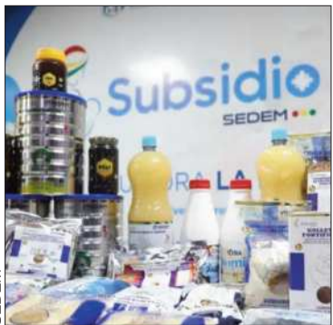
Productos del subsidio de lactancia.

La institución señaló que se realizó un ajuste en el contenido del paquete