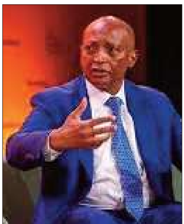
Patrice Motsepe, de la CAF.