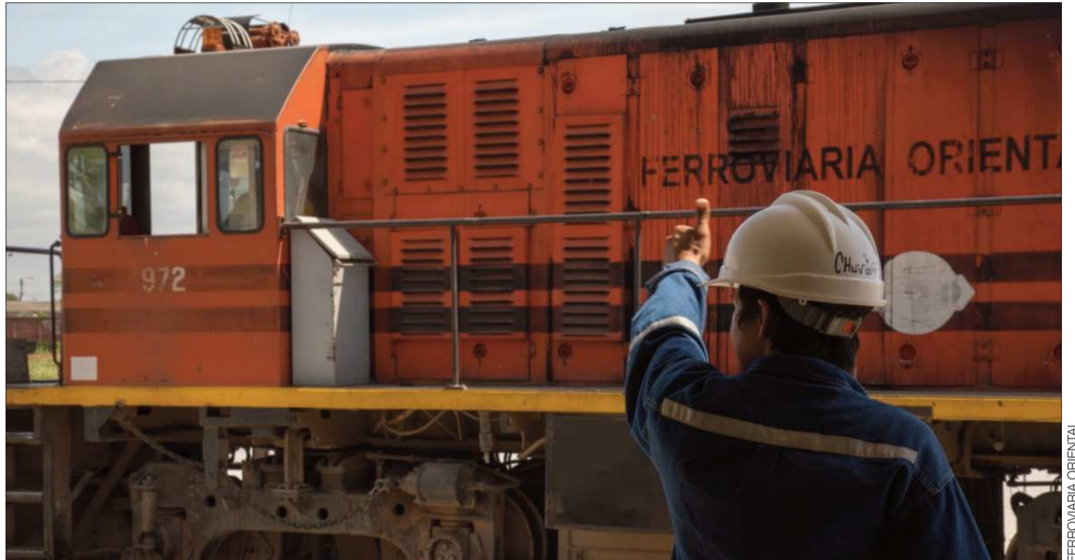
FERROCARRIL. Bolivia apunta a establecer una política nacional de transporte que permita al país consolidarse como eje integrador.

El mandatario advirtió además que el desafío no se agota en la infraestructura: establecer condiciones económicas y polí-