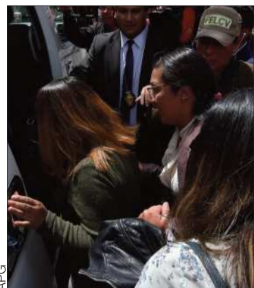
La funcionaria sale del hogar.

Se investiga el presunto maltrato contra un niño de seis años de edad.