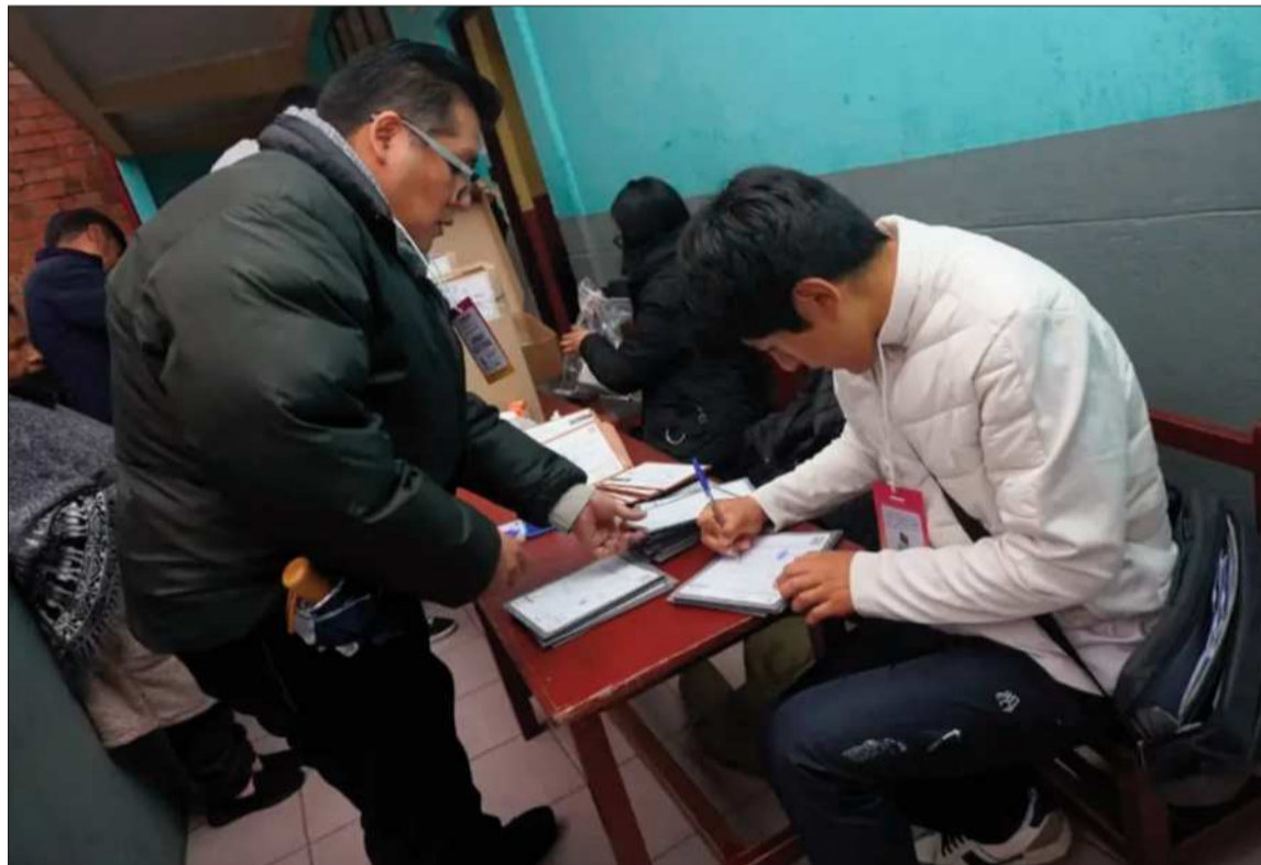
VOTACIÓN. Un ciudadano emite su voto en las elecciones del 22 de marzo de este año.

En Cochabamba también ya se definieron las autoridades subnacionales, pero la entrega de credenciales será en la misma fecha.