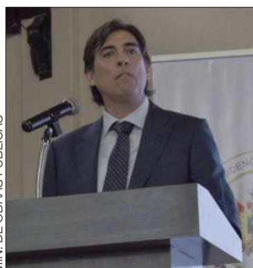
MIN. DE OBRAS PÚBLICAS