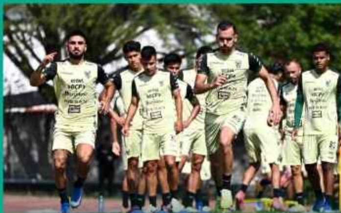
ABSOLUTA. Jugadores de la Verde antes del partido contra Irak.

Dirigentes de la Federación Boliviana de Fútbol (FBF) programaron siete partidos amistosos que jugará la Selección Nacional Absoluta durante esta temporada, en el inicio de su preparación para las eliminatorias sudamericanas del Mundial 2030.