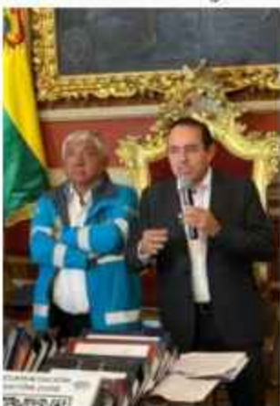
ACTO. Las dos autoridades, el viernes pasado.