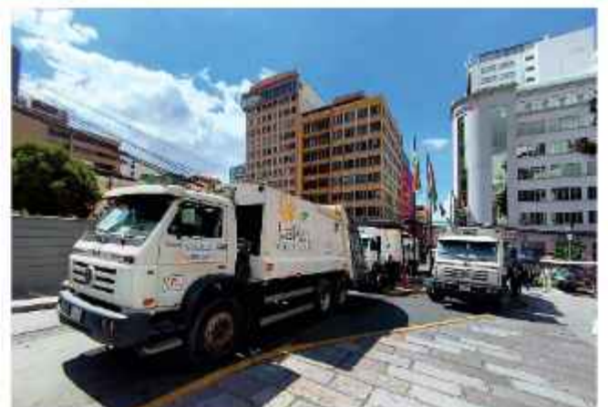
BLOQUEO. Camiones cierran el paso vehicular ante la Alcaldía.

Los trabajadores de aseo urbano anunciaron nuevas movilizaciones.