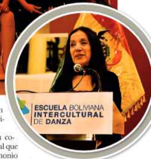
ESCUELA BOLIVIANA INTERCULTURAL DE DANZA

La danza boliviana, con su elegancia y tradición, ya no sólo se baila; ahora también se piensa, se estudia y se proyecta hacia el futuro.