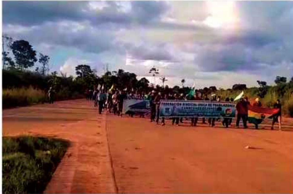
CAMPESINOS. Parte de la columna que marcha desde la población pandina de Porvenir.

La marcha que partió desde Pando hacia la sede del gobierno cumple su sexto día de movilización en medio de un escenario de alta tensión política y social.