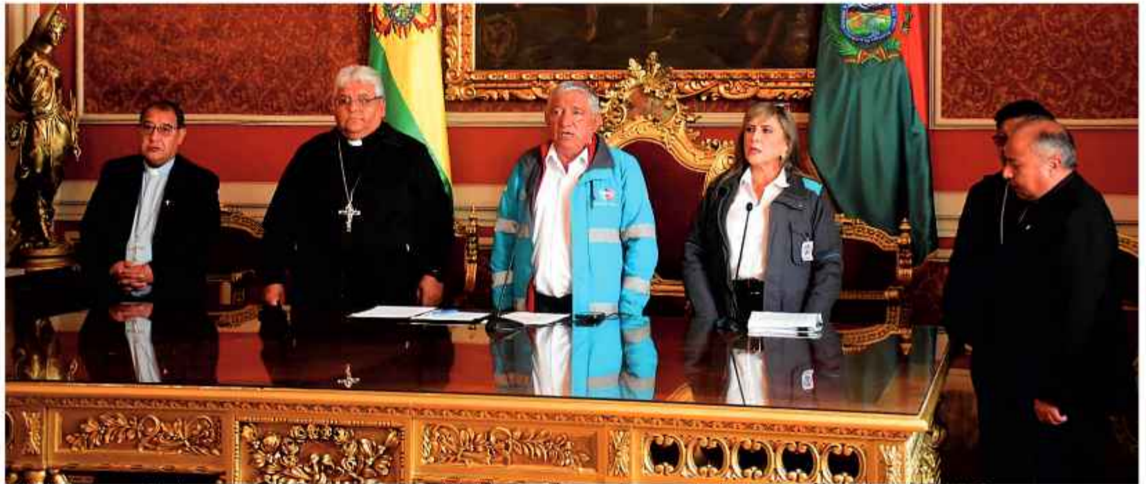
ANUNCIO. Las autoridades municipales y los representantes de la Iglesia católica estuvieron en el Palacio Consistorial de la ciudad de La Paz.