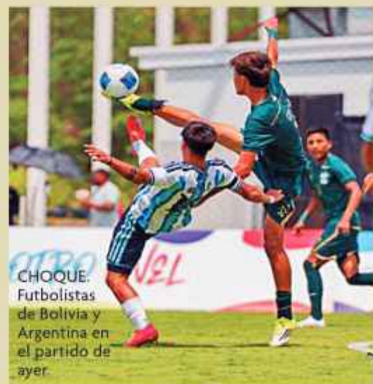
CHOQUE. Futbolistas de Bolivia y Argentina en el partido de ayer.