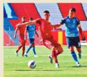
PARTIDO. Jugadores de Totorá y Blooming disputan el balón.