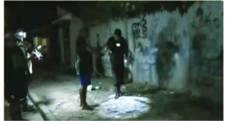
TIROTEO. El hecho ocurrió cerca de la radial 26, Santa Cruz de la Sierra.

Otro hecho de violencia ocurrió en la comunidad Río Blanco, municipio de Entre Ríos en el trópico de Cochabamba también la noche del sábado donde un hombre de 41 años perdió la vida tras haber sido atacado por un grupo de desconocidos quienes llegaron al lugar e intentaron secuestrarlo por la fuerza, pero el hombre se resistió. Tras el crimen, los delincuentes abordaron una vagoneta de marca Toyota y abandonaron el lugar, según la declaración de la esposa del ahora fallecido.