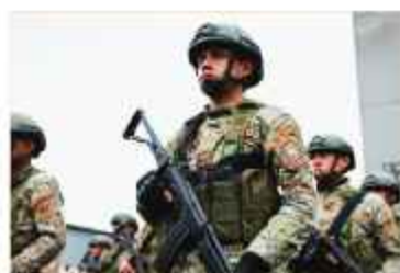
DESPLIEGUE. Militares peruanos desplegados en la norteña región

El Gobierno señaló que esta medida busca fortalecer la seguridad, garantizar el Estado de Derecho y proteger a la población frente a las amenazas derivadas de la minería ilegal, mediante una intervención articulada y sostenida en los distritos comprendidos en la declaratoria. XINHUA