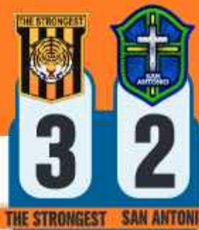
THE STRONGEST SAN ANTONIO