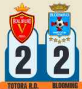
TOTORA R.O. BLOOMING