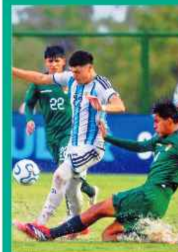
LLUVIA. Los charcos en el escenario deportivo fueron evidentes.