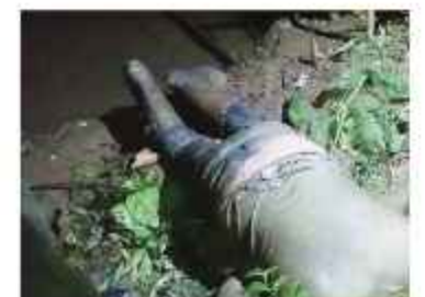
CADÁVER. El cuerpo fue arrastrado por el río La Paz, en Sapecho.