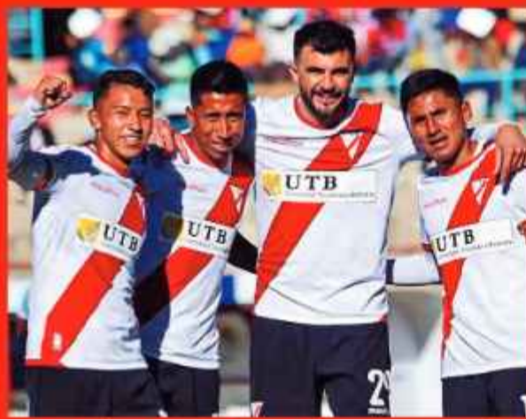
EQUIPO. Always Ready buscará el bicampeonato en la Liga de la División Profesional.

Always Ready festejará mañana su nonagésimo tercer aniversario de fundación con el orgullo de ser el actual campeón nacional. Uno de sus objetivos es buscar el bicampeonato, que sería algo inédito en su historia en la principal división del fútbol boliviano.