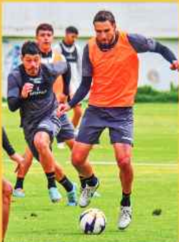
TRABAJO. El plantel en su último entrenamiento antes del partido.