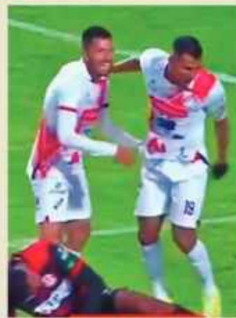
INCIDENCIA. Jugadores festejan el gol.