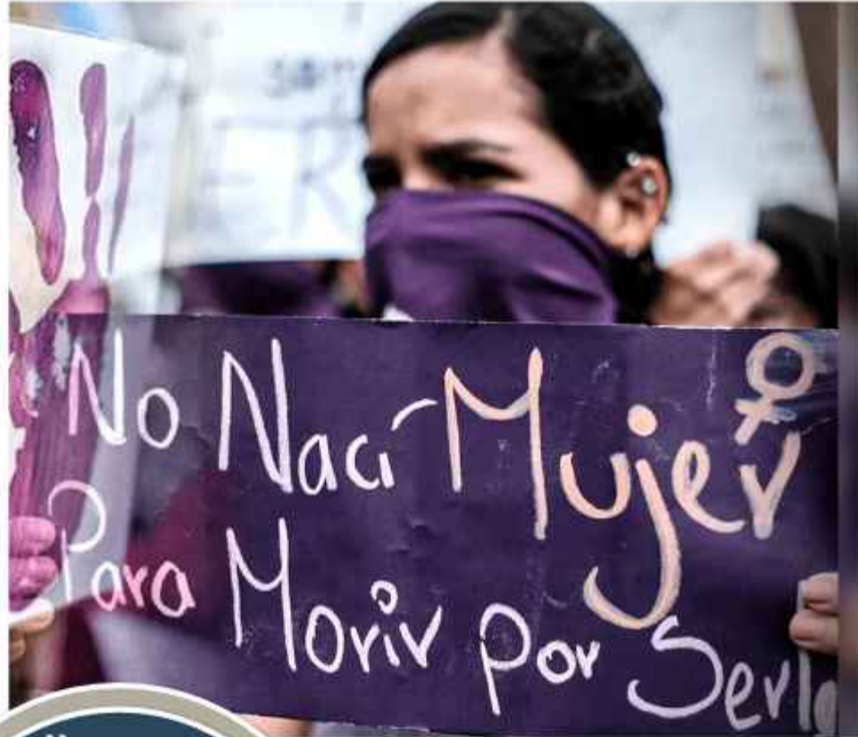
VIOLENCIA. La imagen sólo es referencial de la nota.

La víctima, de 35 años, recibió al menos tres impactos de bala localizados en sus extremidades inferiores,