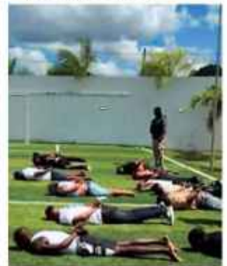
CAPTURA. Los extranjeros tras su aprehensión.

En total, quedaron aprehendidas 13 personas, 11 de nacionalidad colombiana y dos bolivianas, después de la refriega.