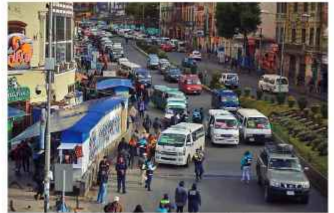
MEDIDAS. Los transportistas están en estado de emergencia.