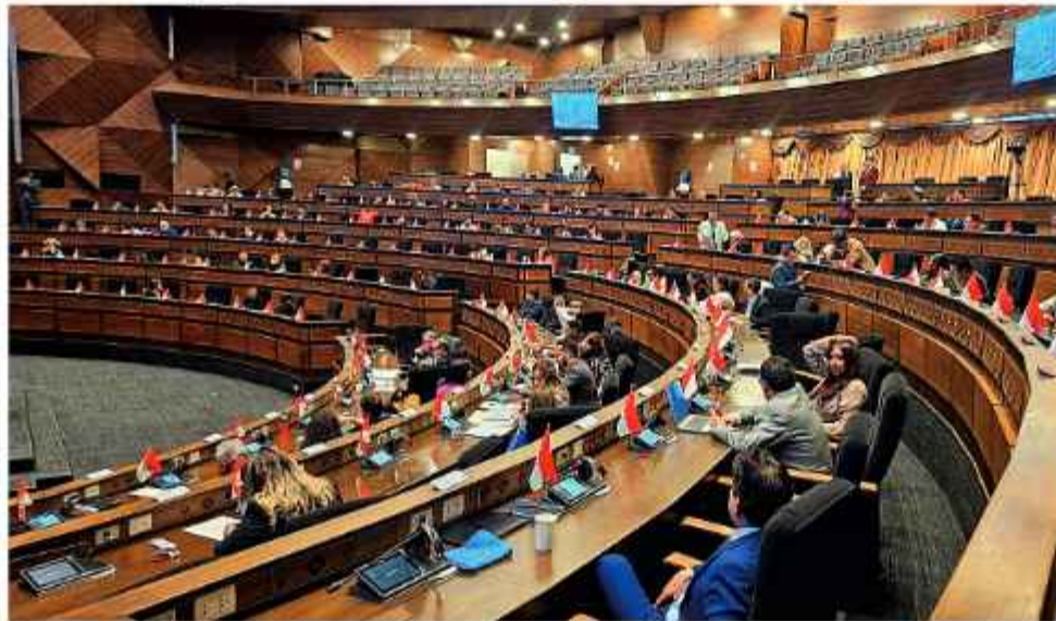
LEGISLADORES. La sesión convocada por el vicepresidente Edmand Lara avanzó poco.