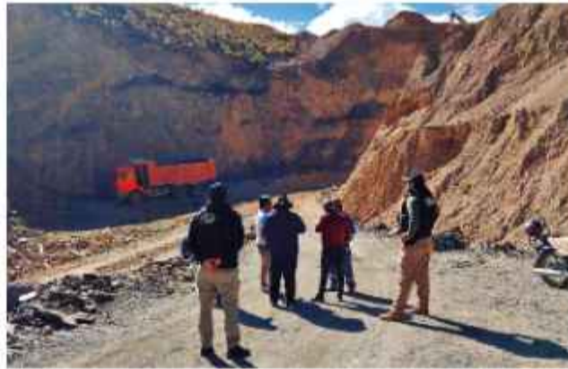
ORURO. Inspección a una mina por funcionarios de la AJAM.

"Teníamos un río hermoso con peces, ahora todo está destruido por la minería ilegal", se lamentó el dirigente, quien inició una huelga de hambre tras dar un ultimá-