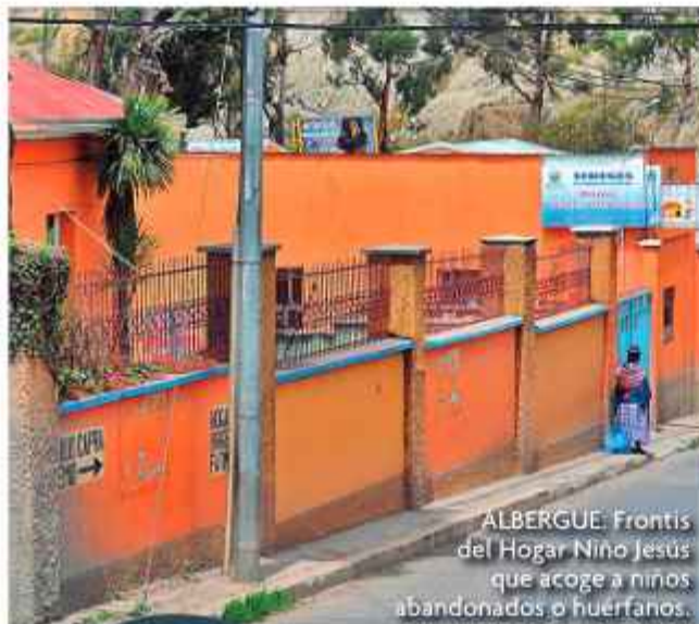
ALBERGUE: Frontis del Hogar Niño Jesús que acoge a niños abandonados o huérfanos.