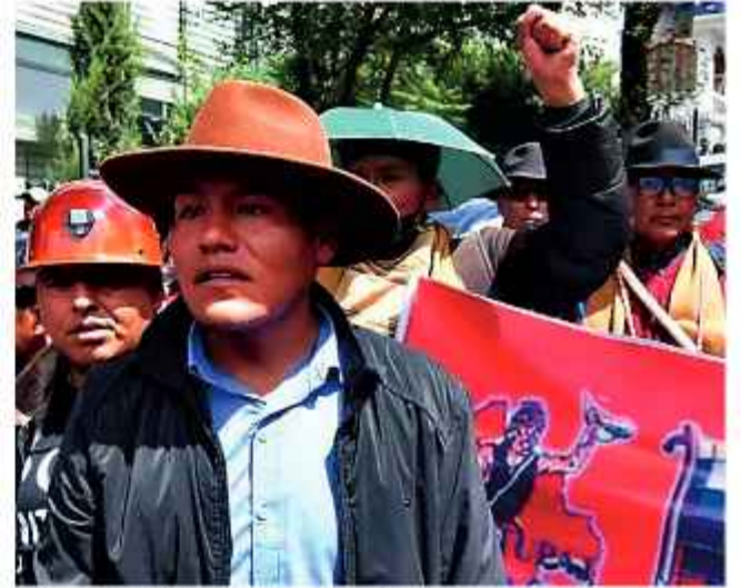
EXCANDIDATO. El excandidato encabeza la movilización.

Pese a este escenario, el TSE mantiene su postura firme en el respeto a los resultados oficiales. Su argumento sostiene que no existe base legal para un balotaje fuera de los márgenes de la Ley de Régimen Electoral. El ente ratificó su autonomía, rechazó cualquier medida de coacción e instó a los sectores sociales a que utilicen exclusivamente los recursos jurídicos para sus reclamos.