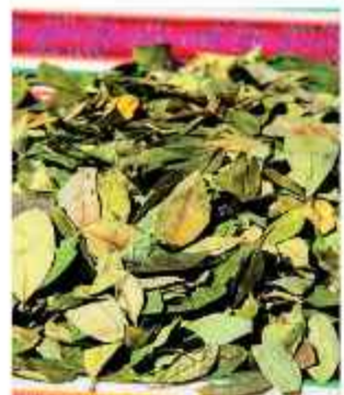
RECURSO. La hoja de coca.

El presidente Rodrigo Paz hizo un llamado a los productores de la hoja de coca de La Paz para que transformen el sector. Su objetivo es que se enfoquen en la generación de "negocios reales" y oportunidades económicas tangibles para los bolivianos.