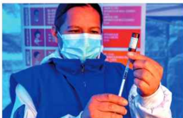
DOSIS. Una enfermera manipula la vacuna contra el sarampión.

Con estas acciones, el Estado busca blindar el acceso a este recurso estratégico y evitar crisis de desabastecimiento y al promover el desarrollo agrícola en las comunidades que se encuentran al pie de las montañas para integrar las necesidades urbanas y rurales en un plan de gestión eficiente y sostenible.