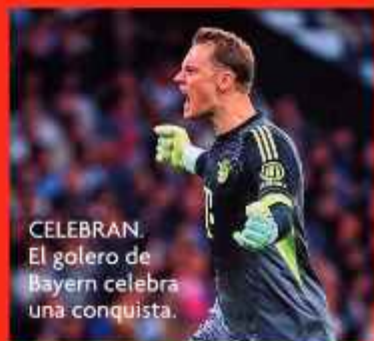
CELEBRAN. El golero de Bayern celebra una conquista.

Mientras que, también ayer el Arsenal se impuso por 0-1 en Lisboa al Sporting de Portugal con un tanto de Kai Havertz en el minuto 91 que le acerca a las semifinales de la Liga de Campeones, en una eliminatoria que se decidirá en Londres. AGENCIAS