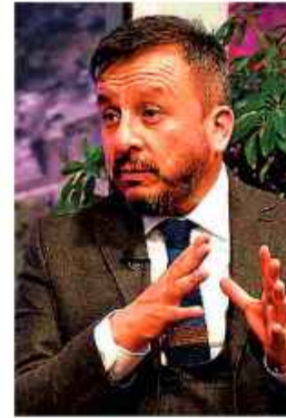
DETALLE. Buscan alejar a Medinaceli del cargo.

Si tenemos dos tercios corre la censura correspondiente y después, la remoción del Ministro.