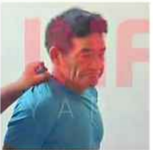
ASESINO. Confesó el crimen y fue condenado.

Los restos de la víctima fueron velados por sus familiares y fue enterrada en el cementerio del mismo municipio el lunes 6.