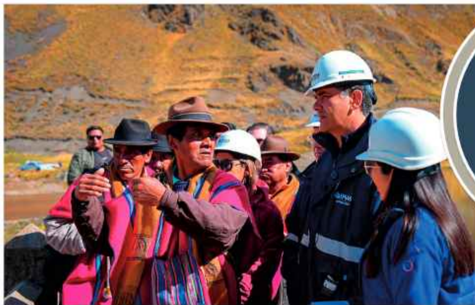
INSPECCIÓN. Autoridades del Ministerio escuchan a los comunarios de Hampaturi.

Con este panorama, la disponibilidad del recurso para el consumo humano y el sistema de riego está asegurado hasta la próxi-