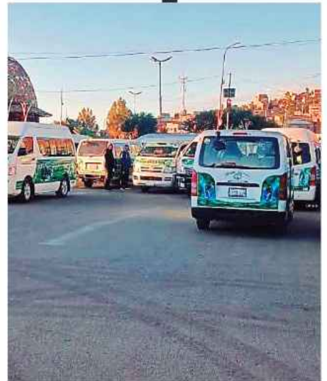
CIERRE. Movilización de los transportistas orureños.

Luego de sostener ayer una serie de reuniones entre los dirigentes de los choferes de Oruro y las autoridades de Gobierno, se logró un acuerdo para levantar el paro y el bloqueo en ese departamento. Se hizo el compromiso de distribuir gasolina de buena calidad y cumplir el resarcimiento económico, además el Gobierno garantizó su abastecimiento. Los dirigentes y las autoridades estuvieron en diferentes estaciones de servicio para verificar la calidad de los productos que, según se comprobó, es adecuada en Oruro.