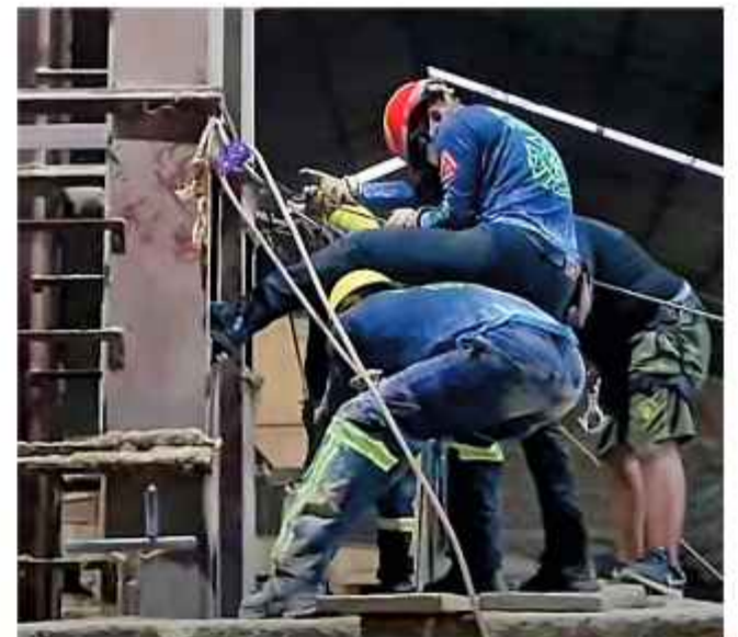
RESCATE. Voluntarios ayudan en el rescate de los cuerpos.

Uno de los paramédicos explicó que se tuvo que asistir a los bomberos voluntarios con oxígeno para las tareas de rescate "porque ahí no se puede ni respirar", lo que refuerza la teoría de la asfixia.