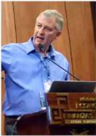
PERFIL. El Senador prometió trabajo prolijo.