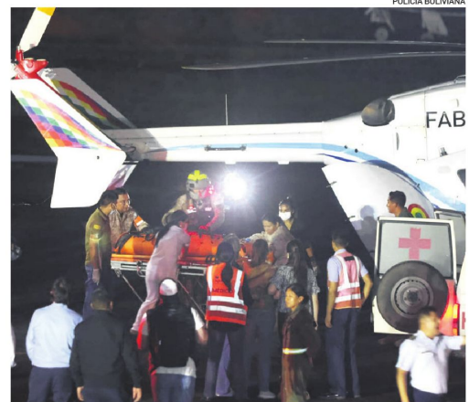
Los familiares recibieron los cuerpos anoche en El Trompillo

La llegada de los féretros a la capital cruceña estuvo acompañada por familiares, allegados y colegas del sector aeronáutico, que aguardaban noticias desde las primeras horas del día. La escena estuvo marcada por el silencio, los