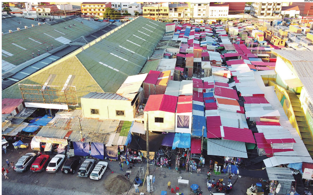
El predio, que abarca casi cinco hectáreas, fue otorgado en concesión por el Gobierno Municipal a los comerciantes