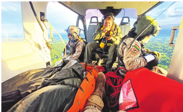
Rescatistas de la Fuerza Aérea consiguieron llegar en helicóptero hasta el sitio de la tragedia

lograr restablecer contacto con las dependencias de control.