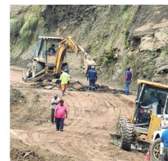
Los trabajos en la ruta a los valles

Mientras que para el miércoles se prevé el ingreso de un sur leve, con precipitaciones de moderadas a fuertes en todo el departamento. Esta situación persistirá hasta el jueves.