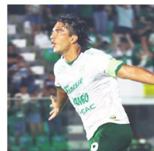
El goleador de Oriente Petrolero.

El próximo partido de Oriente es el 22 de abril ante Always Ready en Villa Ingenio (15:00).