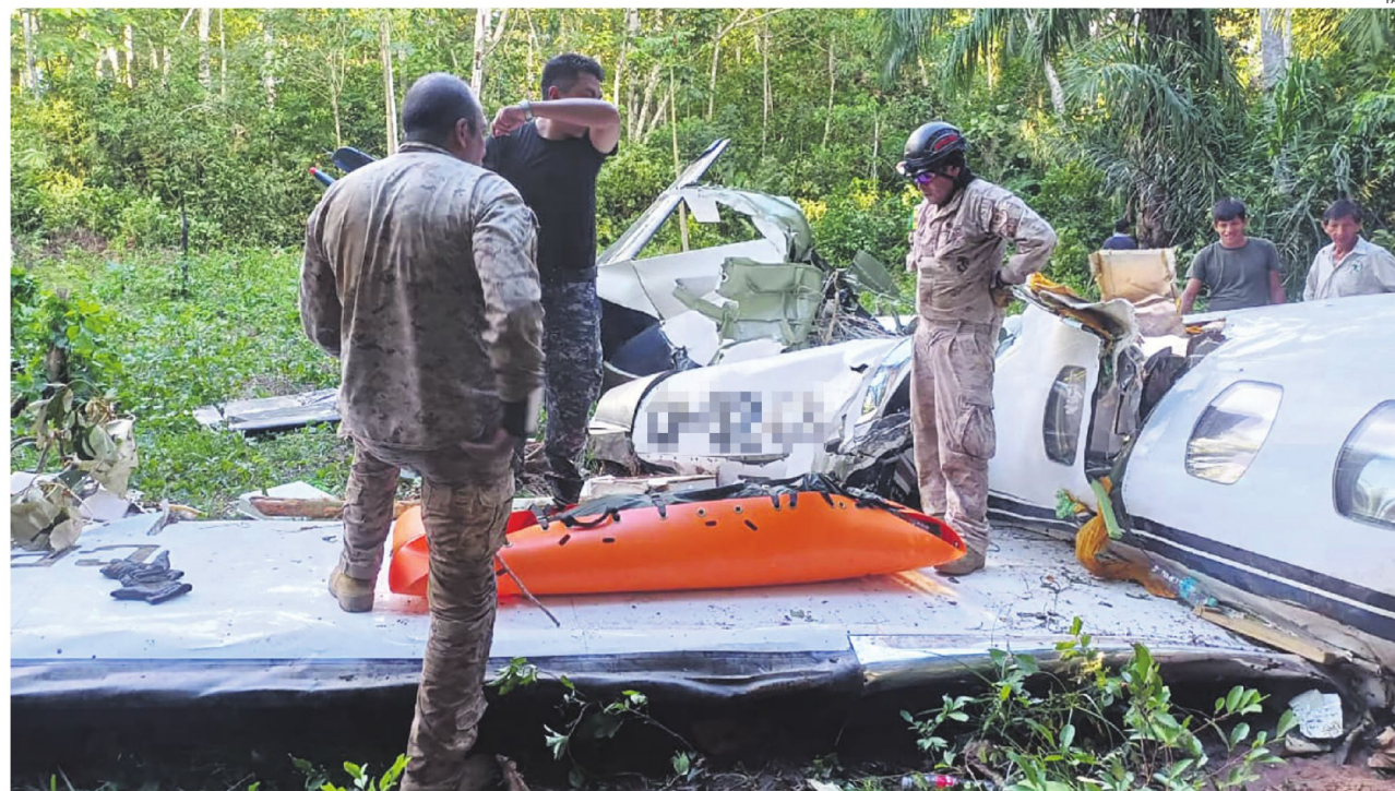
FATALIDAD. La aeronave siniestrada y los cuerpos de los pilotos fueron encontrados tras varios sobrevuelos, en un área de difícil acceso por tierra en Cochabamba

partamento de Cochabamba. Investigan las causas del infortunio. Una de las hipótesis es una pérdida de oxígeno en la cabina. A2-3