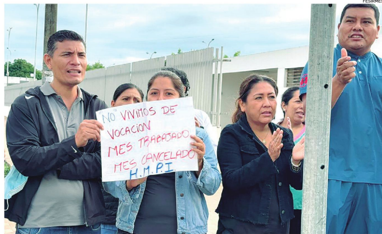
Entre sus demandas están el pago de salud y mejores condiciones para realizar su trabajo