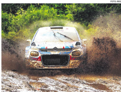
El piloto boliviano quedó en el primer lugar a bordo de su vehículo Citroën en Argentina.

La carrera se puso en marcha a las 14.15 en la PE1 Piedra Pintada-Paso Fátima de 7 kilómetros, en un día nublado (20°C) que comenzó a descargar una