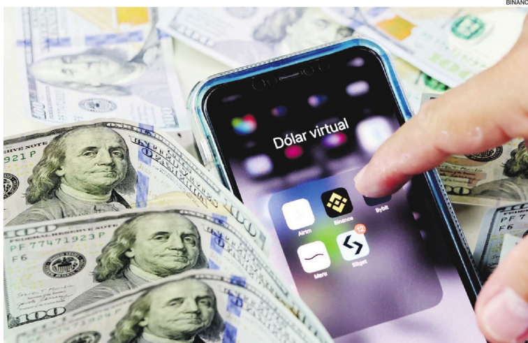
El USDT es uno de los tipos de dólar digital más usados en el país, ante la escasez de la divisa.

"El USDT es el dólar Tether, que es un token de criptomonedas.