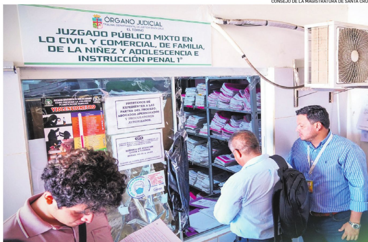
La Unidad de Transparencia del Consejo de la Magistratura en Santa Cruz llega al Juzgado de El Torno

Dicho ello, ayer la Unidad de Control y Fiscalización del Consejo Distrital de la Magistratura de Santa Cruz llegó hasta oficinas del Juzgado público mixto civil y comercial, de familia, niñez y adolescencia e instrucción penal 1° del municipio de El Torno, donde los funcionarios de la Magistratura revisaron los documentos de dicha solicitud de acción popular y también interrogaron a los fun-