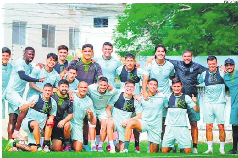
Los refineros pasan por una levantada anímica luego de la victoria del fin de semana ante GV San José por la División Profesional.

Factores cercanas a la institución confirmaron la existencia de la deuda y señalaron que el problema se arrastra desde gestiones anteriores. En ese contexto, apuntaron a la admi-