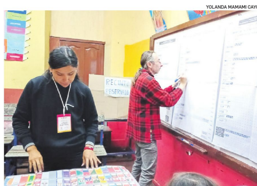
Cómputo electoral en una mesa de sufragio, Fue el 22 de marzo

Ávila tiene la certeza de que se emitirán los resultados más temprano de lo previsto debido a dos factores clave: la segunda vuel-