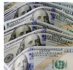
La referencia la fija el BCB

pación del Banco Unión, que se consolidó como el principal comprador de dólares, concentrando el 33% del total de las operaciones del sistema. La entidad realizó 16 transacciones adquiriendo divisas a un tipo de cambio de Bs 9,60, nivel que presionó al alza la cotización referencial.