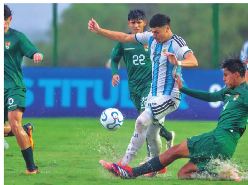
La Verde buscará clasificarse ante Chile para el próximo Mundial de la categoría sub 17.

El juvenil de 16 años es el máximo anotador del campeonato. Marcó cuatro goles en la misma cantidad de partidos, por lo que las esperanzas bolivianas están centradas en lo que pue-