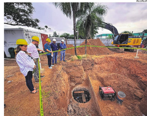
Comenzó la construcción de un viaducto en la zona oeste

En febrero se dio el orden de proceder. Las autoridades señalan que se coordinan los desvíos