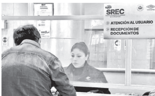
Atención en ventanillas del SREC. YPFB

La estatal petrolera informó que se continúa trabajando en la revisión de los casos