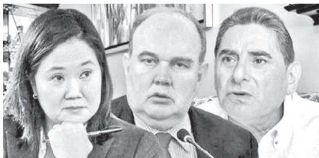
Fujimori, López y Aliaga, lideran las encuestas en Perú.

Comicios. Las elecciones presidenciales en Perú se desarrollarán este domingo con la participación de 35 candidatos