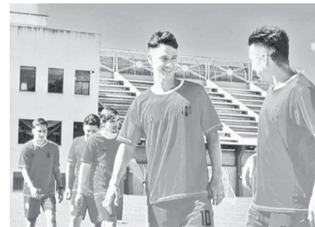
Uno de los entrenamientos de Independiente.

Se espera el apoyo de los aficionados para este nuevo desafío del club en un torneo internacional en la Copa Sudamericana.