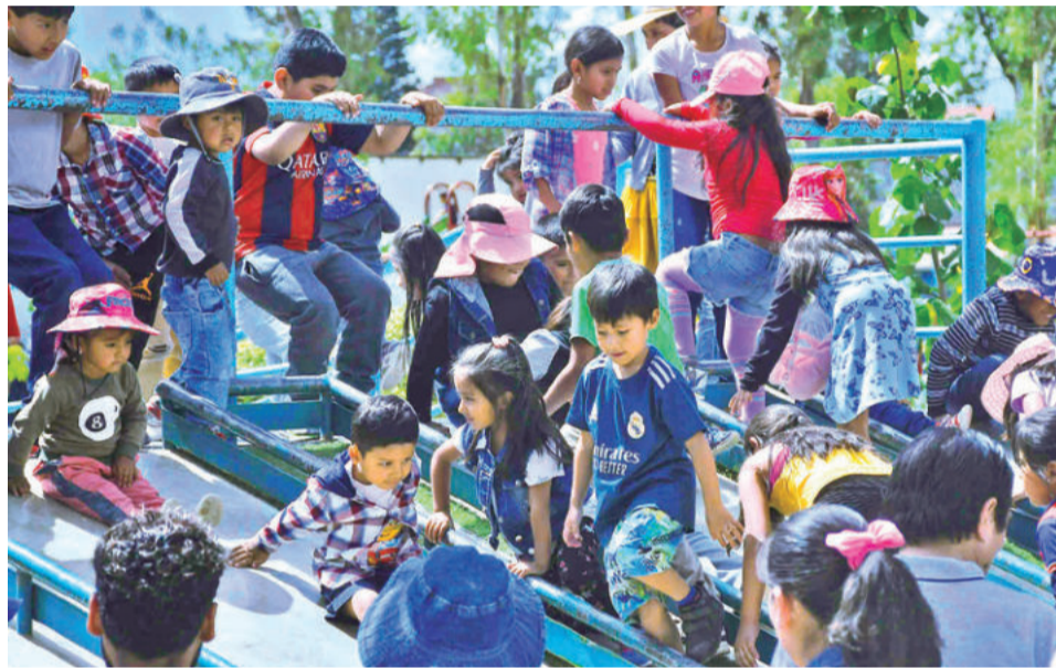
Un agasajo por el Día del Niño en Cochabamba (archivo). CARLOS LÓPEZ

con el nombre de los parques, las actividades y sus direcciones para que los cochabambinos puedan pasar ese día en familia”, señaló.