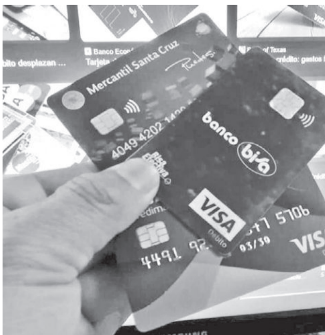
Tarjetas de crédito y débito. CARLOS LÓPEZ

Ayer, el dólar referencial se ubicaba en Bs 8,96 para la compra y Bs 9,15 para la venta.