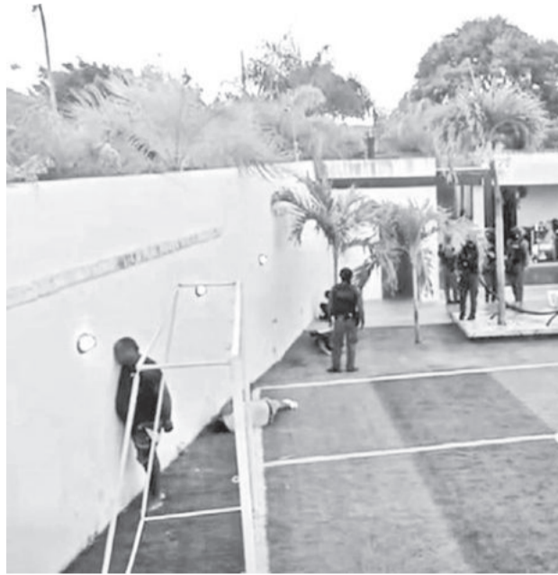
El lugar donde se desató la balacera en Santa Cruz.

Testigos relataron que algunos de los ocupantes del in-