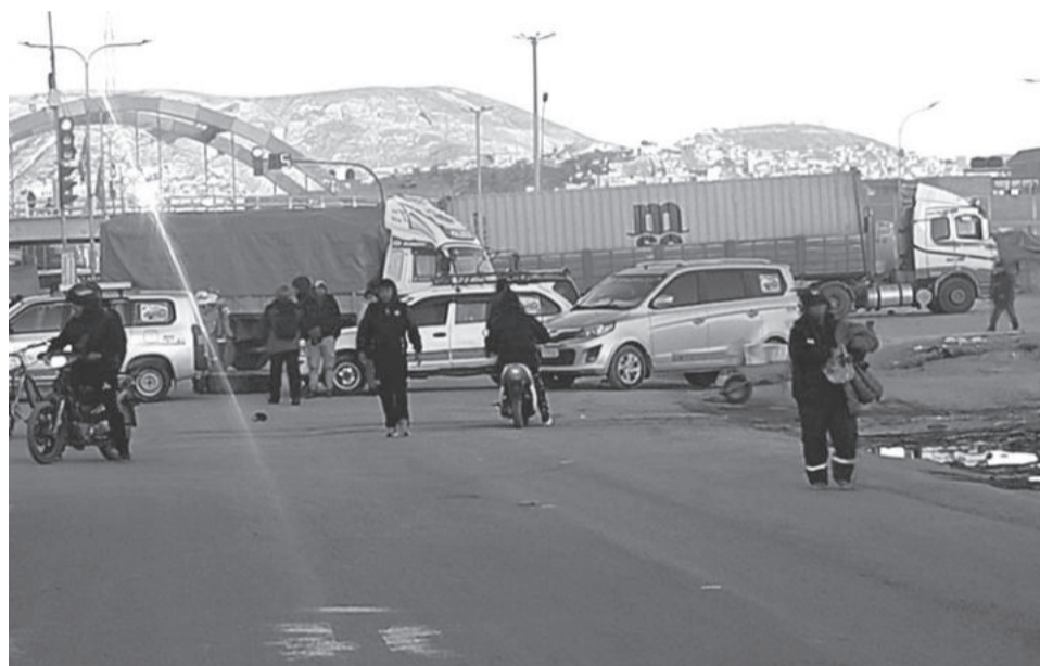
El bloqueo de carreteras en Oruro por parte de los transportistas.

presidente de Operaciones de YPFB, Sebastián Daroca, planteó iniciar la carga de gasolina especial en ocho estaciones de servicio habilitadas para ese combustible y la conformación de una comisión.