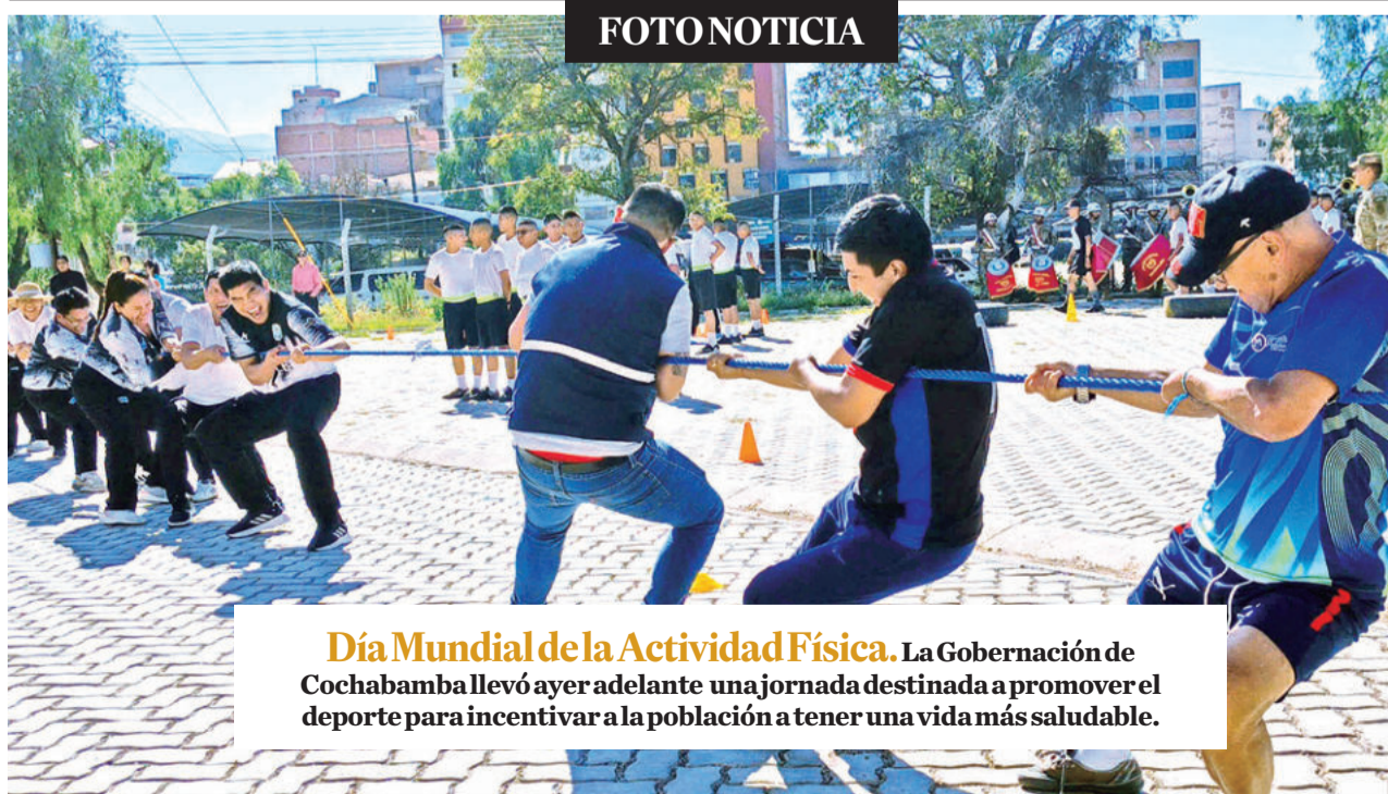
Día Mundial de la Actividad Física. La Gobernación de Cochabamba llevó ayer adelante una jornada destinada a promover el deporte para incentivar a la población a tener una vida más saludable.