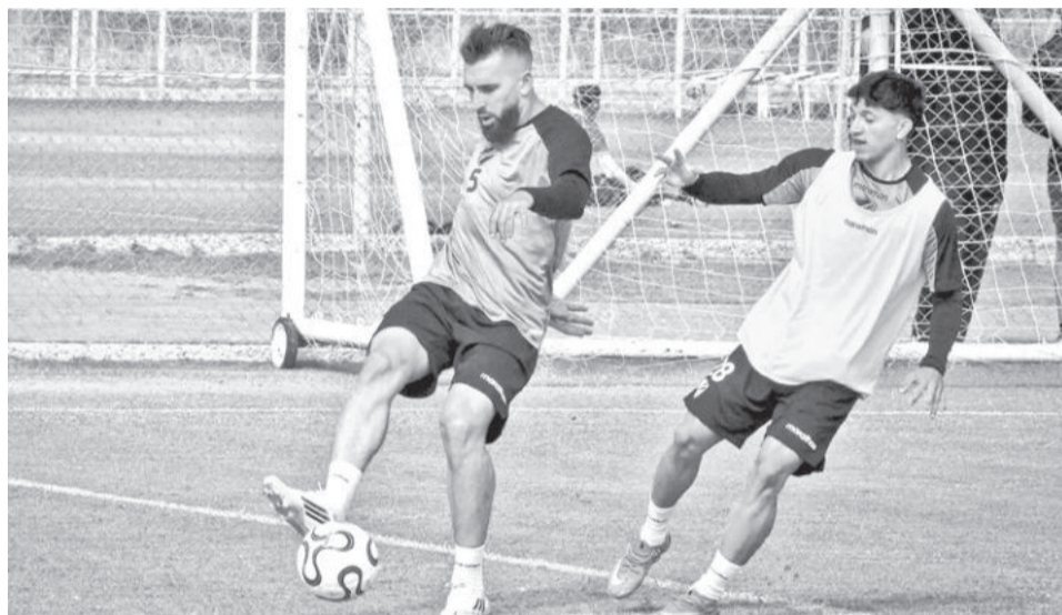
Los jugadores de Bolívar realizaron ayer su último entrenamiento.

La Copa Libertadores finalizará el 28 de noviembre en Montevideo, de Uruguay el rival de Bolívar enfrentará por primera vez este campeonato, además de ser uno de los