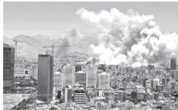
Ataque aéreo israelí contra Teherán.

La astronauta Christina Koch intervino para reparar una pieza que se había atascado en el inodoro. Su actuación permitió recuperar el funcionamiento del sistema que les trajo problemas.