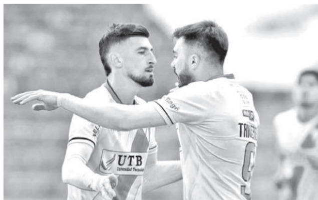
Always Ready durante un partido. MARKA REGISTRADA

El elenco boliviano llegará a este compromiso después de golear a Real Tomayapo por 4 a 0 en el mismo escenario deportivo donde debutará