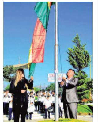
El inicio del mes aniversario. GAMC

Durante su intervención, la autoridad municipal invitó a la ciudadanía a ser parte de las actividades programadas por el aniversario, señalando: “Vamos a invitar a toda la población cochabambina a que pueda compartir esta alegría, este cumpleaños de Colcapirhua junto a todos los colcapirhuesos”.