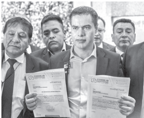
Un ampliado del MAS realizado en 2022.

El segundo anteproyecto se centra en la reforma del régimen disciplinario aplicable a los administradores de justicia. Se propone una nueva escala de sanciones: para faltas leves, suspensiones de entre uno y seis meses; para faltas graves, de uno a dos años; y para faltas gravísimas, la destitución.