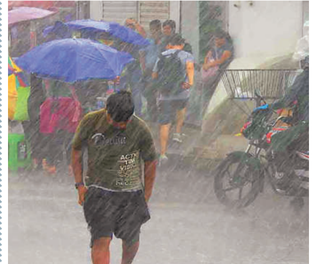
LLUVIA: Este martes, la capital cruceña sufrirá precipitaciones.

El Servicio Nacional de Meteorología e Hidrología (Senamhi) y especialistas del sector agrometeorológico confirmaron el ingreso del primer frente frío de otoño para hoy, martes 7. El fenómeno afectará principalmente a las tierras bajas del país y provocará un descenso marcado de las temperaturas tras un verano prolongado que alcanzó sensaciones térmicas de 40 grados Celsius en la capital cruceña.