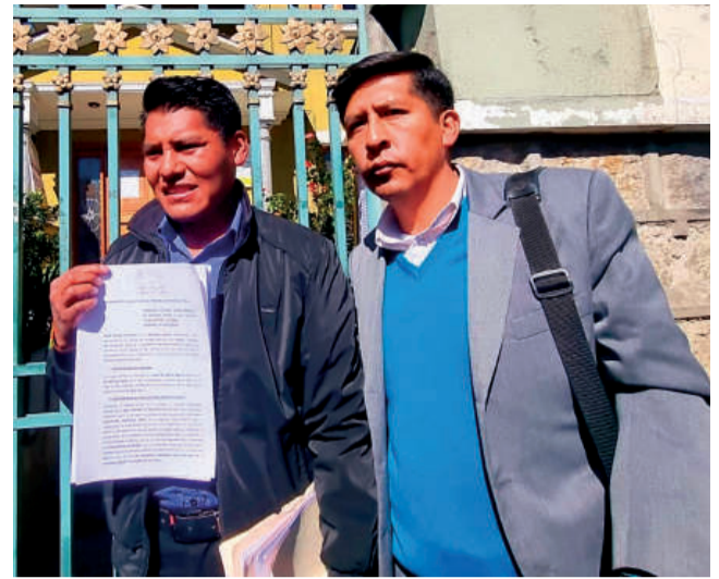
DATO. El excandidato de NGP dejó su petición en el TSE.

La Federación Departamental Única de Trabajadores Campesinos de La Paz “Túpac Katari” y sectores de las 20 provincias se declararon en estado de emergencia tras un cabildo en El Alto, debido a lo que consideran un “golpe a la democracia”.