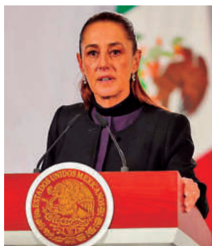
PRESIDENTA. Claudia Sheinbaum, de México.

La presidenta de México, Claudia Sheinbaum, negó ayer de manera categórica haber financiado movimientos políticos en Perú, en medio del actual proceso electoral en ese país, donde más de 30 aspirantes compiten por la Presidencia.