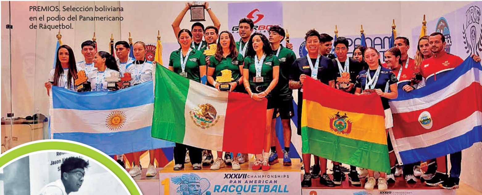
PREMIOS. Selección boliviana en el podio del Panamericano de Ráquetbol.