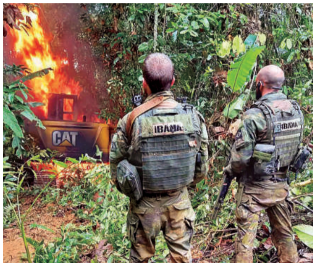
OPERATIVO. Efectivos de fuerzas de seguridad observan la destrucción de un campamento minero ilegal en Brasil.

Grupos criminales dedicados a la minería ilegal de oro en tierras indígenas de Brasil sufrieron pérdidas estimadas en 26 millones de reales (alrededor de 5,2 millones de dólares) tras la primera semana de una operación federal en la Tierra Indígena Sararé, en el estado de Mato Grosso (oeste), informó ayer el Gobierno.