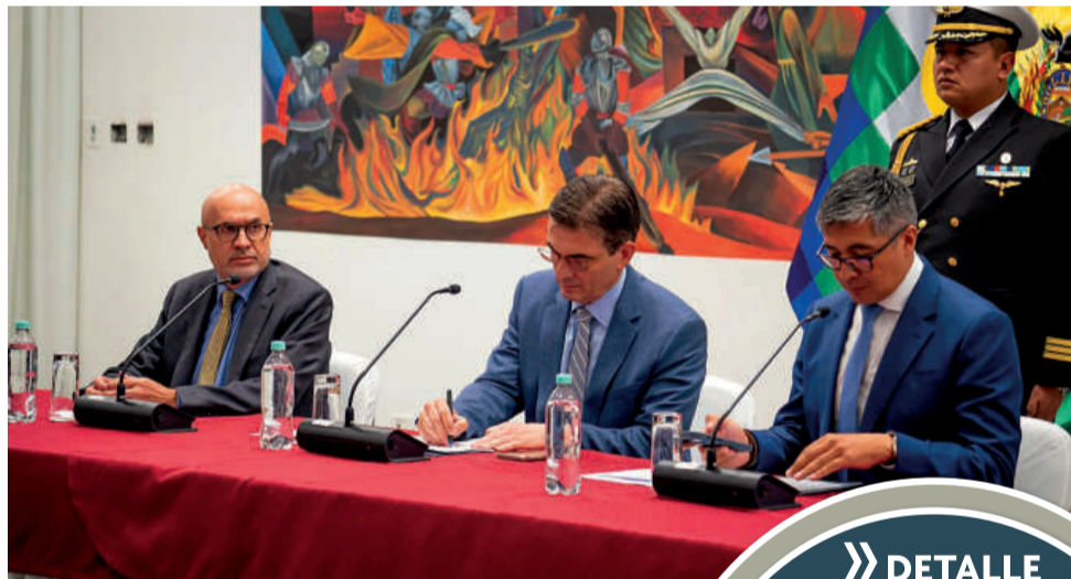
AUTORIDADES. Paz y dos de sus ministros en conferencia.

En una conferencia de prensa ofrecida ayer en la Casa Grande del Pueblo, el Mandatario calificó la medida como un “ataque directo a un modelo, a una ideolo-