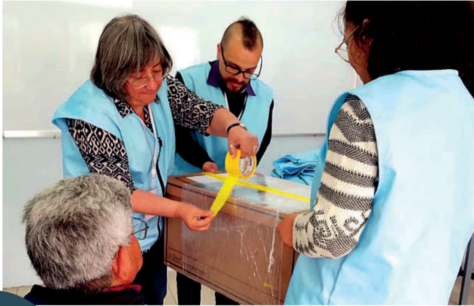
RESGUARDO: Personal de la consultora peruana sella las ánforas.