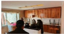
Lenocinio clandestino fue clausurado

La presencia de este tipo de actividades ilegales genera preocupación entre