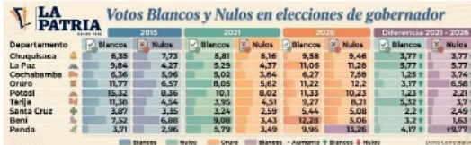
Gráfica comparativa de los votos blancos y nulos en las recientes elecciones subnacionales en Bolivia (con datos del Órgano Electoral Plurinacional) / I.A. INIUMA

• El voto blanco y nulo aumentó en las elecciones de gobernadores 2026, superando cifras de 2021 en varias regiones del país