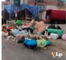
El tema de la basura en el mercado Roberto Young ya es recurrente.

• Problemas de "basura en Oruro": la falta de educación ambiental y la intensa actividad comercial afectan la limpieza del área