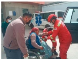
Una mujer fue socorrida por labor de parto a un centro de salud

actividad. Por eso, desplazamos personal de la Policía y con solo su presencia, se retiraron del lugar", comentó un oficial.