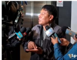
El diputado Macedonio Vargas asegura que los crímenes están relacionados con el narcotráfico

Vargas pidió mayor coordinación con la Policía y el Ministerio de Gobierno, enfatizando que no es correcto que cualquier ciudadano pueda portar un arma y disparar contra otra persona. Du-