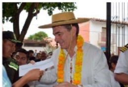
Tras emitir su sufragio, el mandatario ofreció una conferencia de prensa en la que delineó la agenda de trabajo con las nuevas autoridades regionales y municipales

de convocar a las brigadas parlamentarias de todas las bancadas para establecer un cronograma de trabajo ordenado. "No se trata de grupos políticos, estamos construyendo un gran centro para trabajar por el futuro de la patria", concluyó antes de retirarse del recinto educativo.