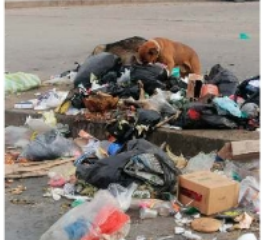
Los perros contribuyeron a la proliferación de los residuos. LA PATRIA

La zona Sur de Oruro despertó con varios promotorios de basura, lo que generó molestia entre los vecinos. Este problema se tornó evidente durante la tradicional feria dominical en el mercado Roberto Young y sus calles adyacentes, además de coincidir con la jornada electoral. Muchos ciudadanos consideran estos espacios como focos de infección. La reacción oportuna de los trabajadores de la Empresa Municipal de Aseo Oruro (EMAO) mitigó los basurales acumulados.