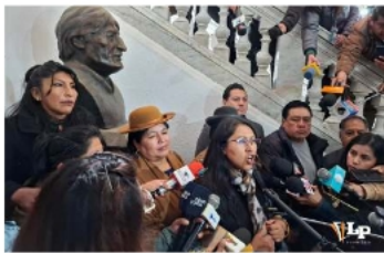
El busto de Evo Morales permanece en el Legislativo pese a cumplimiento del plazo

El miércoles 18 de marzo, la resolución cameral aprobada otor-