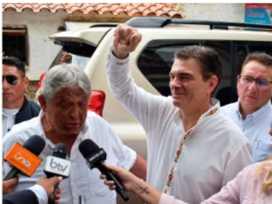
Rodrigo Paz cumple con su tradición democrática en su tierra natal, previo al inicio de una nueva fase de gestión descentralizada

Durante su intervención, el presidente delineó los ejes que marcarán la agenda nacional en los próximos meses. Primero, sobre Autonomía Real (El proceso 90-90), aclaró que no se trata solo de repartir recursos, sino de profun-