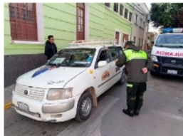
Agentes del orden controlan el tránsito durante el domingo de elecciones

La tarde del domingo, agentes intervinieron un Tinkunaco en la urbanización Pumas Andinos. Según el reporte policial, había cerca de 100 personas en el evento, aunque se descartó el consumo de bebidas alcohólicas. "Vecinos nos llamaron y nos informaron que había 100 personas realizando esta