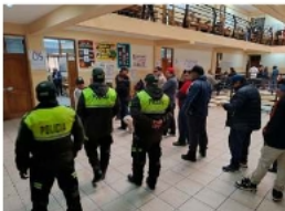
Tras emitir su voto, 20 personas fueron aprehendidas por asistencia familiar

LA jornada electoral dejó un saldo de 20 aprehendidos por incumplir asistencia familiar y cuatro personas por otros delitos