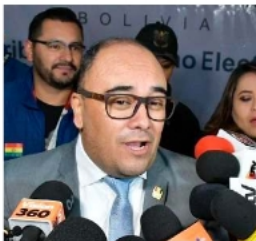
El presidente del TSE, Gustavo Ávila, declaró después de la inauguración de las subnacionales

Ávila subrayó que uno de los objetivos centrales de la nueva ley será blindar la independencia del Órgano Electoral. "La independencia que tiene que tener el Órgano Electoral es ser el único órgano con jurisdicción electoral, y eso debe estar claro y específico en la nueva norma", sentenció. El cronograma para esta iniciativa legislativa comenzará inmediatamente después de que el TSE entregue las creden-