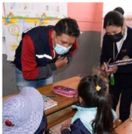
Por leve aumento de resfrios, piden usar el barbijo

Además, reiteró el llamado a mantener las medidas de bioseguridad, como el uso de barbijo, el distanciamiento físico y el lavado frecuente de manos. Esto es especialmente relevante ante el ingreso paulatino a la temporada de invierno, periodo en el que suelen incrementarse las enfermedades respiratorias.