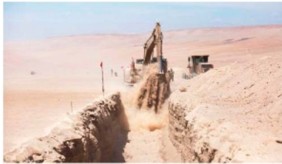
Los trabajos de Chile en la frontera con Bolivia

"El mensaje es unec el inmigrante irregular no es bienvenido", afirmó.