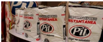
Alicadía ajusta compra de leche escolar /A. PRITTA

La próxima semana comenzará el proceso de licitación para adquirir leche en polvo destinada a estudiantes del municipio. La entrega está programada para la última semana de abril, aunque se ajustarán las cantidades debido al aumento de precios en el mercado.