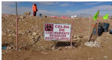
Celda de residuos hospitalarios en Oruro entra en fase de cierre.

La futura celda para residuos hospitalarios en Oruro busca ampliar la vida útil del sistema actual y mejorar la gestión integral