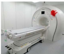
Resonador magnético no está en funcionamiento

La senadora vinculó este caso con otros cuestionamientos en el sistema de salud local, como el del tomógrafo del centro de salud María Auxiliadora. Este también fue observado por presuntas irregularidades en su adquisición y nunca entró en funcionamiento. A su juicio, estas adquisiciones, en un contexto de limitaciones económicas, perjudican directamente a la población. "Nos han dejado sin recursos y con estas compras insulsas, a