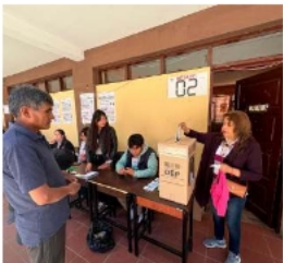
Elecciones subnacionales se vivirán hoy