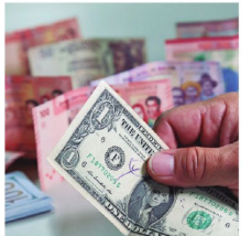
Dólares libres de impuesto

En síntesis, el Gobierno libera un canal clave para la economía cotidiana. El desafío ahora es asegurar que haya suficientes dólares para sostenerlo.