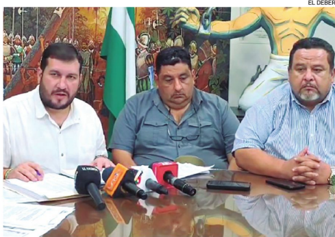
Los cívicos cruceños expresaron su molestia con la situación

La medida comenzó pasado el mediodía. Los movilizados denuncian irregularidades y exigen nueva elección de alcalde