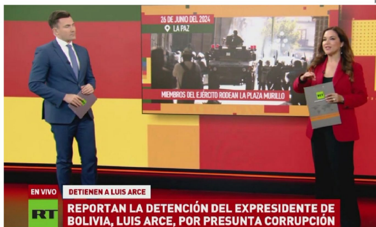
Captura de pantalla de un programa de RT, señalado por ser un medio de desinformación ruso.

Mientras unos anuncian la conformación de una comisión especial para la investigación, desde la Comisión de Política Internacional no se descarta solicitar una explicación a la representación diplomática rusa en Bolivia para asumir las medidas legales.