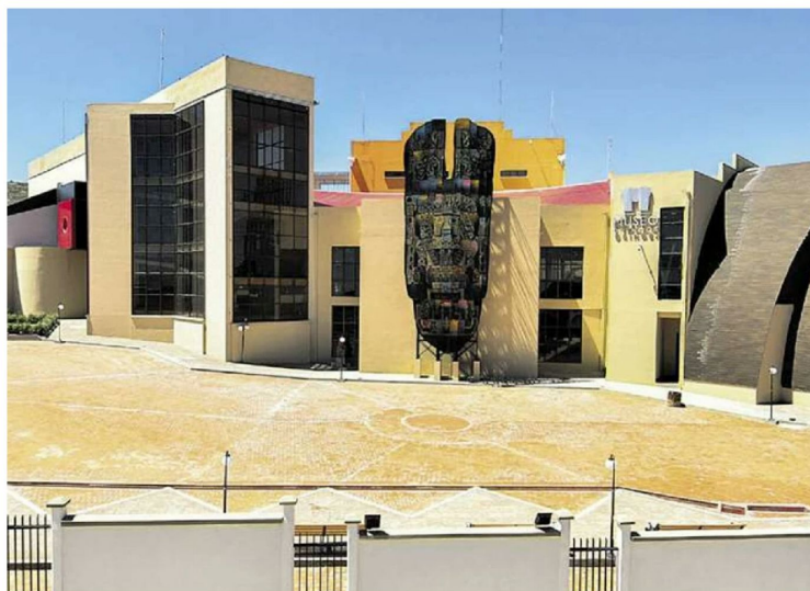
El museo de Orinoca es una de las obras cuestionadas que se ejecutó por contratación directa.

Se estima un daño económico de más de $us 96 millones y más de Bs 7.930 millones. El Gobierno pone en vigencia el Decreto 5600 que también dispone una revisión de las contrataciones directas en ministerios y empresas públicas.