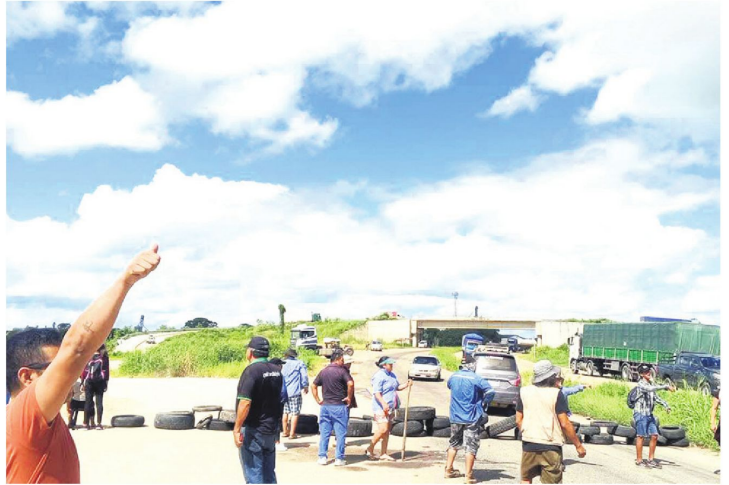
El corte se realiza a la salida del municipio, en la vía a Buenavista (carretera nueva a Cochabamba).

Con el cómputo concluido, Santa Cruz cierra una etapa marcada por conflictos, denuncias y ajustes institucionales, y se encamina a una definición clave que no solo elegirá a su próxima autoridad departamental, sino que pondrá a prueba la capacidad de articulación política en un escenario sin mayorías claras.