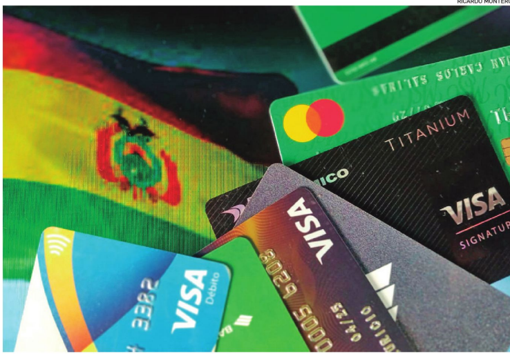
Las tarjetas de débito y de crédito de Bolivia pueden ser nuevamente utilizadas para pagos por internet

nando Romero advierte que la medida va a incrementar la demanda de dólares, ya que cada transacción implica salida de divisas.