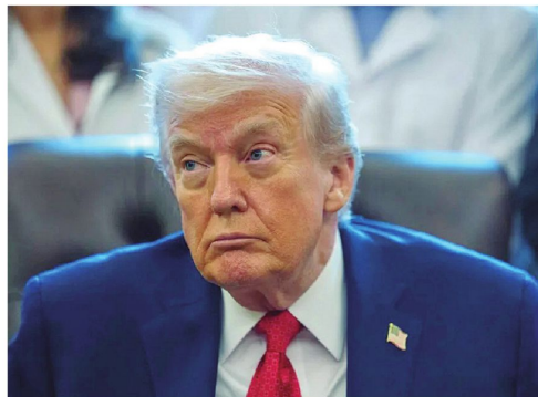
Trump dio plazo hasta hoy para que Irán reabra el estrecho de Ormuz

Posteriormente, el mandatario fue consultado sobre las propuestas de paz que se han planteado desde Irán y respondió diciendo: