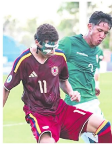
Bolivia y Venezuela marchan en los últimos lugares en la clasificación general

Seis selecciones irán directo al Mundial, la séptima jugará un repechaje.