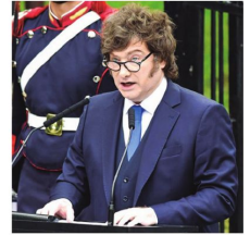
El presidente argentino

Por su lado, Maduro y su esposa hicieron un llamado el pasado fin de semana en X a la unidad, el diálogo y la reconciliación en el país suramericano.