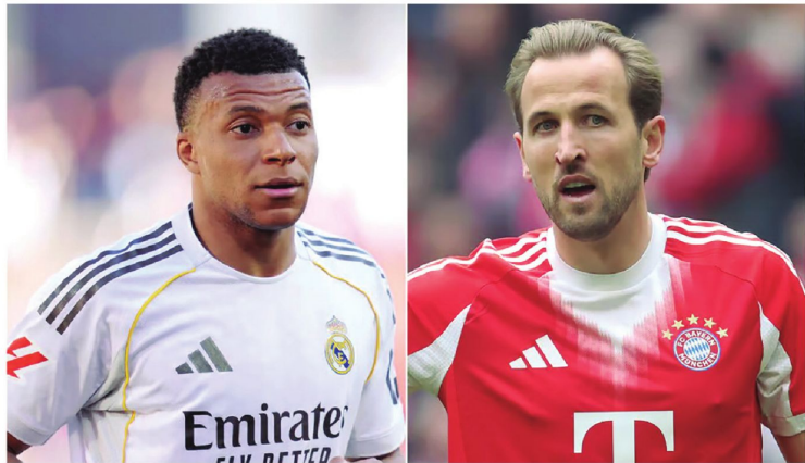
Kylian Mbappé de Real Madrid y Harry Kane de Bayern Múnich son cartas de gol en sus respectivos equipos. Hoy no pueden fallar

El equipo blanco no tiene margen de error. Se juega la última bala para ganar un título este año ante uno de los mejores del mundo