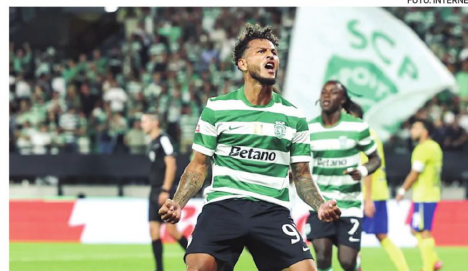
Colombiano Suárez celebra uno de sus goles con la camiseta del Sporting de Lisboa

El desafío es mayúsculo para los españoles y alemanes que sueñan con no fallar.