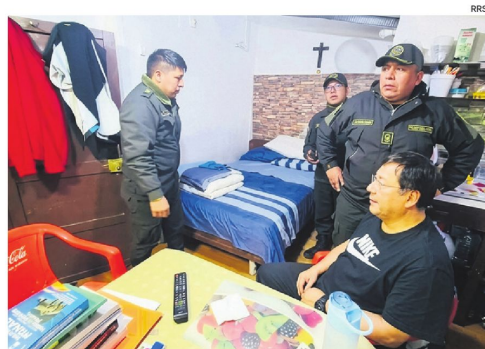
Esta es una de las imágenes que circula del expresidente en San Pedro

Arce, detenido desde el 12 de diciembre de 2025 por el caso Fondo Indígena, aseguró que no ha cometido delitos y denunció la vulneración de sus derechos. Indicó que todas las solicitudes de su defensa fueron rechazadas, incluyendo exámenes médicos recomendados por un cardiólogo, lo que —según él— pone en riesgo su salud. También afirmó que es