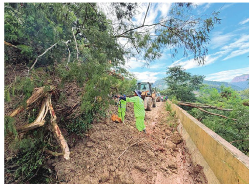
Retiro de los árboles que cayeron sobre la carretera a los valles

Según el reporte oficial, la vía se encuentra transitable con precaución, principalmente en los sectores de Chorro Viejo, Petacas y el