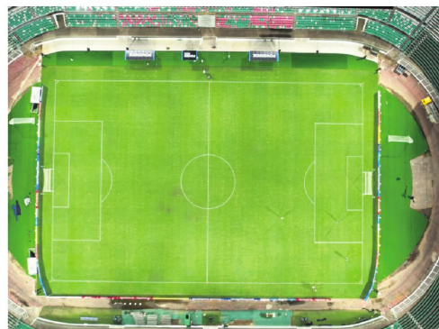
Las luminarias del escenario deportivo cruceño fueron ensayadas con éxito el lunes.

Cortez explicó que se hicieron ajustes técnicos en las luminarias, principalmente en la parte de la automatización y en el sonido para que las pantallas pue-