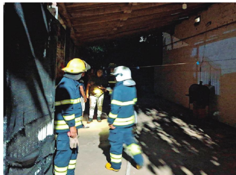
Así quedó el inmueble donde fueron asesinados tres hombres

Los vecinos alertaron el hecho a la Policía y acudieron efectivos de bomberos, de la Felcc y fiscales. Se verificó tres cuerpos calcinados que de inmediato fueron