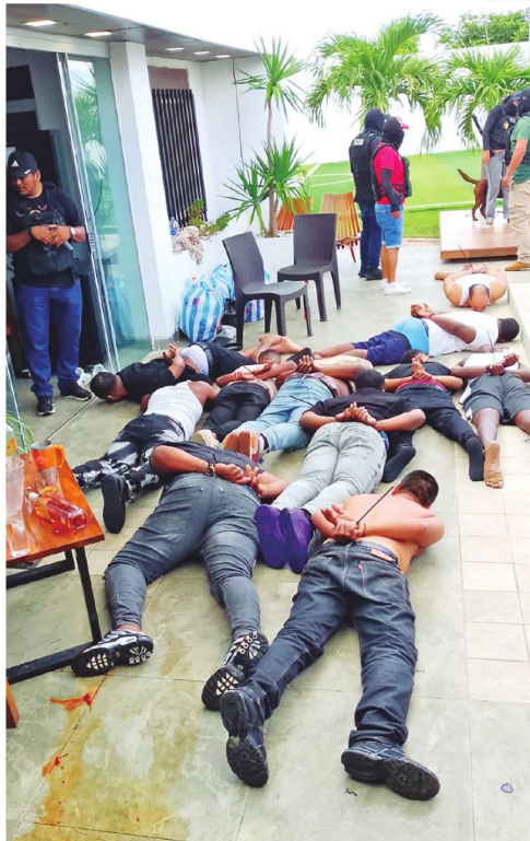
Así fueron reducidos los extranjeros armados en Paurito

Durante la requisita, la Policía secuestró al menos tres armas de fuego calibre 9 milímetros, además de objetos personales. El inmueble, una casa quinta,