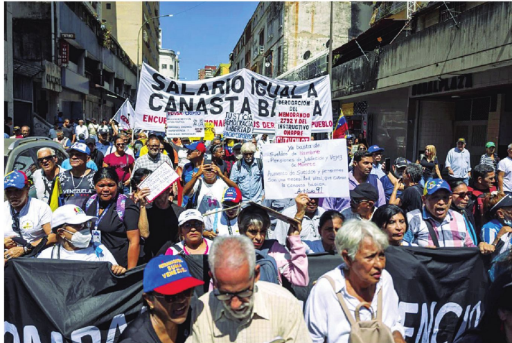
Hubo protestas de los trabajadores en Caracas y otras ciudades, para exigir mejoras salariales

Para Cabello, ese período "fue un duro golpe para quienes, de alguna manera, intentaron dar