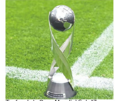
Trofeo de la Copa Mundial Sub-17

Bolivia se jugará la vida este miércoles ante Perú. Tras la dura derrota 5-0 frente a Brasil en el debut y el empate ante Venezuela, la Verde suma un punto y está obligada a ganar para mantener sus opciones de clasificar directo al Mundial o aspirar al repechaje. Su último partido será con Argentina el domingo.