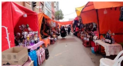
Las ferias deben cumplir los plazos de asentamiento