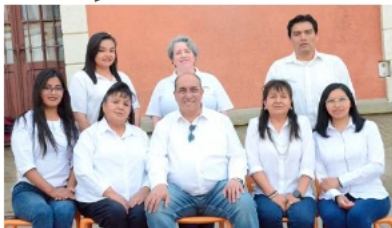
LA PATRIA, un equipo que trabaja con pasión y cariño por Oruro y Bolivia