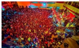
Ley prohíbe fiestas en unidades educativas tras hechos en el "Saracho Fest"