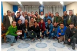
Agasajo marcó la víspera del Día del Padre

Durante el encuentro, se entregó un presente conmemorativo: una edición especial de botellas personalizadas, elaboradas exclusivamente para los padres del Colegio. Estas botellas incluían el logotipo institucional y