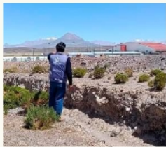
Defensoría del Pueblo realizó una inspección al lugar /ILUCCACION DEFENSORIA ORURO