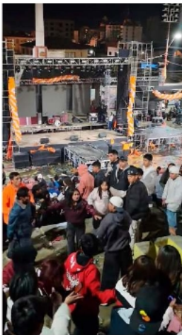
Riñas y peleas se registraron al finalizar el evento público

El incidente ocurre en medio de una seguidilla de cierres de campaña y actividades políticas en la ciudad. Esto obliga a replantear la gestión y control de los espacios públicos para evitar nuevos conflictos.