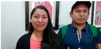
Artistas se pronuncian y piden normativa acorde a sus necesidades

Además, cuestionó el enfoque de la propuesta normativa al mezclar conceptos amplios como cultura y patrimonio con el ámbito específico de las artes. Esto, a su juicio,