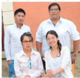
Donde la precisión se convierte en legado: el equipo de diseño e impresión de LA PATRIA