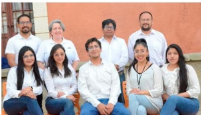
Sala de Información: el corazón que late en cada página de LA PATRIA / LA PATRIA

El matutino LA PATRIA de Oruro celebra este 19 de marzo su 107 aniversario, reafirmando su condición de "Subdecadano de la Prensa Nacional" y su papel histórico en la defensa de las libertades públicas y los intereses del país. Fundado en 1919 por Demetrio Canelas, Gabriel Palenque, Francisco Figando y Florián Zambrana, entre otros, nació en un contexto de auge minero y ferroviario que convirtió a Oruro en un centro industrial, comercial y cultural de Bolivia. Ahora se proyecta con nuevos desafíos en bien de la ciudadanía oreña y nacional.