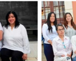
LA PATRIA, cuna de la nueva generación del periodismo oreño / LA PATRIA

tener vigencia en un mundo digital en constante cambio. La historia del diario refleja una evolución sostenida: desde las cajas tipográficas, linotipos y las máquinas de teletipo, pasando por los cables internacionales y la mecanización, hasta el salto tecnológico de los años 2000